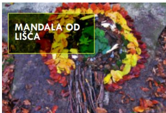
Slika 6. Mandala od lišća

Jedan od primjera kreativnih aktivnosti je : Izrađivanje mandale od lista. U ovoj aktivnosti djeca samostalno ili grupno prema zadanom primjeru crtaju krug na zemlji pomoću grančice na koji kasnije slažu lišće u boji i obliku mandalu.