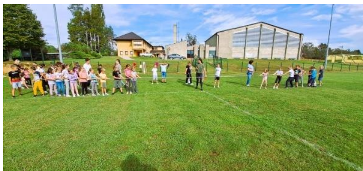
Slika 3. Elementarna igra „ potezanje konopa“