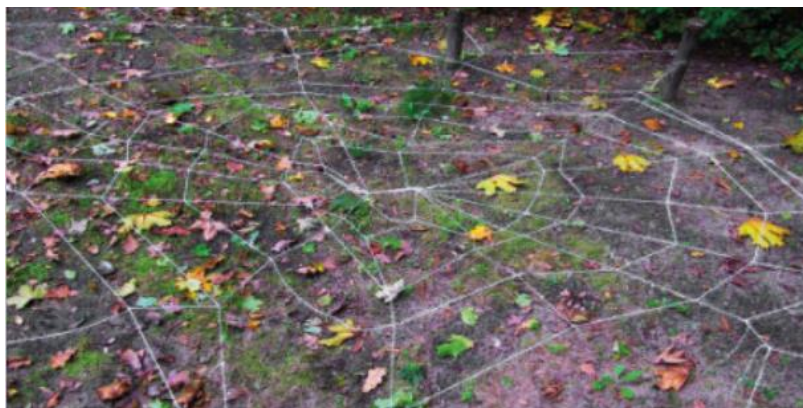
Slika 2. Elementarna igra „ Paukova mreža “

Prije same igre učiteljica pomoću žice ili špage izradi paukovu mrežu na zemlji pored nekoliko drveća. Pravila igre: Djeca pažljivo koračaju odnosno hodaju po mreži od najšireg prema najužem dijelu ali pritom ne smiju dotaknuti žicu ili uže. U slučaju da dotaknu žicu vraćaju se na početak. U ovoj igri su vrlo bitne vještine spretnosti.