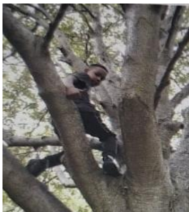
Slika 4. Elementarna igra „ Penjanje na stablo“

Još neke od igara koje se primjenjuju u prirodi, a u sklopu su projekta škole u prirodi su : 1. penjanje na drveće gdje se djeca penju na velike visine kako bi doživjeli prirodu iz ptičje perspektive, 2. igra brzine gdje se djeca velikom brzinom ljuljaju na vinovoj lozi, 3. igra s predmetima gdje djeca uče zapaliti vatru pomoću grančica... (Cree i Robb, 2021).