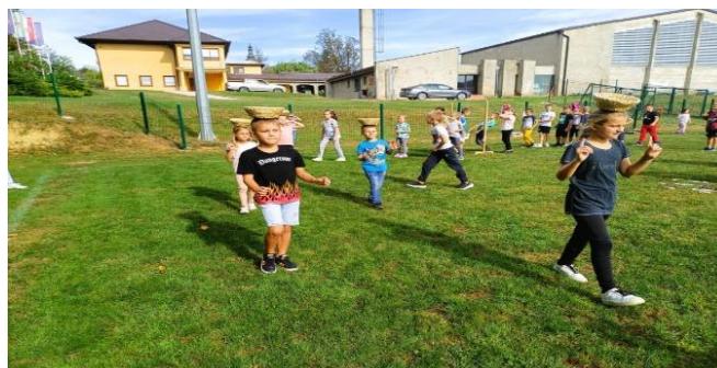
Slika 5. Elementarna igra „ Nošenje košare na glavi“