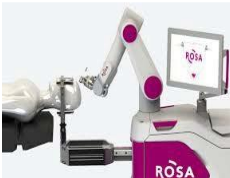
Slika 19. Rosa robotski sustav