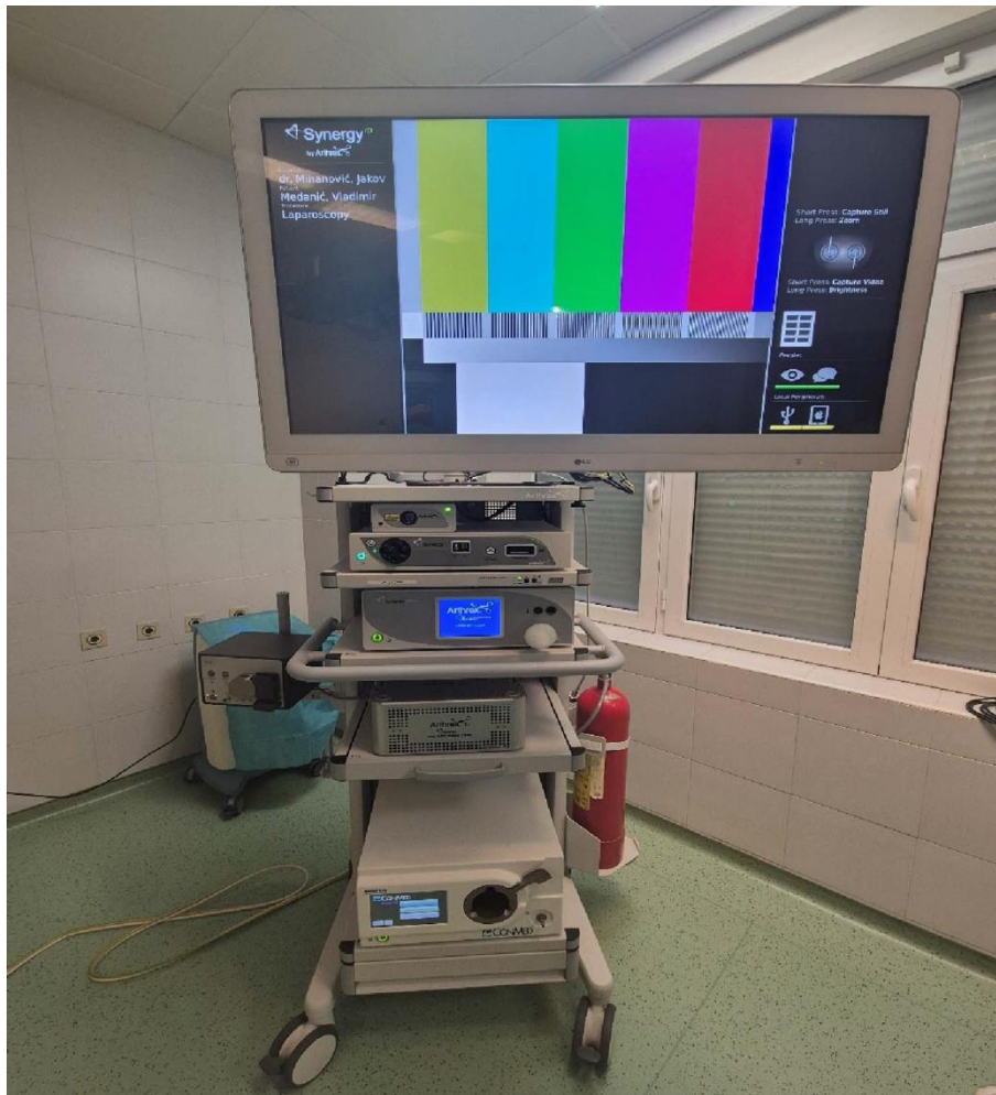
Slika 4. Prikaz operacijskog stup za izvođenje laparoscopske operacije

Druga jedinica je insuflator ili uređaj na koji se spaja cijev kroz koju CO 2 dolazi do abdomena i stvara pneumoperitoneum. Na insuflatoru se prati količina intraabdominalnog tlaka te se ista može podešavati prema potrebama zahvata.