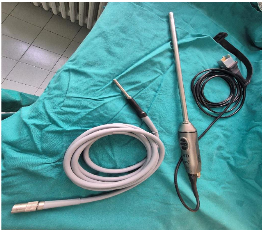
Slika 8. Prikaz hladnog svjetla i kamere za Vats

kontrolom kamere/torakoskopa koji sadrži optička vlakna te se uvodi kroz trokar u interkostalni prostor. Incizija kroz koju se uvodi trokar iznosi 3 do 5 cm, a dodatan rez radi se zbog uvođenja dodatnih instrumenata potrebnih za izvođenje biopsije, lobektomije, drenaže i sličnih postupaka te iznosi 5 cm . Torakoskop sa zakrivljenošću leće pod kutom od 0 ili 30 stupnjeva je spojen sa kamerom i izvorom hladnog svjetla, a sve komponente spajaju se na uređaj ili procesor slike, koji je povezan sa ekranom na kojem je prikazana slika pleuralnog prostora.