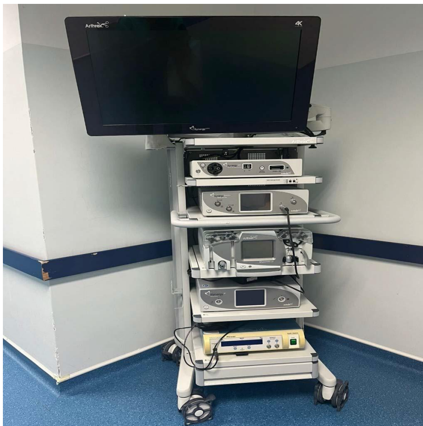
Slika 16. Prikaz stupa za artroskopiju