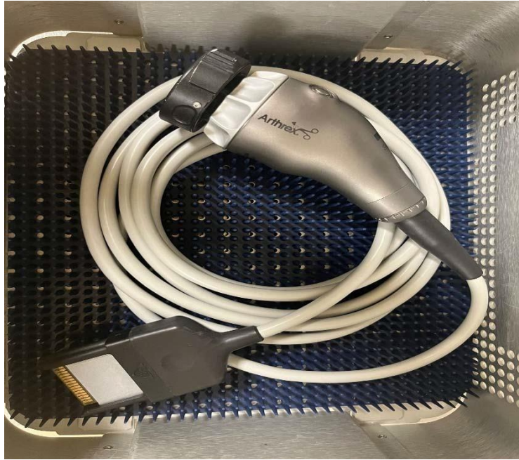
Slika 2. Prikaz kamere

Cijeli adekvatno pripremljen laparoskop spaja se na uređaje koji su povezani sa ekranom na kojem se prikazuje slika nakon uvođenja laparoscopa unutar abdomena. Prvi uređaj služi za spajanje kamere pomoću koje će nastati vizualni prikaz abdominalnog prostora.