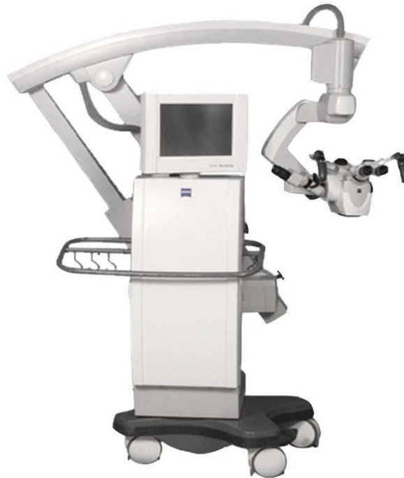
Slika 13. Prikaz neurokirurškog mikroskopa

osvjetljavanje infracrvenim svjetlom za označavanje intraoperativne angiografije nakon primjene ICG-a (7).