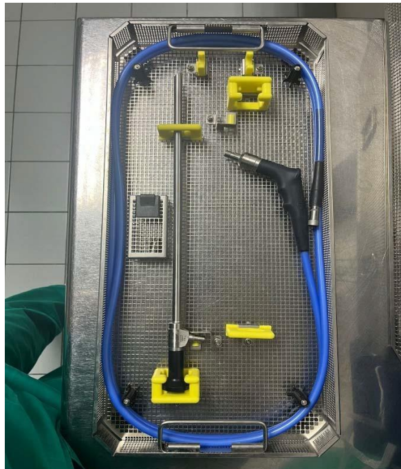
Slika 1. Prikaz laparoscopa/teleskopa

Danas je laparoskopija jedna od najčešćih kirurških metoda pomoću koje se izvode abdominalni operativni zahvati. U odnosu na prošlost metoda je postala unaprijeđena te se danas izvodi uz pomoć dodatne opreme uvedene razvojem tehnologije. Neizostavan dio opreme je laparoskop/teleskop; dugi, tanki instrument sa kamerom i svjetlom na vrhu. Postoji dvije vrste laparoscopa. Razlika je u zakrivljenosti leće pa razlikujemo laparoskop čija je zakrivljenost leće pod kutom od 0 stupnjeva i pod kutom od 30 stupnjeva.