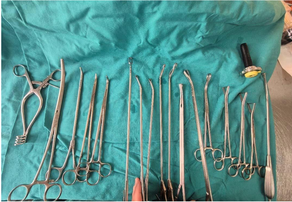
Slika 10. Prikaz Vats instrumenata