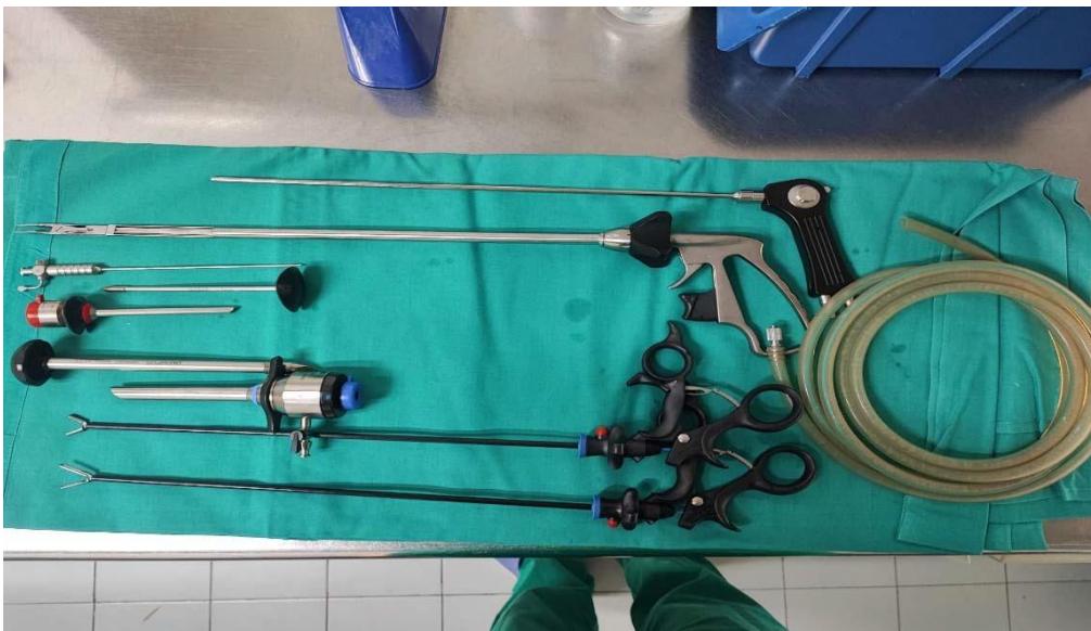
Slika 5. Prikaz laparoskopskih instrumenata

Prednost laparoskopije je pošteniji operacijski zahvat, manji ožiljak, smanjena učestalost postoperativnih infekcija, brži oporavak te smanjeno vrijeme hospitalizacije.