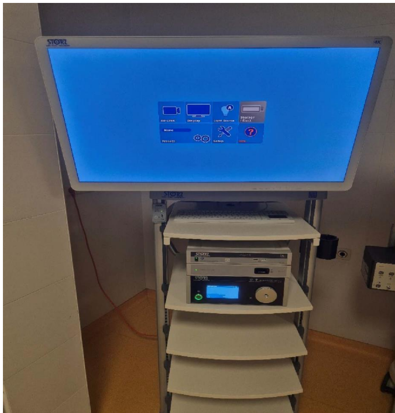
Slika 7. Prikaz stupa za izvođenje Vats operacijskih zahvata

Osim laparoskopije jedna od poštenijih kirurških metoda je i Vats metoda. Vats metoda označava video asistiranu torakoskopsku kirurgiju. Ovom metodom uz pomoć posebne opreme ulazi se u pleuralni prostor te se postiže vizualizacija tog istog prostora.