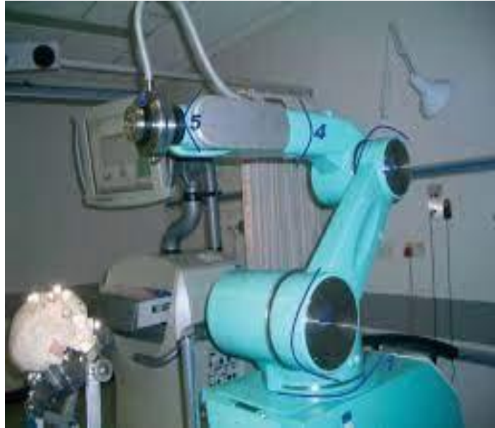
Slika 18. PathFinder robotski sustav