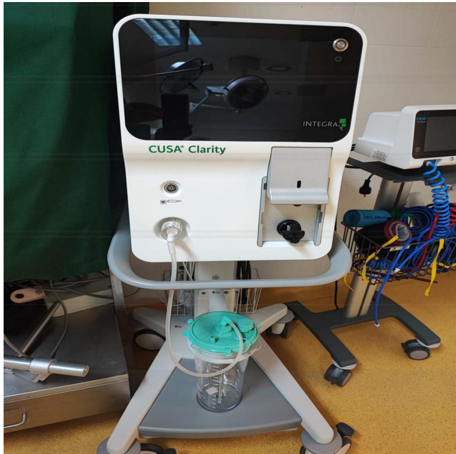
Slika 15. Prikaz Cusa sustava