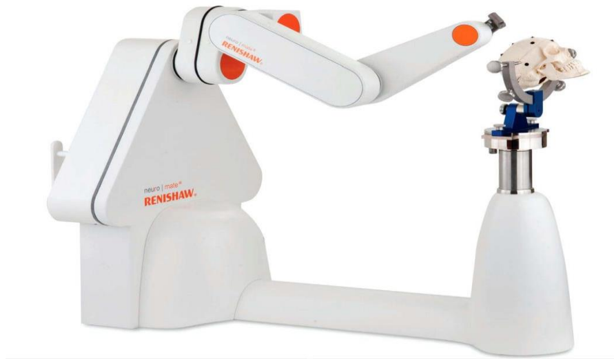
Slika 17. NeuroMate robotski sustav

dio robotske ruke (11). Nastavak tada ima ulogu držača za instrumente. Nadalje, vrši se snimanje CT-om pri čemu se pozicionira glava te se registrira prostor za rad. NeuroMate sustav koristi se i za postavljanje intrakranijalnih katetera u slučaju aspiracije tekućine iz cističnih tvorbi ili za aplikaciju kemoterapije u svrhu liječenja neoplastičnih tvorbi (11).