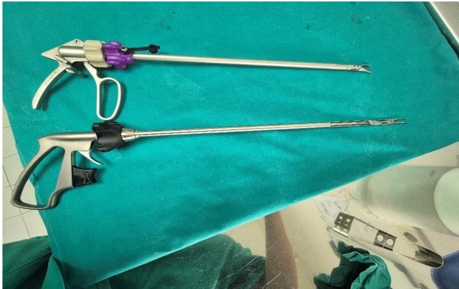
Slika 11. Prikaz klip aplikatora