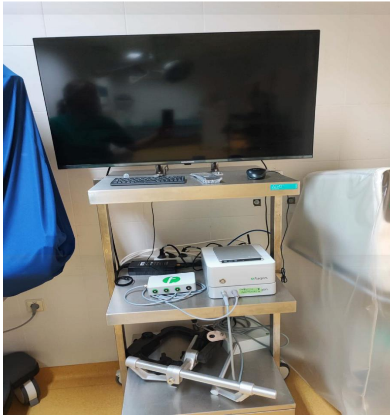
Slika 14. Prikaz neuronavigacijskog sustava

Neuronavigacija danas sastoji se od monitora, uređaja za lokalizaciju tumora, generatora te sonde/igle za određivanje lokacije tumora.