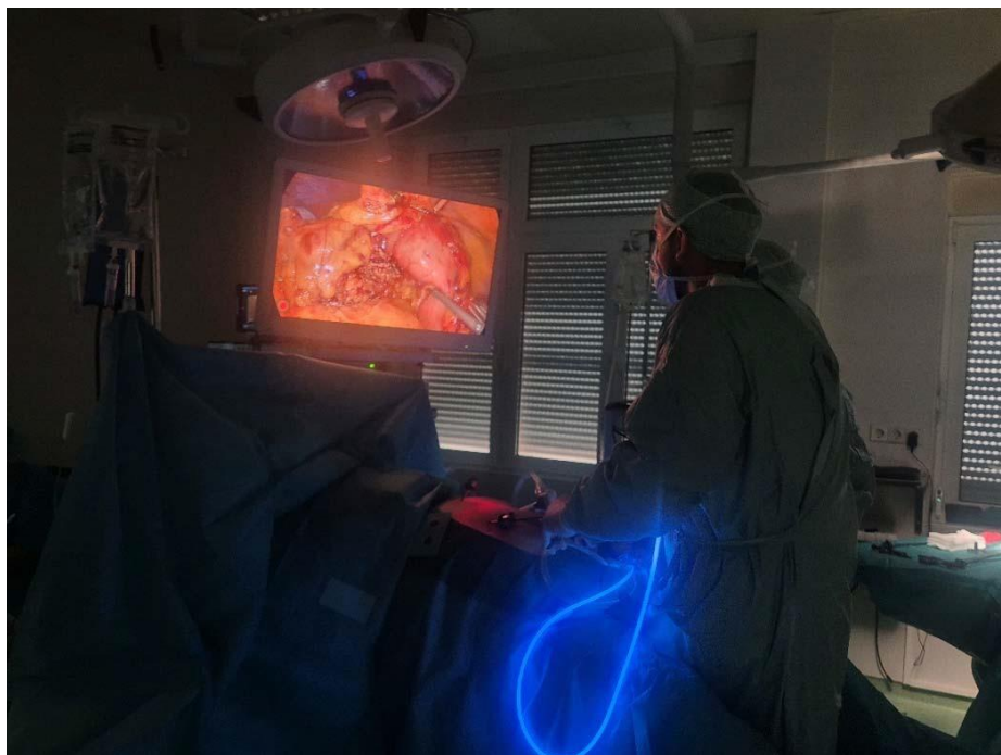
Slika 3. Prikaz laparoskopskog operacijskog zahvata

Cijeli adekvatno pripremljen laparoskop spaja se na uređaje koji su povezani sa ekranom na kojem se prikazuje slika nakon uvođenja laparoscopa unutar abdomena. Prvi uređaj služi za spajanje kamere pomoću koje će nastati vizualni prikaz abdominalnog prostora.