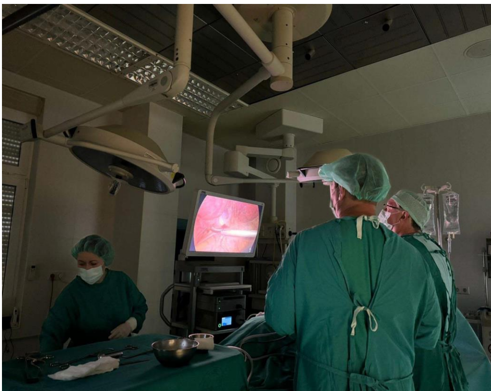
Slika 9. Prikaz operacijskog prostora tijekom Vats-a

Položaj pacijenta je desni ili lijevi lateralni položaj prema planiranom zahvatu. Za operativni zahvat u području medijastinuma potreban je ležeći položaj na leđima. Od instrumentarija potrebno je izdvojiti: