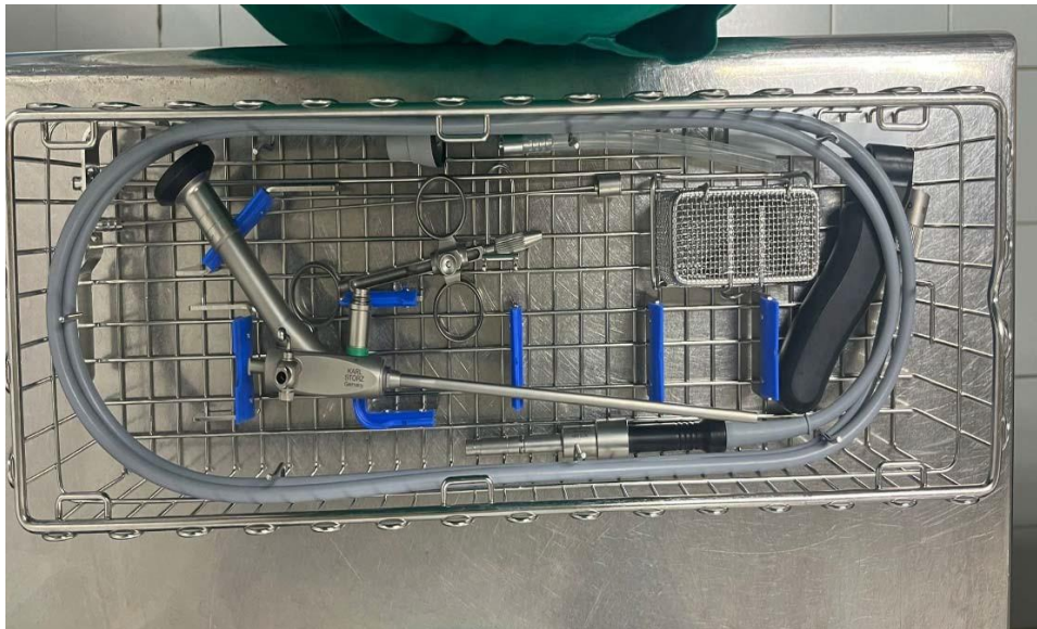
Slika 6. Prikaz fistuloskopa

VAAFT (Video potpomognuto liječenje analne fistule) izvodi se pod kontrolom fistuloskopa. Fistuloskop se sastoji od okulara pod kutom od 8 stupnjeva, optičkog kanala, radnog kanala, irigacijskog kanala i ručke. Promjer fistuloskopa iznosi 3.3 x 4.7 mm, a dužina 18 cm (3). Fistuloskop ima dva nastavka od kojih se na jedan spaja otopina za irigaciju. Cilj ovog zahvata je uklanjanje fistule, čišćenje kanala fistule i zatvaranje unutarnjeg fistulnog otvora (3). Prvi korak zahvata je uvođenje elektrode te uklanjanje kanala fistule laganom manipulacijom od vanjskog do unutarnjeg otvora fistule. Ukoliko postoji nekrotični dio uklanja se sa endočetkicom koja također čini potreban pribor za izvođenje fistuloskopije. Nadalje, otopina za irigaciju unosi se u prostor fistule jer se na taj način osigurava uklanjanje otpadnih tvari u prostor rektuma. Zatim slijedi zatvaranje unutarnjeg otvora određenim šavovima, ali potrebno je da trakt fistule ostane otvoren radi istjecanja sekreta (3).