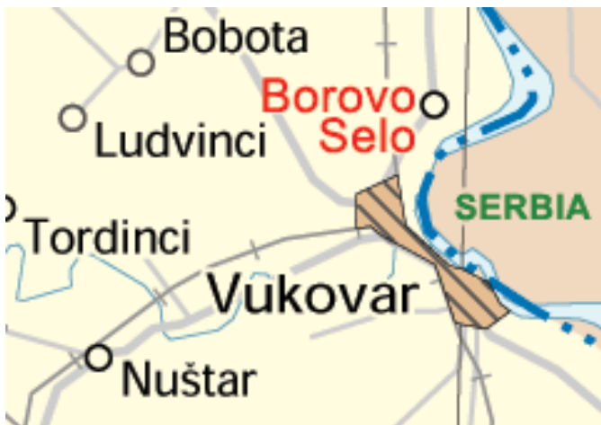
Slika 1. Geografski položaj Borova Sela

Nakon sukoba srpska policija odlučila je 2. svibnja 1991. godine u večernjim satima predati hrvatskoj policiji dva zarobljena policajca zbog kojih je taj pothvat i poduzet (Marijan, 2013).