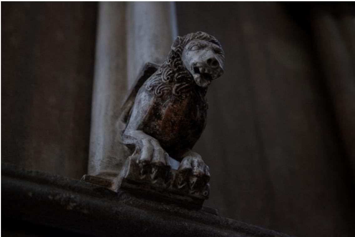
Slika 45. Prikaz lava pod stupićem koji podržava lectorile propovjedaonice katedrale Sv. Lovre u Trogiru