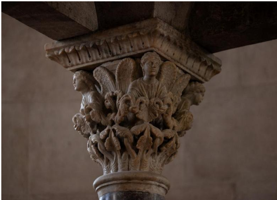
Slika 56. Kapitel ciborija katedrale Sv. Lovre u Trogiru