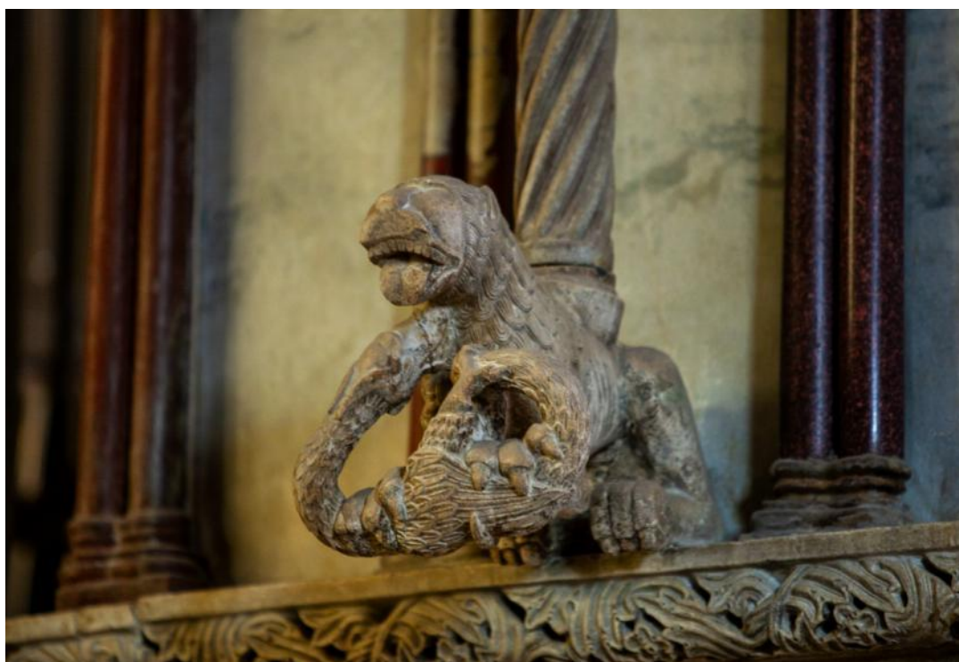
Slika 24. Prikaz lava sa zmajem pod tordiranim stupićem propovjedaonice katedrale Sv. Dujma u Splitu