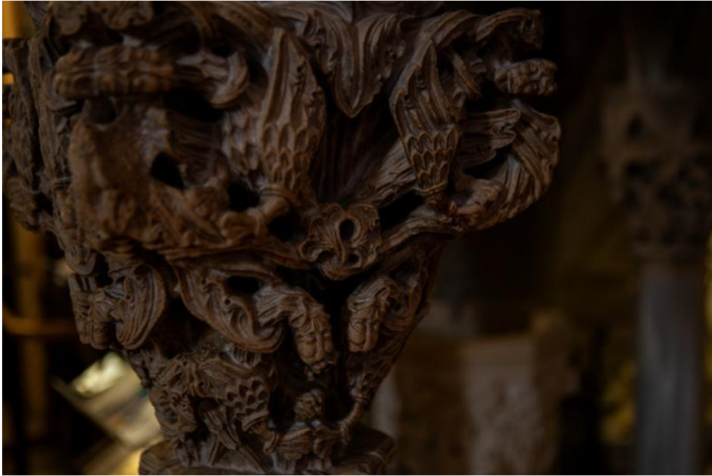
Slika 9. Detalj kapitela propovjedaonice katedrale Sv. Dujma u Splitu