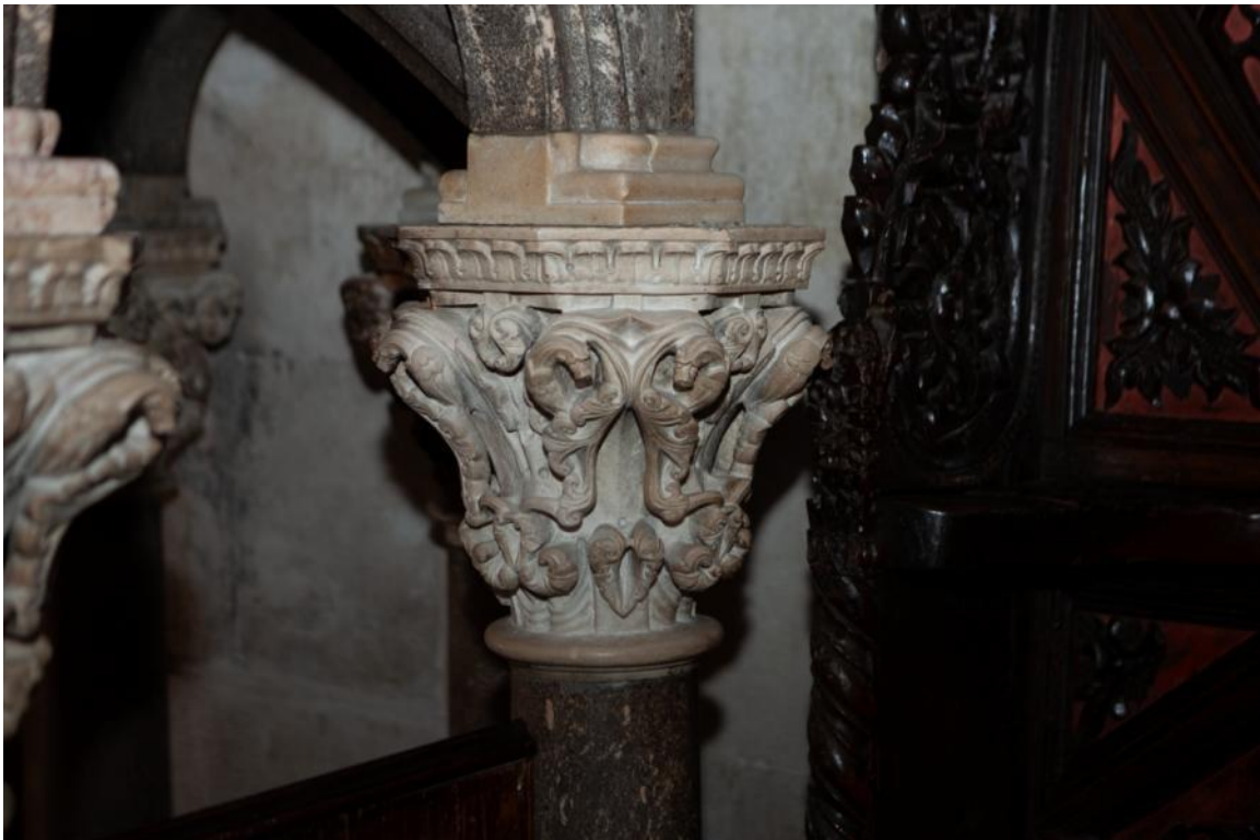
Slika 37. Kapitel propovjedaonice katedrale Sv. Lovre u Trogiru