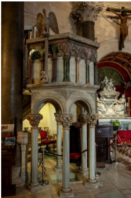
Slika 1. Propovjedaonica katedrale Sv. Dujma u Splitu