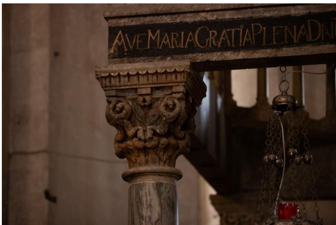
Slika 54. Kapitel ciborija katedrale Sv. Lovre u Trogiru