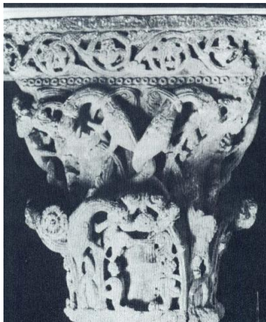
Slika 62. Gualtiero da Foggia, kapitel ciborija katedrale San Valentino u Bitontu, Museo diocesano di Bitonto, oko 1240. godine (izvor: P. BELLI D'ELIA, 1992., 259.)