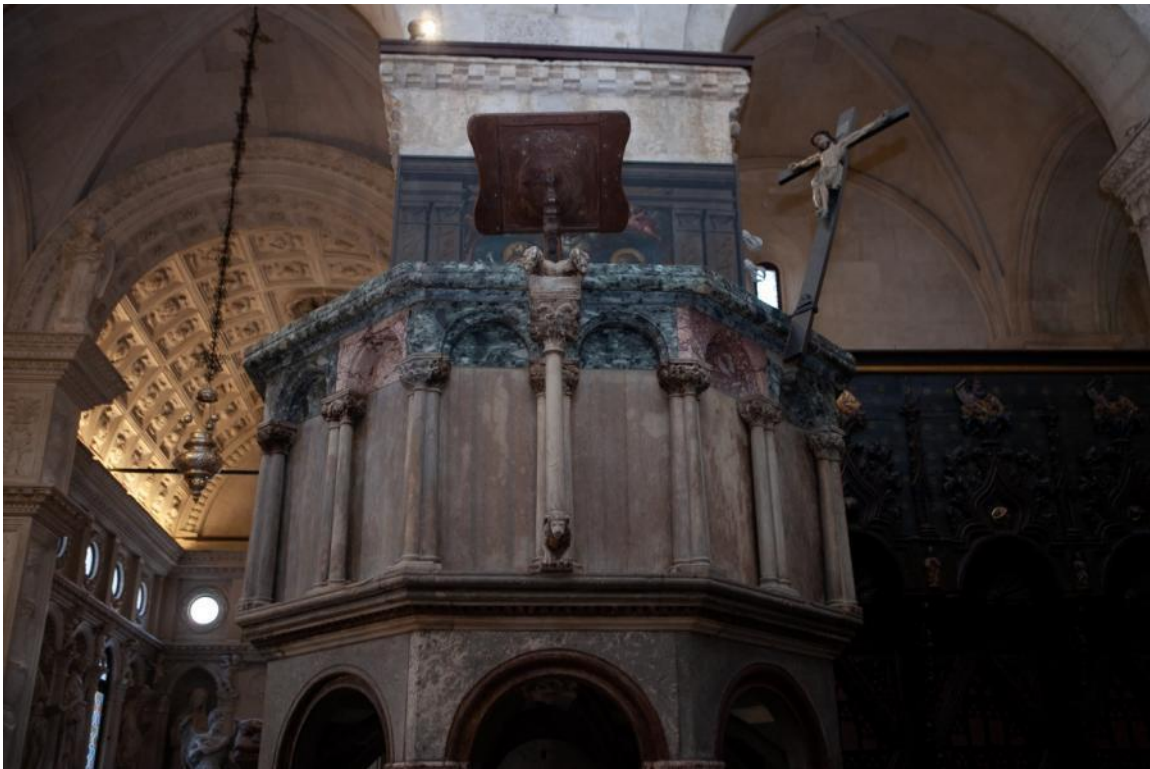
Slika 41. Parapet propovjedaonice katedrale Sv. Lovre u Trogiru