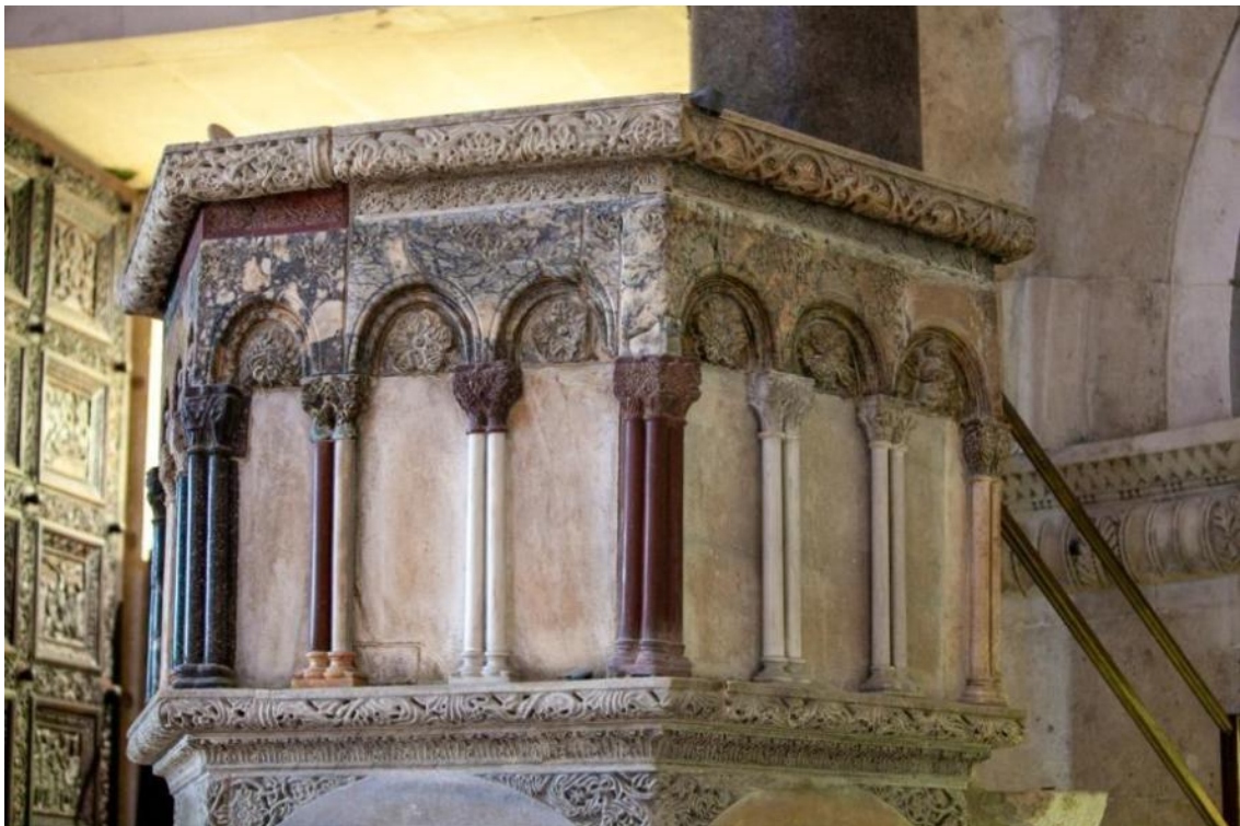
Slika 20. Parapet propovjedaonice katedrale Sv. Dujma u Splitu