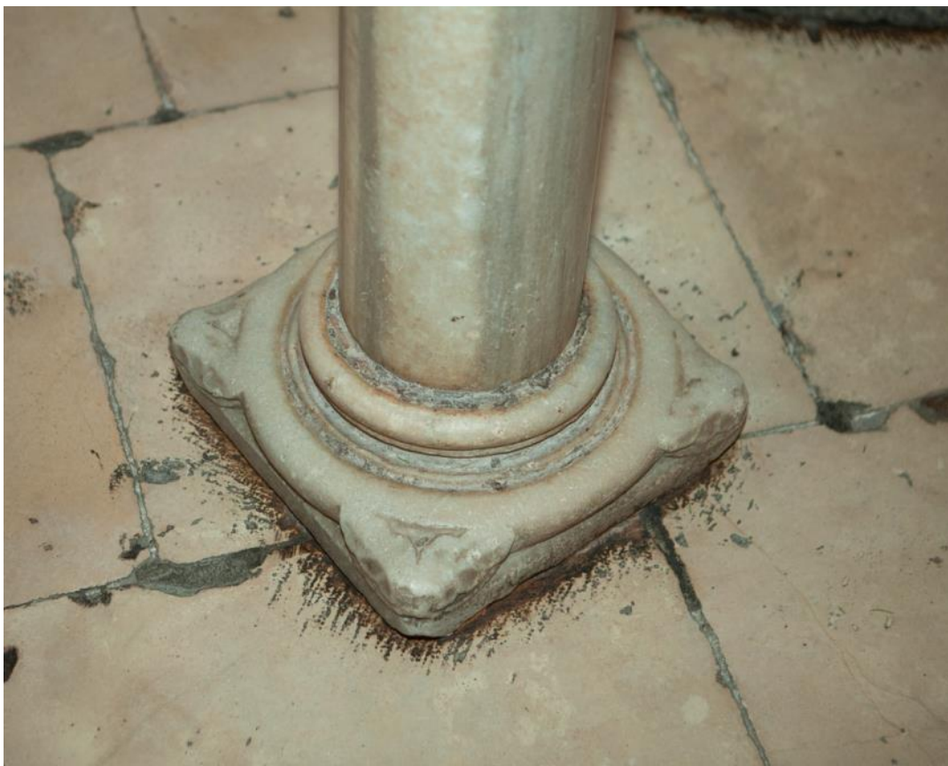
Slika 28. Baza stupa propovjedaonice katedrale Sv. Lovre u Trogiru