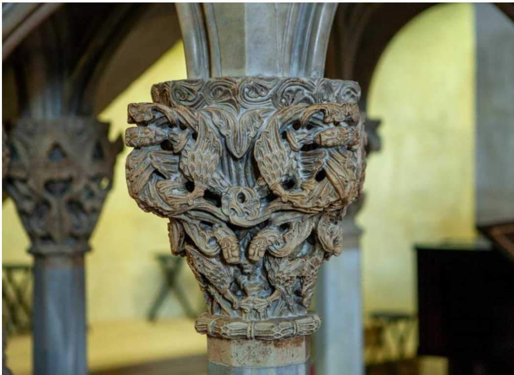
Slika 8. Kapitel propovjedaonice katedrale Sv. Dujma u Splitu