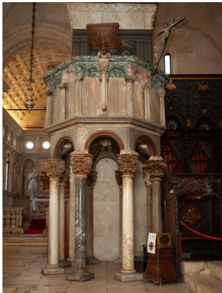
Slika 26. Propovjedaonica katedrale Sv. Lovre u Trogiru