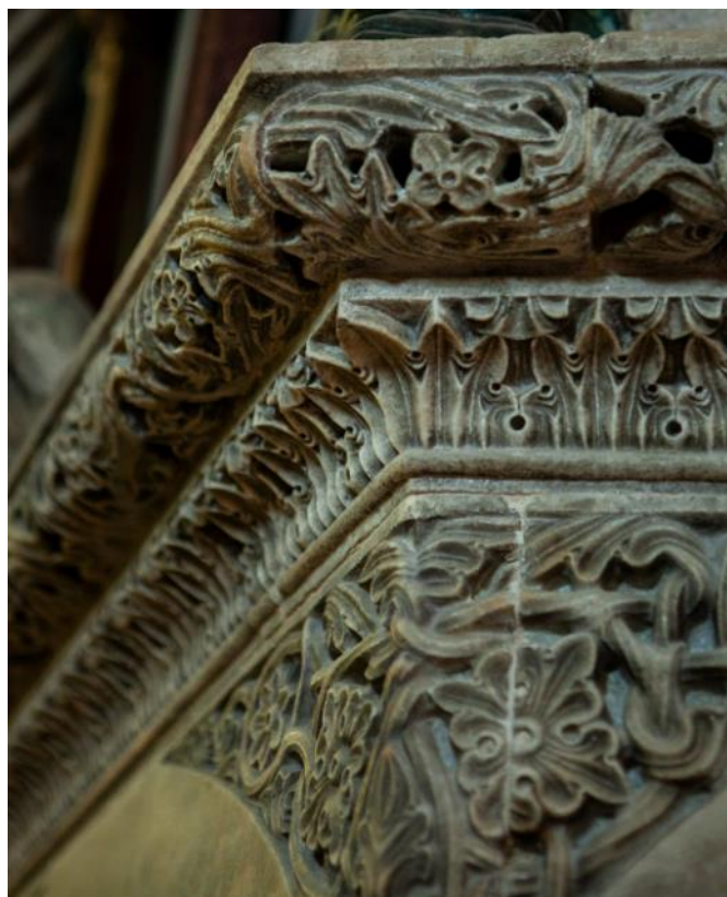
Slika 16. Detalj vijenca propovjedaonice katedrale Sv. Dujma u Split