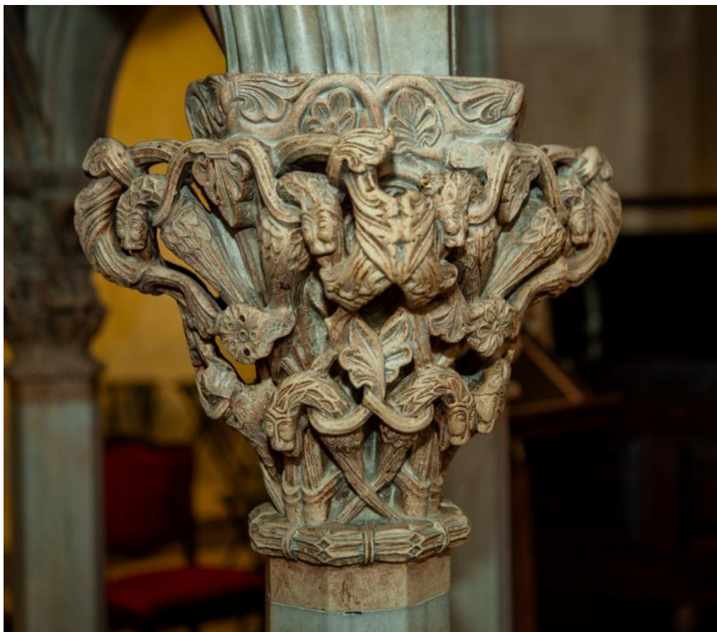
Slika 10. Kapitel propovjedaonice katedrale Sv. Dujma u Splitu