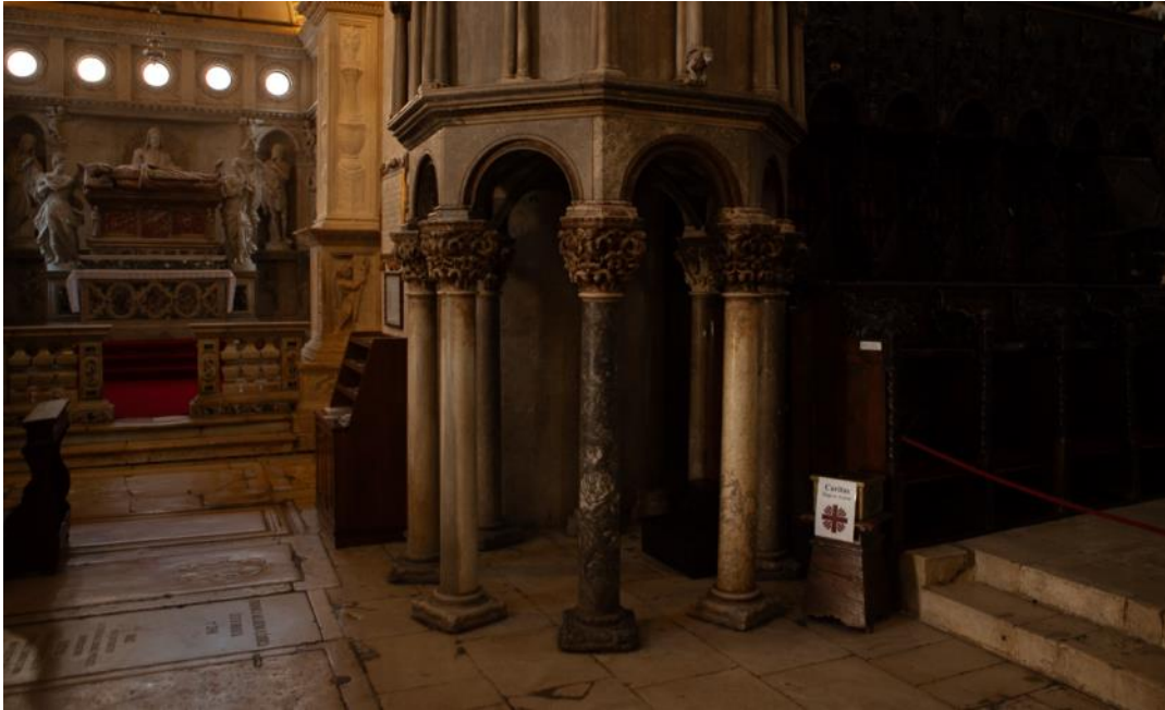
Slika 27. Donja zona propovjedaonice katedrale Sv. Lovre u Trogiru