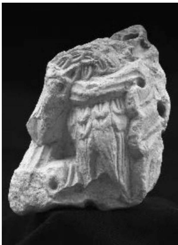
Slika 50. Ulomak s motivom zmajolike ptice iz franjevačke crkve Sv. Marije u Bribiru, Muzej hrvatskih arheoloških spomenika (izvor: K. LASZLO KLEMAR, 2016., 100.)