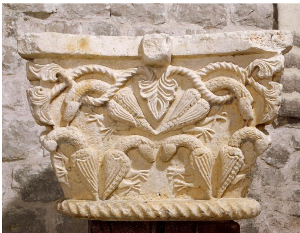
Slika 58. Kapitel iz klaustra franjevačkog samostana Sv. Frane u Zadru (izvor: E. HILJE – N. JAKŠIĆ, 2008, 182.)