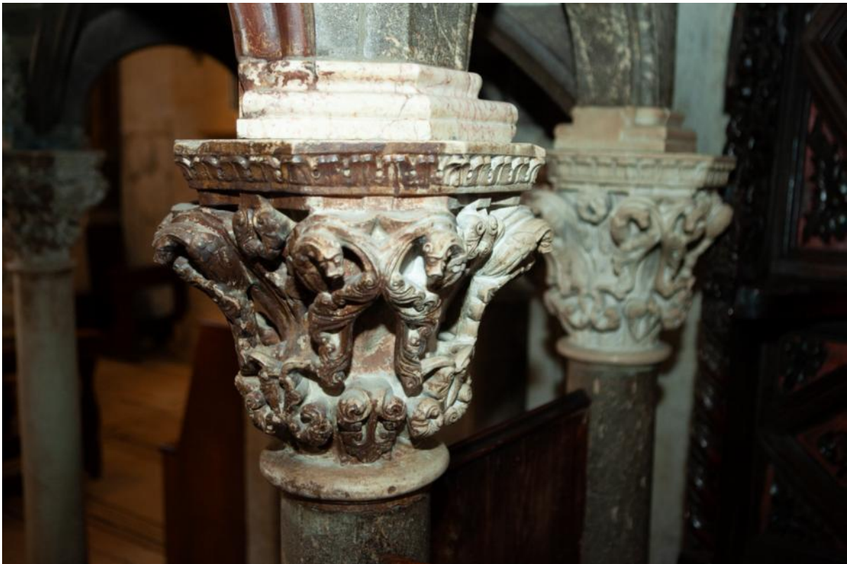
Slika 35. Kapitel propovjedaonice katedrale Sv. Lovre u Trogiru