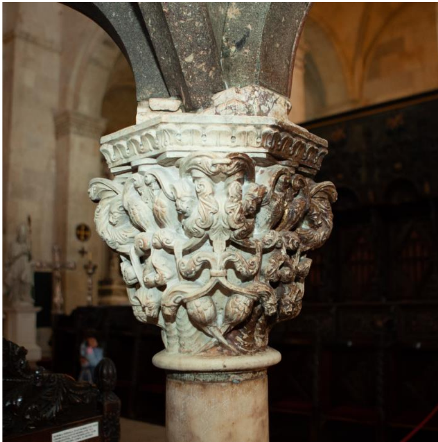
Slika 33. Kapitel propovjedaonice katedrale Sv. Lovre u Trogiru