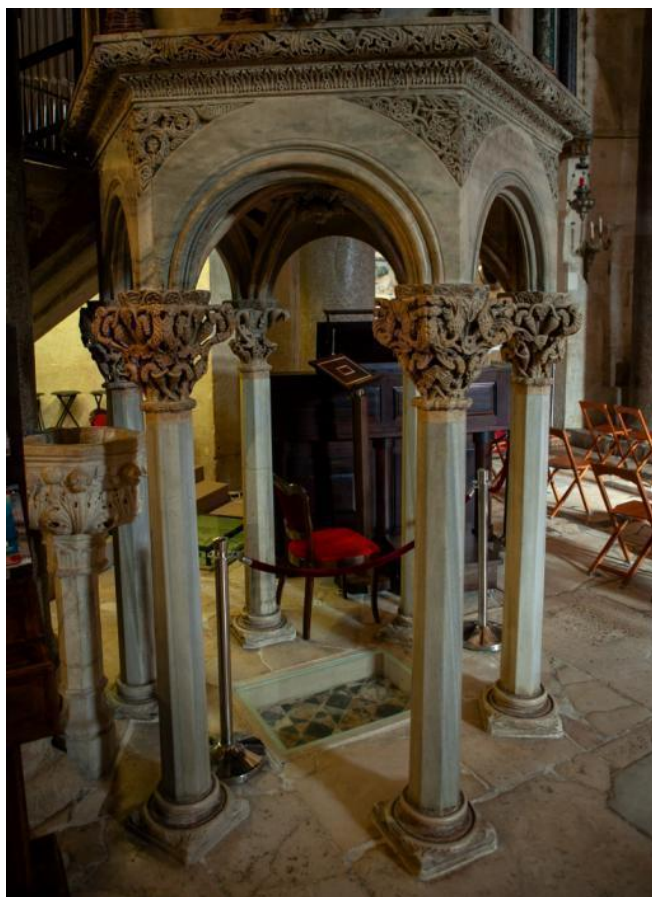
Slika 5. Donja zona propovjedaonice katedrale Sv. Dujma u Splitu