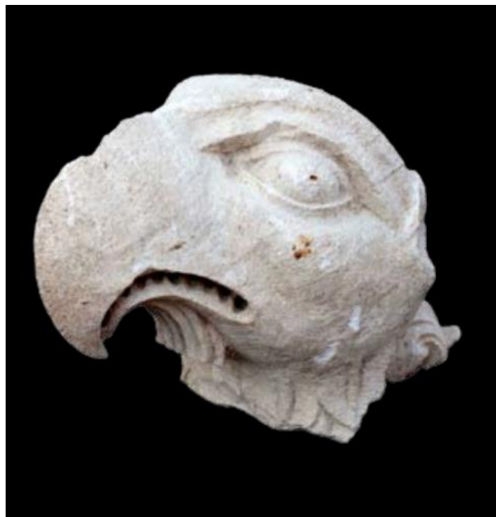
Slika 48. Glava orla nekadašnjeg lectorila propovjedaonice katedrale Gospe Velike u Dubrovniku, depo katedrale