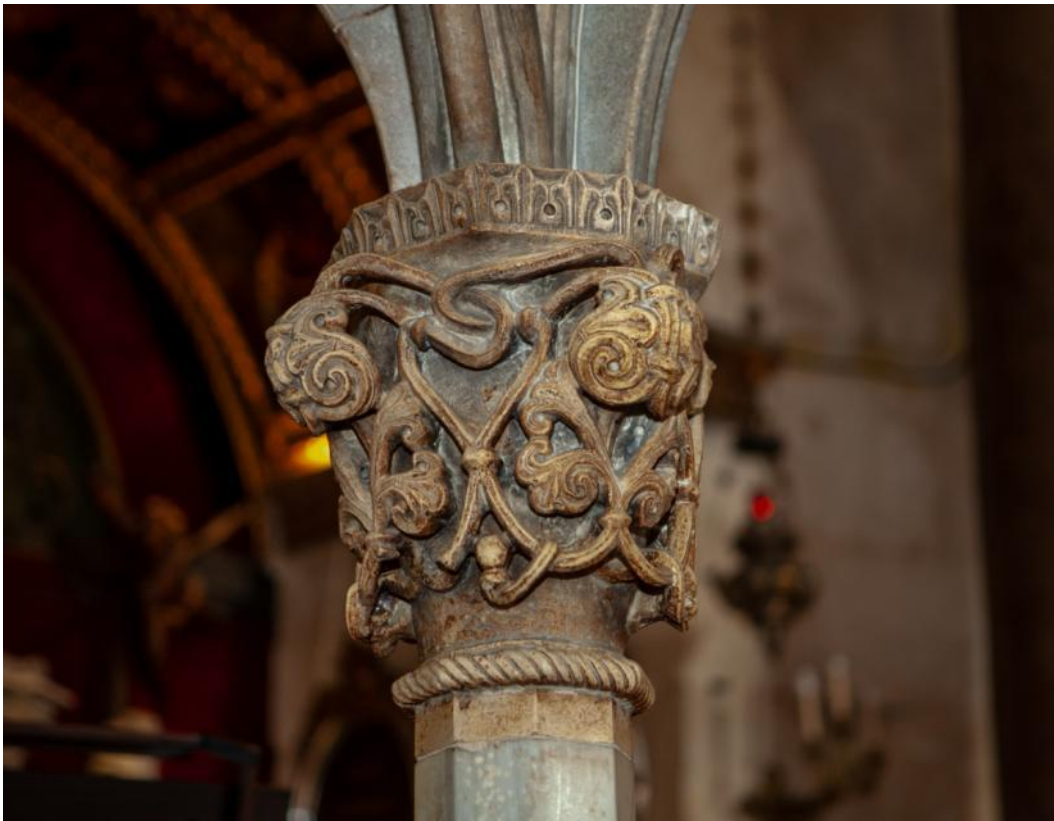
Slika 11. Kapitel propovjedaonice katedrale Sv. Dujma u Splitu