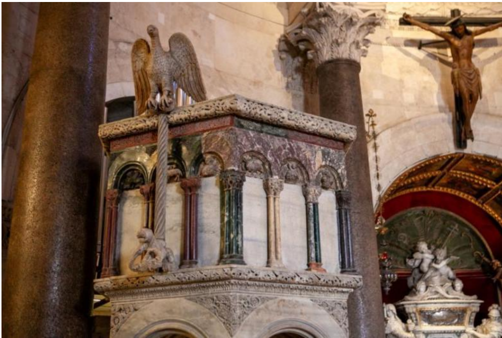
Slika 17. Parapet propovjedaonice katedrale Sv. Dujma u Splitu