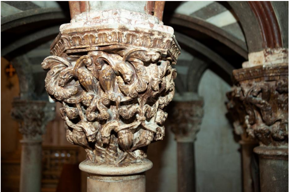
Slika 34. Kapitel propovjedaonice katedrale Sv. Lovre u Trogiru