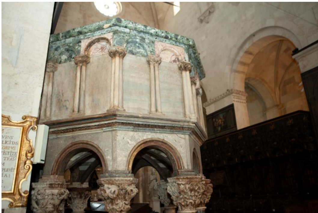
Slika 42. Parapet propovjedaonice katedrale Sv. Lovre u Trogiru