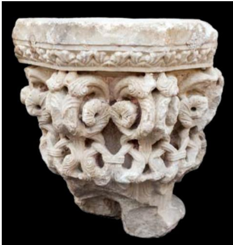
Slika 47. Kapitel propovjedaonice katedrale Gospe Velike u Dubrovniku, depo katedrale