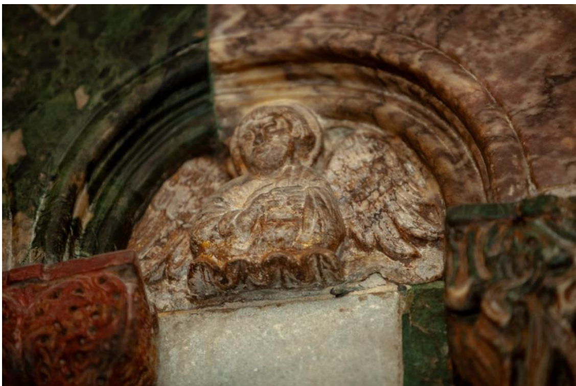
Slika 23. Poprsje evanđelista Mateja u lunetici propovjedaonice katedrale Sv. Dujma u Splitu