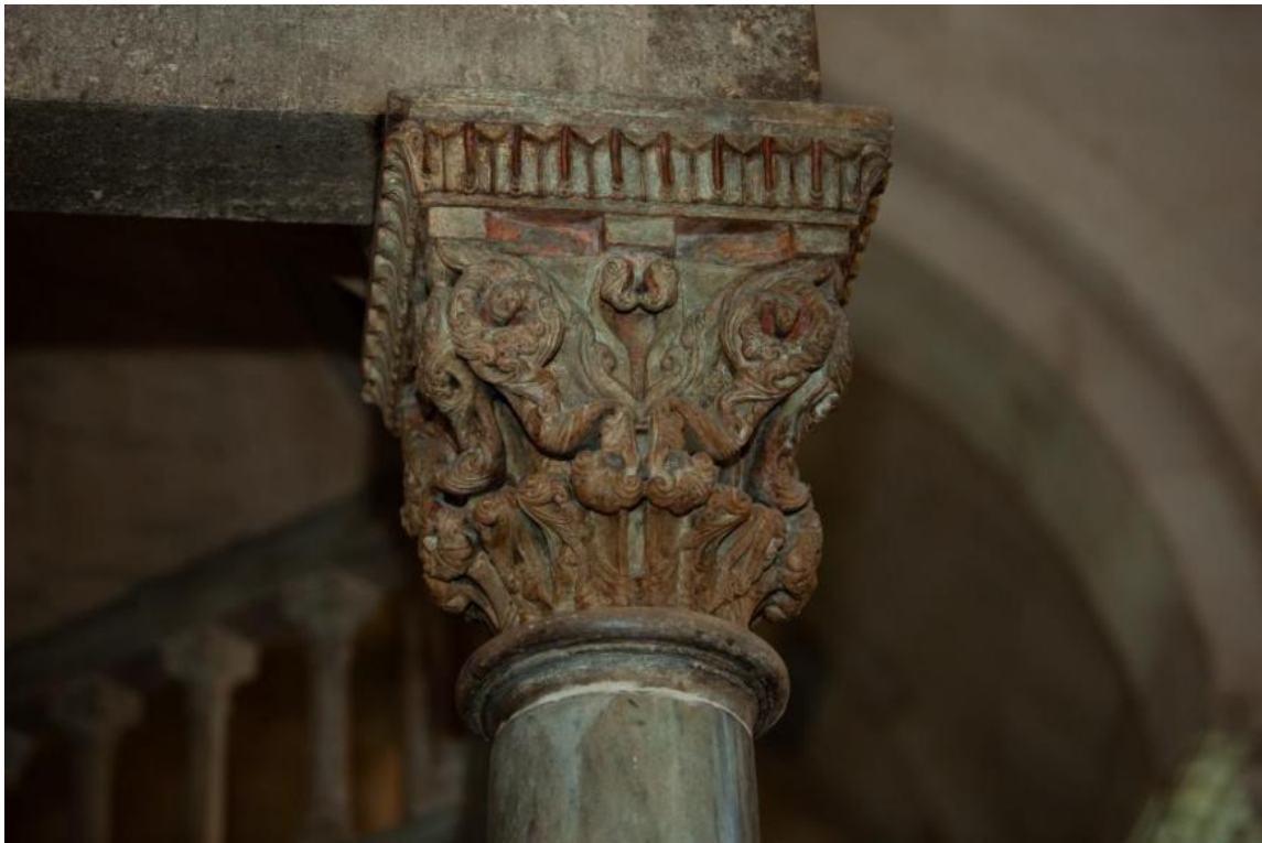
Slika 55. Kapitel ciborija katedrale Sv. Lovre u Trogiru