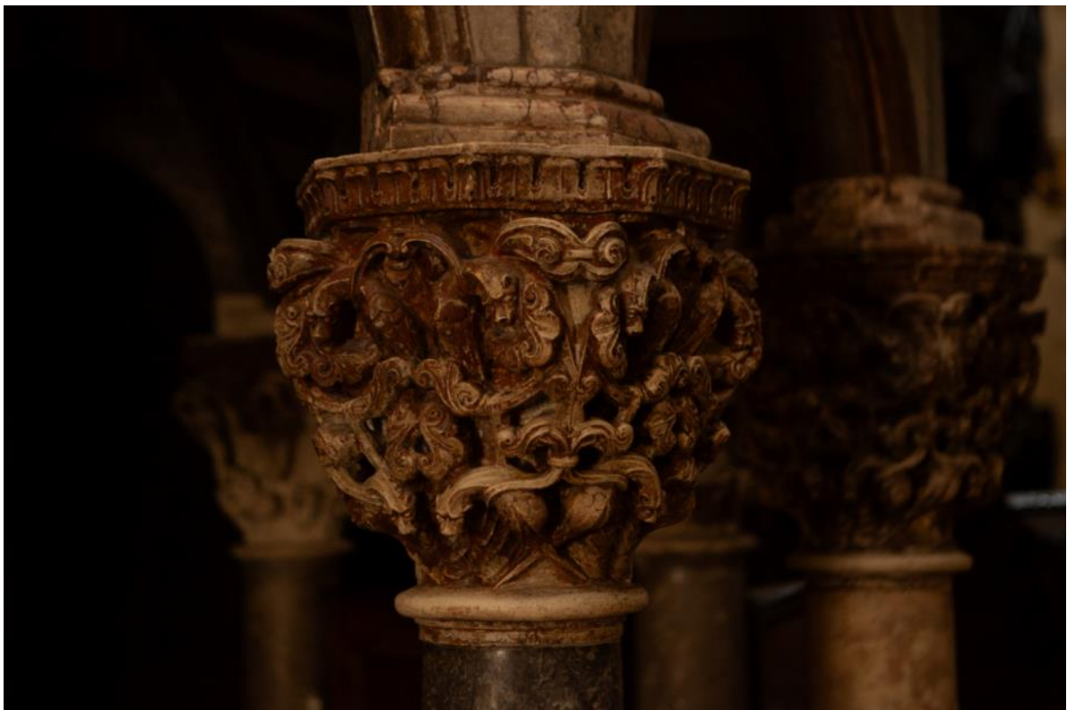
Slika 30. Kapitel propovjedaonice katedrale Sv. Lovre u Trogiru