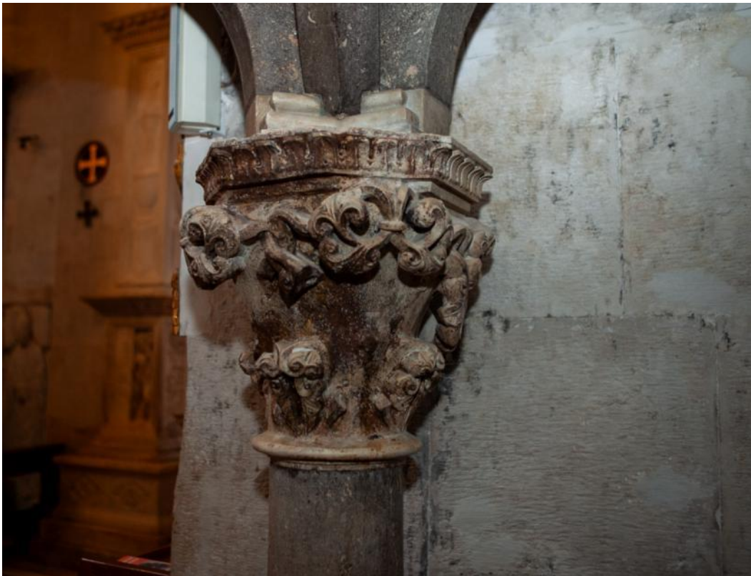
Slika 38. Kapitel propovjedaonice katedrale Sv. Lovre u Trogiru