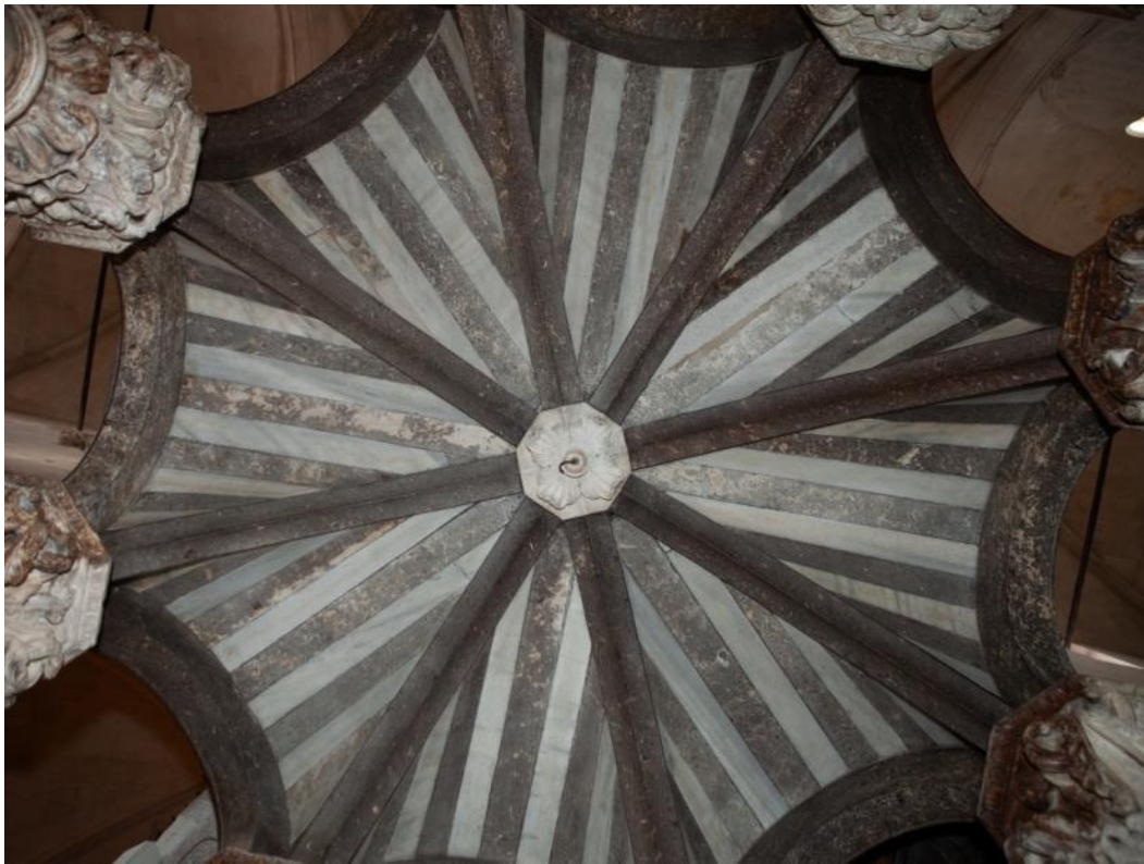
Slika 39. Svod propovjedaonice katedrale Sv. Lovre u Trogiru