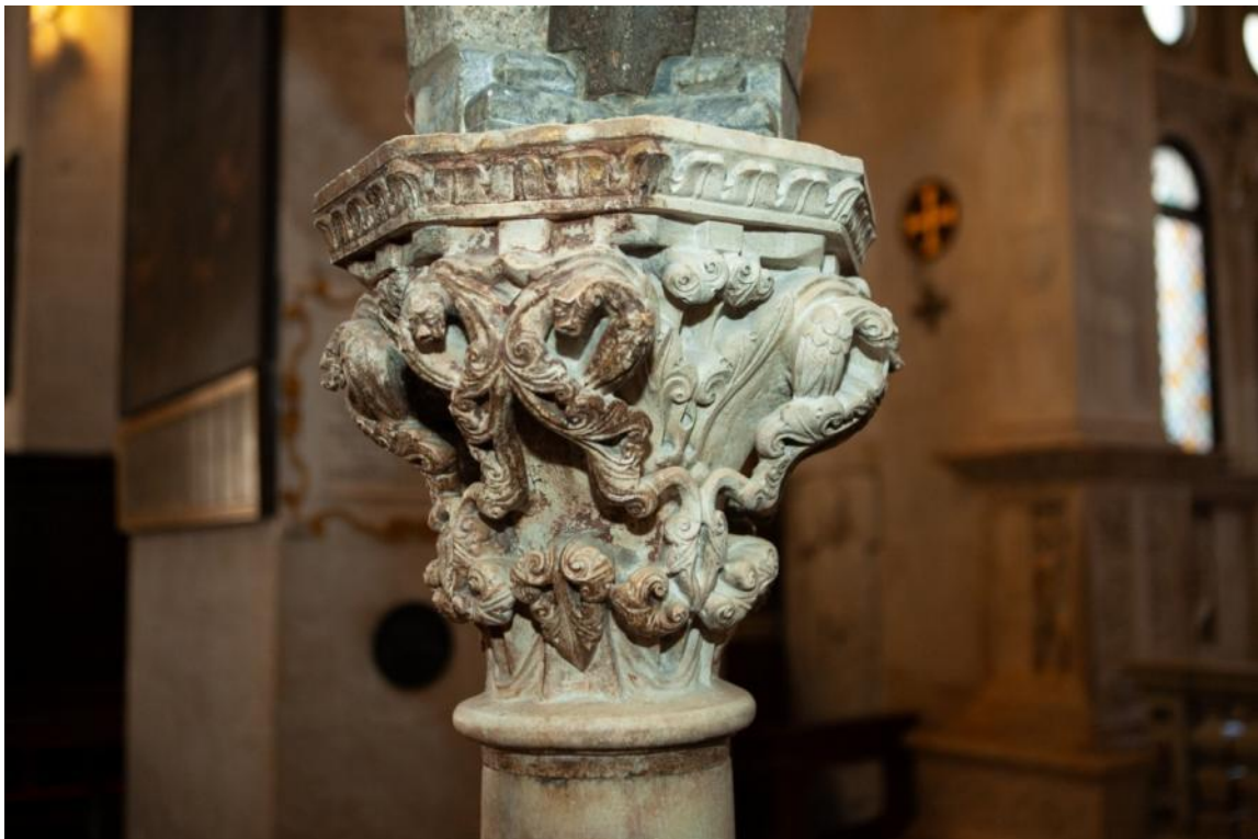
Slika 36. Kapitel propovjedaonice katedrale Sv. Lovre u Trogiru