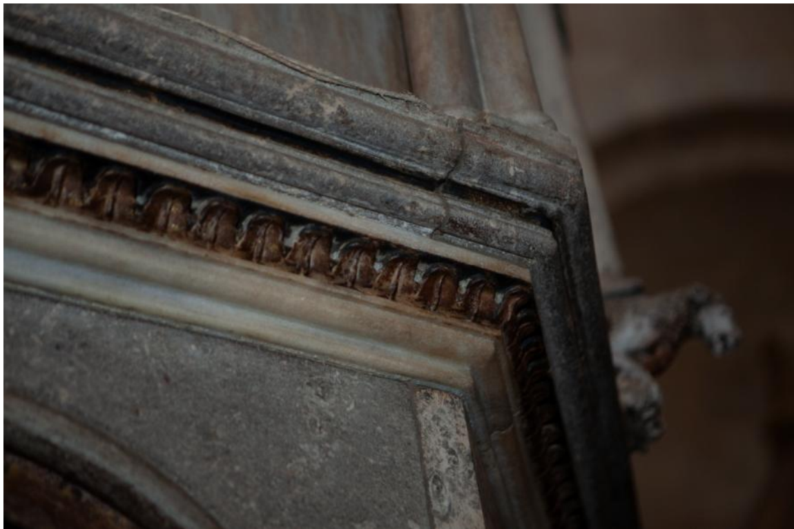
Slika 40. Detalj vijenca propovjedaonice katedrale Sv. Lovre u Trogiru