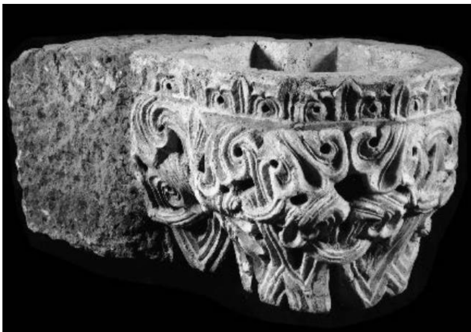
Slika 51. Zidna škropionica iz franjevačke crkve Sv. Marije u Bribiru, Muzej hrvatskih arheoloških spomenika