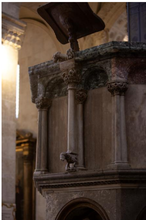
Slika 43. Parapet propovjedaonice katedrale Sv. Lovre u Trogiru