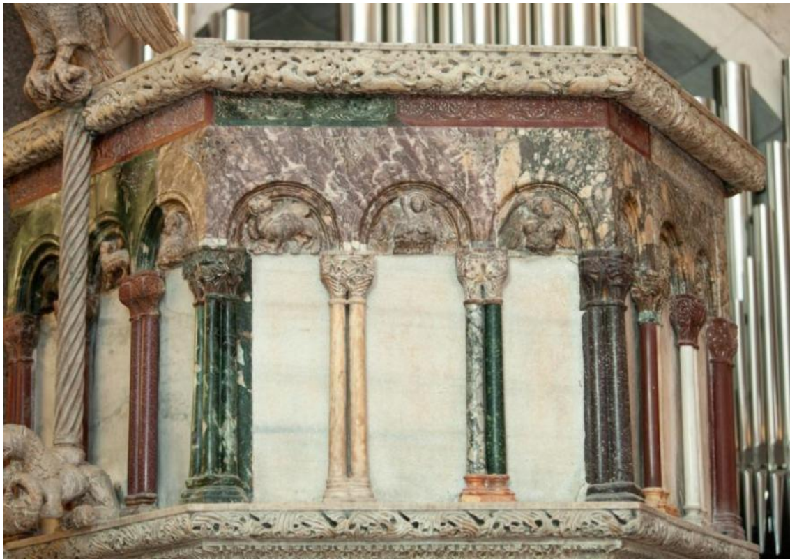
Slika 19. Parapet propovjedaonice katedrale Sv. Dujma u Splitu