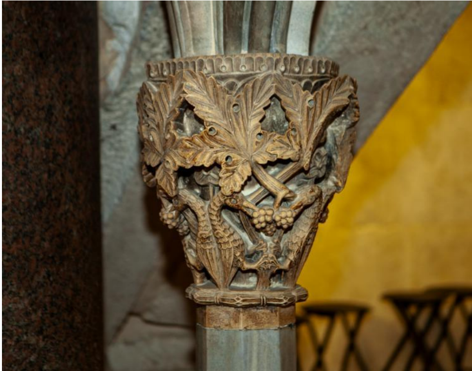
Slika 13. Kapitel propovjedaonice katedrale Sv. Dujma u Splitu