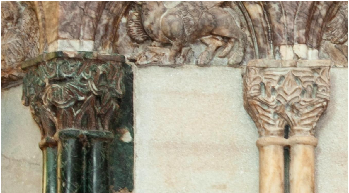
Slika 22. Kapiteli stupića parapeta propovjedaonice katedrale Sv. Dujma u Splitu