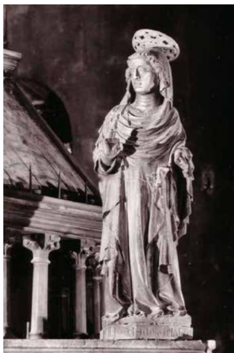
Slika 64. Majstor Mavar, grupa Navještenja na ciboriju katedrale Sv. Lovre u Trogiru, oko 1331.