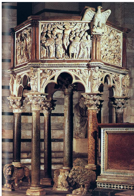
Slika 63. Niccolò Pisano, propovjedaonica krstionice katedrale u Pisi, 1260. godine (izvor: https://www.wga.hu/html_m/p/pisano/nicola/1pisa/0pulpit2.html , pristupljeno 22. 4. 2024.)