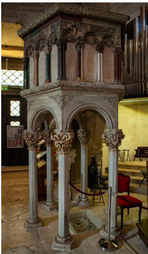
Slika 3. Propovjedaonica katedrale Sv. Dujma u Splitu