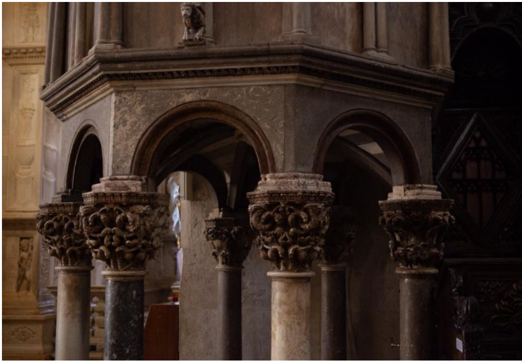
Slika 29. Dio donje zone propovjedaonice katedrale Sv. Lovre u Trogiru