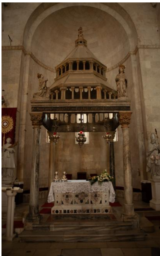
Slika 53. Ciborij katedrale Sv. Lovre u Trogiru