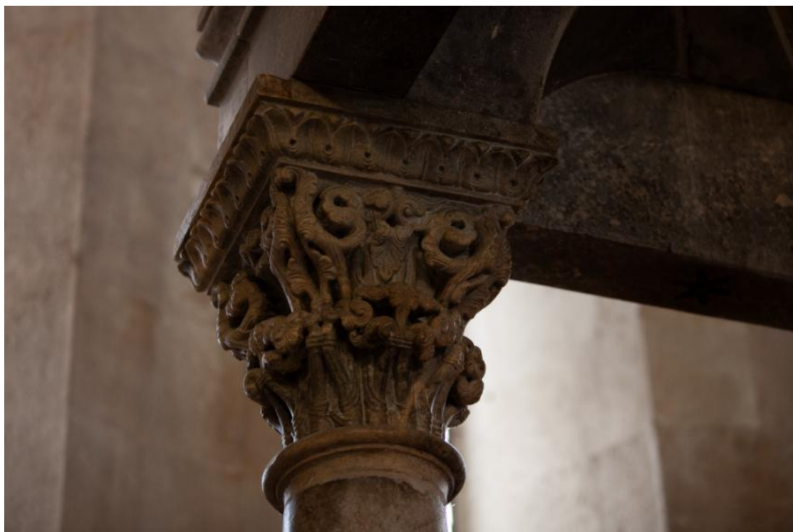
Slika 57. Kapitel ciborija katedrale Sv. Lovre u Trogiru