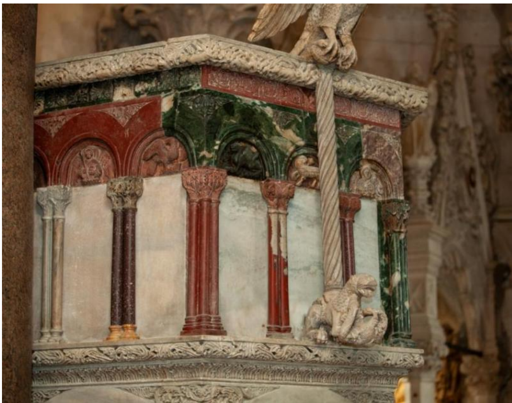
Slika 18. Parapet propovjedaonice katedrale Sv. Dujma u Splitu