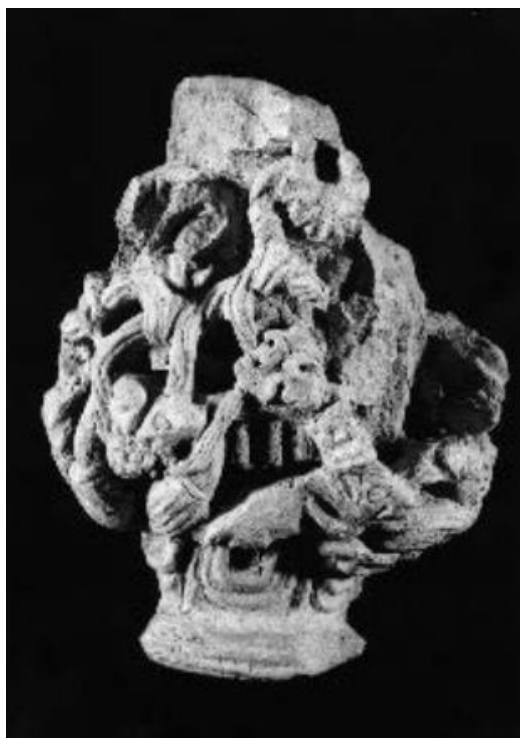
Slika 49. Restauriran kapitel propovjedaonice franjevačke crkve Sv. Marije u Bribiru, Muzej hrvatskih arheoloških spomenika