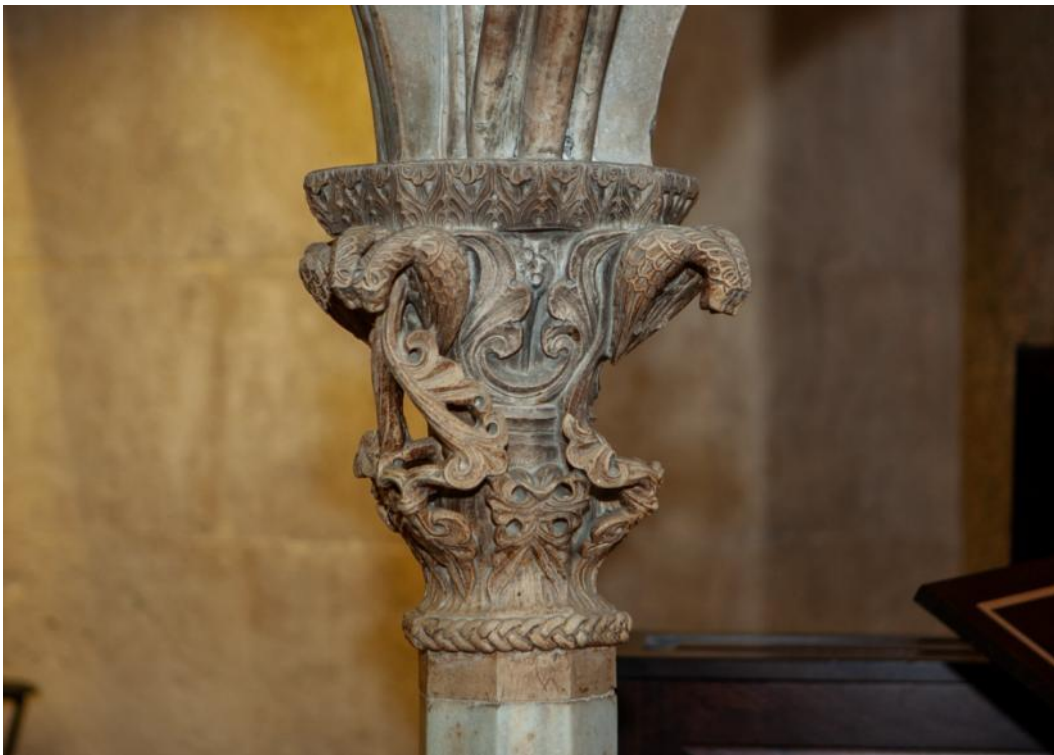
Slika 12. Kapitel propovjedaonice katedrale Sv. Dujma u Splitu