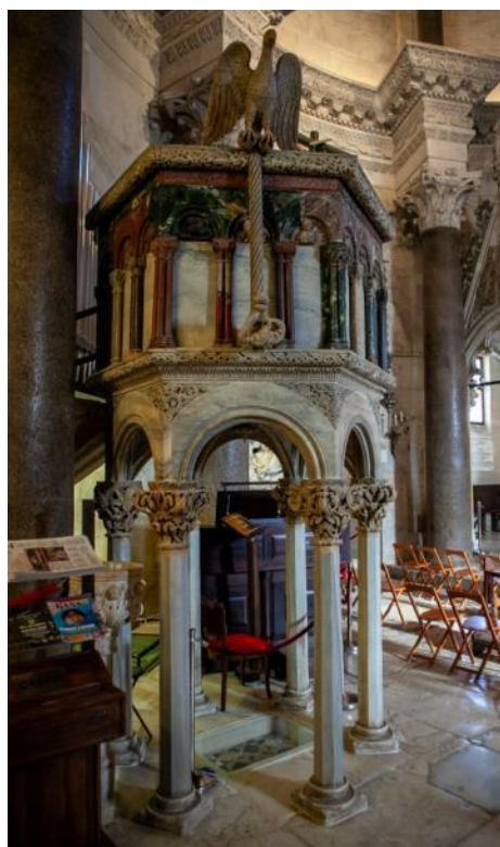
Slika 2. Propovjedaonica katedrale Sv. Dujma u Splitu