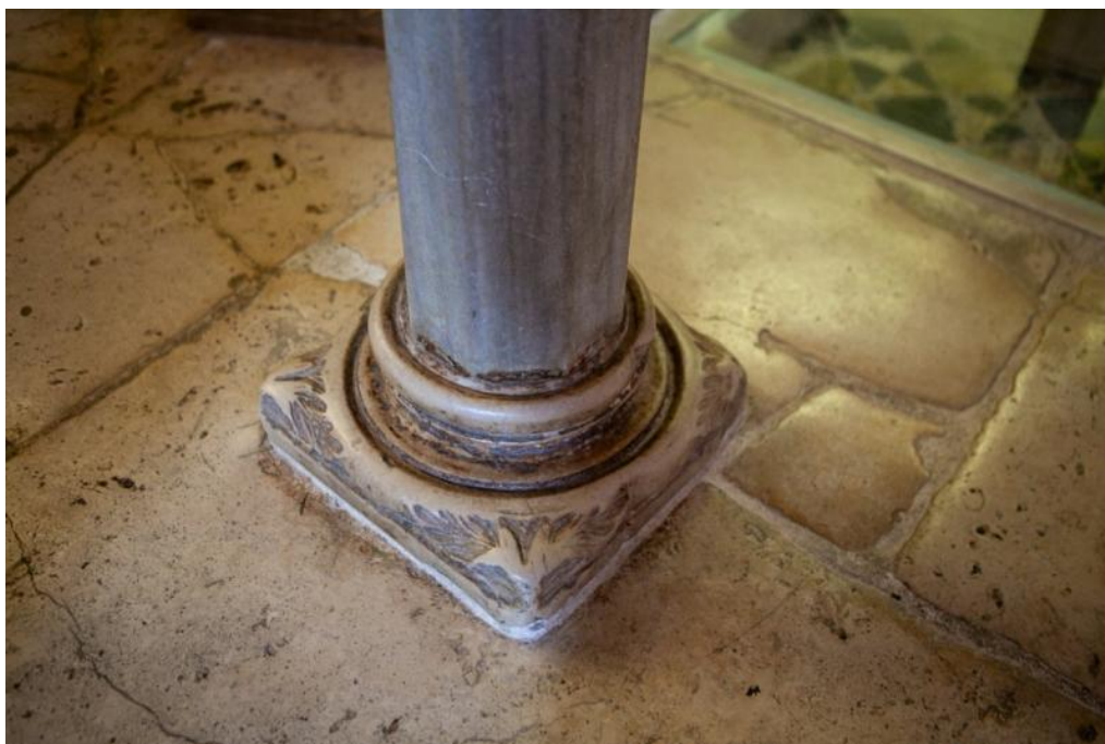
Slika 6. Baza stupa propovjedaonice katedrale Sv. Dujma u Splitu