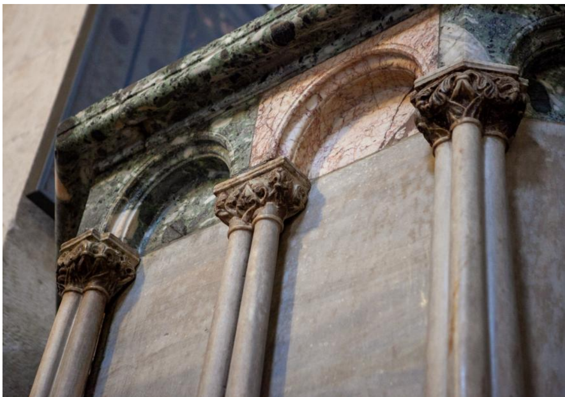
Slika 44. Detalj parapeta propovjedaonice katedrale Sv. Lovre u Trogiru