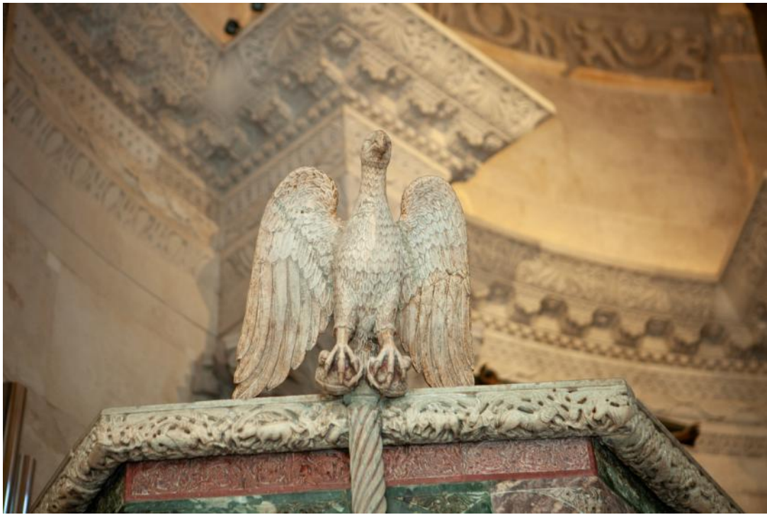
Slika 25. Lectorile u obliku orla nad tordiranim stupićem propovjedaonice katedrale Sv. Dujma u Splitu