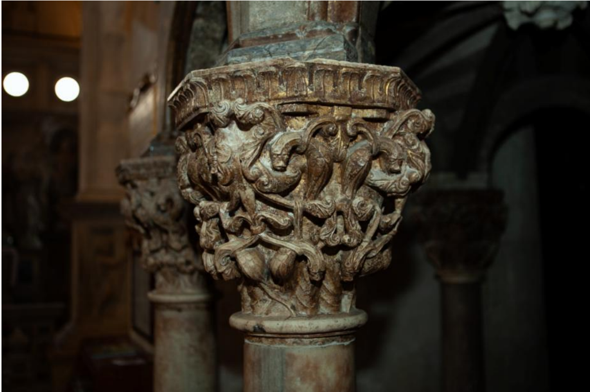
Slika 31. Kapitel propovjedaonice katedrale Sv. Lovre u Trogiru