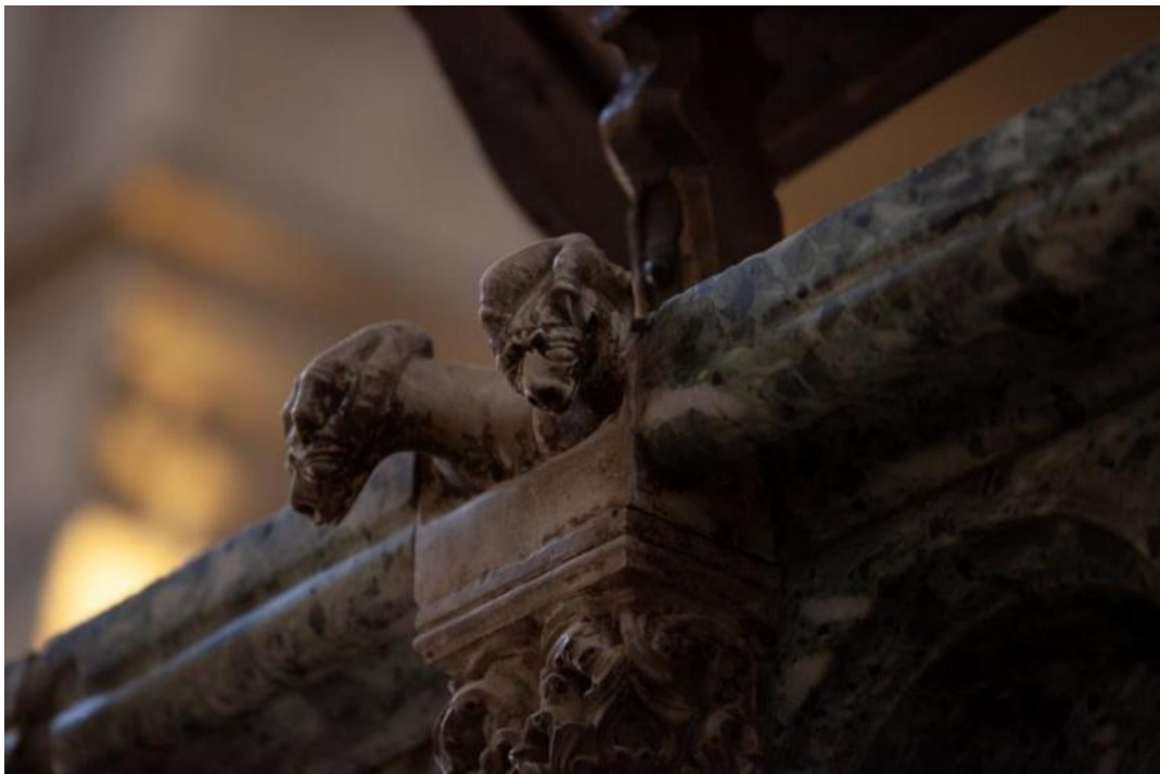
Slika 46. Sačuvane kandže nekadašnjeg lectorila u obliku orla