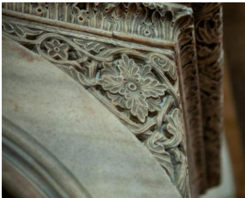
Slika 15. Detalj trokutastog pola među lukovima propovjedaonice katedrale Sv. Dujma u Splitu