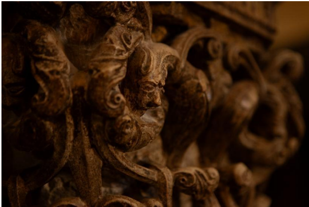
Slika 32. Detalj kapitela propovjedaonice katedrale Sv. Lovre u Trogiru