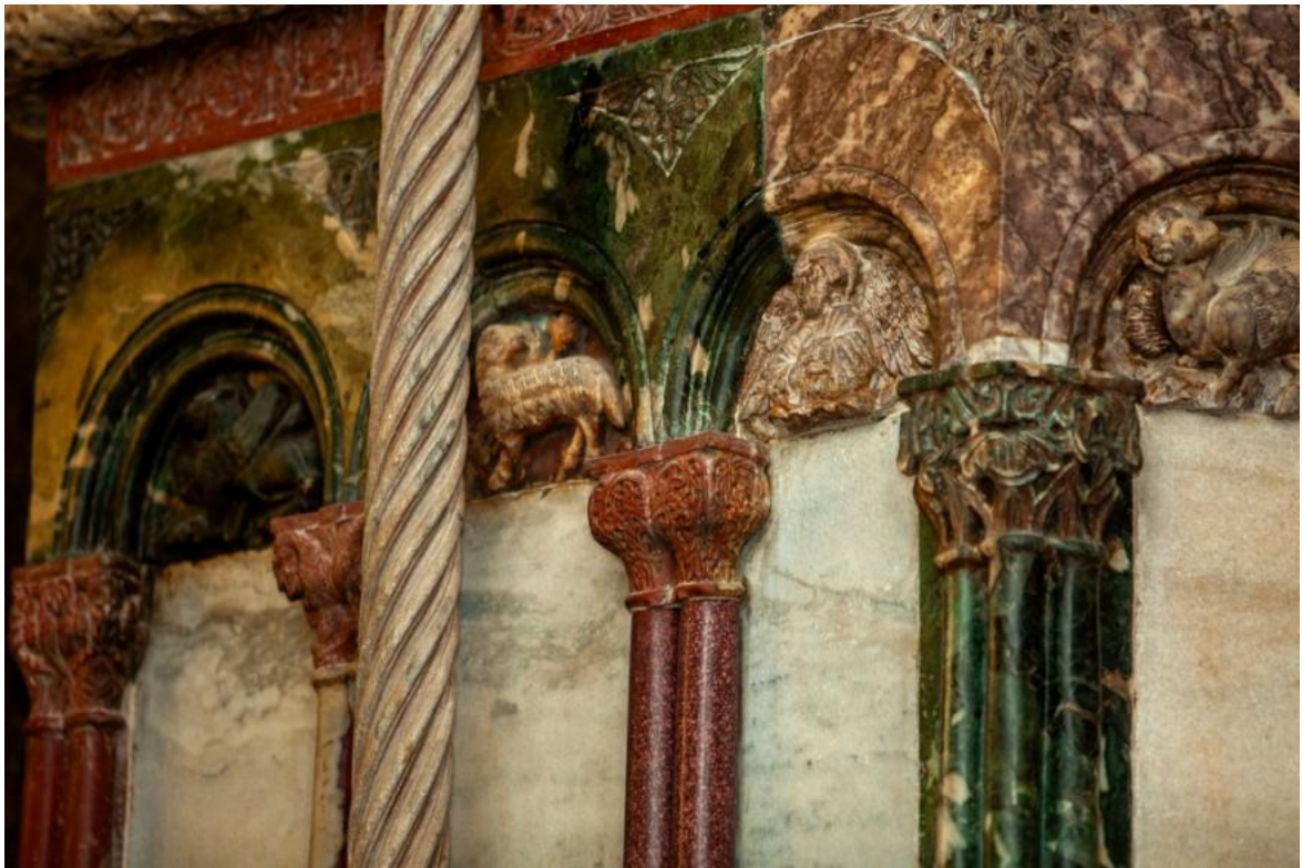
Slika 21. Detalj parapeta propovjedaonice katedrale Sv. Dujma u Splitu