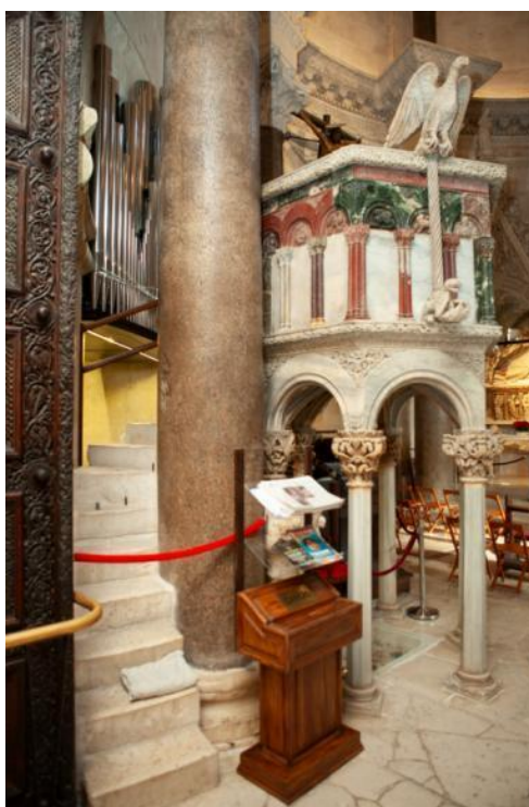
Slika 4. Propovjedaonica katedrale Sv. Dujma u Splitu