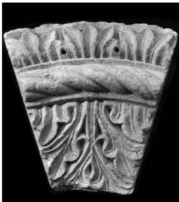
Slika 52. Ulomak zaglavnog dijela luka prozorskog otvora (?), Muzej hrvatskih arheoloških spomenika