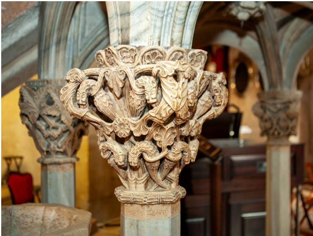
Slika 7. Kapitel propovjedaonice katedrale Sv. Dujma u Splitu