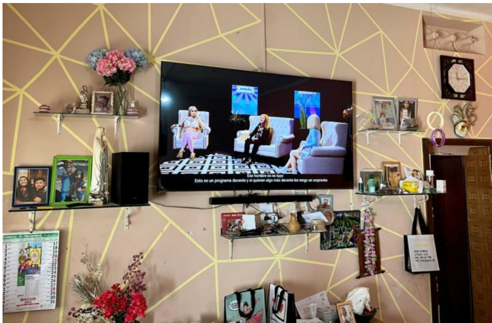
Slikovni prilog 13. Fotografija dijela interijera sugovornice S.