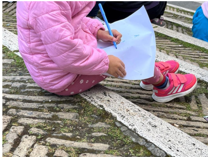
Slikovni prilog 21. Fotografija djevojčice koja crta kuću; fotografirano za vrijeme demonstracije u svrhu legalizacije Metropoliza .

„Kada sam imala deset godina, pokušali su nas iseliti. Morali smo se zabarikadirati iznad tornja, svi stanovnici su išli gore. Moja majka morala je uzeti sve dokumente, staviti ih u ruksak i pobjeći gore. Ovo je jako loše sjećanje jer su me htjeli izbaciti iz kuće. Uvijek sam ispod kreveta imala spreman ruksak”. 14