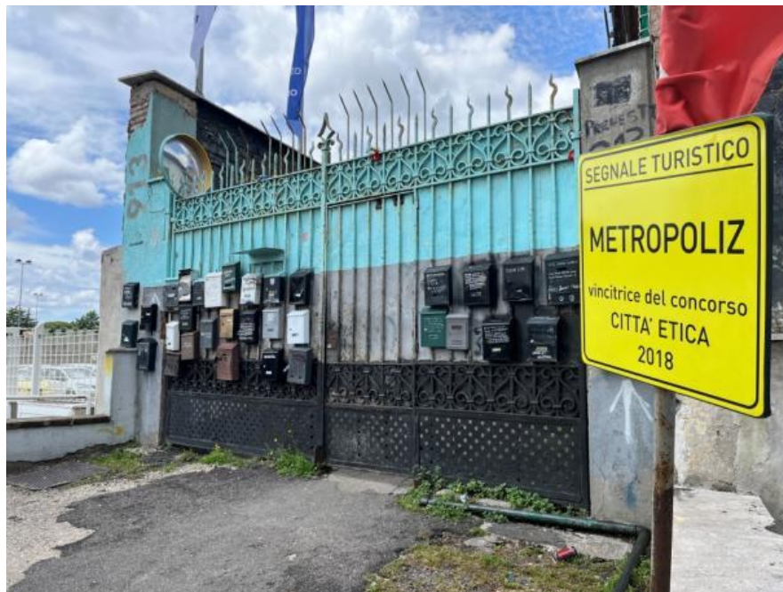
Slikovni prilog 1. Fotografija ulaznih vrata Metropoliza .

Nakon prespavane noći u bolonjskom hotelu, nastavili smo vožnju prema Rimu. Kroz prozor automobila pokušavala sam uhvatiti djelić tornja tvornice koji na internetskim fotografijama dominira vizurom rimske periferije. Via Prenestina, izrazito duga ulica omeđena borovima stiliziranih krošnji u obličju kišobrana, povezuje istočnu periferiju s centrom Rima. Dio navedene ulice periurbanog područja karakterističnog je industrijskog senzibiliteta – asfaltirana cesta bez definiranog nogostupa s vrevom automobila, rasklimanih autobusa, opasana trgovačkim centrima, automat klubovima, logističkim objektima i zasićena ispušnim plinovima. To jutro, sivilo gustih tmurnih oblaka pridonijelo je atmosferičnosti degradirane okoline. Zaustavili smo se na broju 913 pored vrlo visokog derutnog зида koje pamtі tek naznake polikromije. Doimalo se kao da je njegovoj istrošenosti šarenila presudila sinoćnja kiša. Bilo je evidentno kako zid s fragmentarno očuvanim hiperrealističnim muralom svojim oplošjem čuva unutarњи arhitektonski kompleks okrunjen monumentalnim ciglenim tornjem koji je potvrdio dolazak na naše konačno odredište.