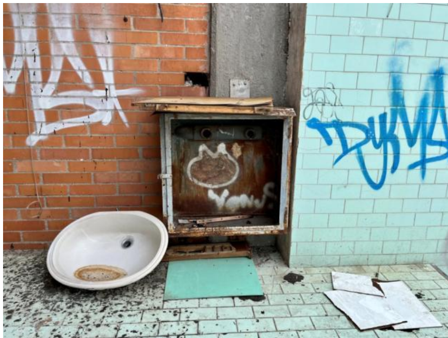
Slikovni prilog 11. Fotografija dijela zajedničke lođe.