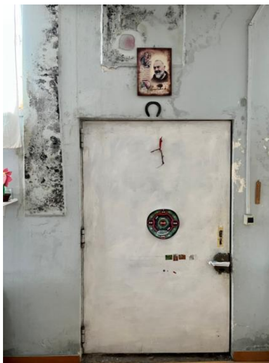
Slikovni prilog 5. Fotografija unutarnje strane vrata stana u kojem smo boravili.

stambenih rješenja. Zbog ekonomske getoizacije i izolacije, imigrantske obitelji bile su primorane improvizirati u vidu samoobnavljanja i samoizgradnje napuštenih posjeda kroz njihovu ponovnu uporabu u stambene svrhe (Goni Mazzitelli 2014: [s.p.]). Naime, tijekom 2003. godine, prostor tvornice Fiorucci od devetnaest tisuća četvornih metara, prodan je za gotovo sedam milijuna eura Pietru Saliniju, izvršnom direktoru tvrtke WeBuild (Grazioli 2022: 121-122). Šest godina kasnije, za vrijeme čekanja odobrenja Salinijevog novog projekta prenamijene postojećeg kompleksa u komercijalne i stambene svrhe, stotine ljudi okupiralo je tvornički krug protestirajući protiv gradnje koja će pod krinkom obnove uzrokovati iseljavanje stanovnika. Tom prilikom oko šezdeset migrantskih obitelji pronašlo je svoj dom u Città Meticcia . 6 Najbrojnija je romska zajednica rumunjskog i sudanskog porijekla, a potom ih slijede Peruanci, Marokanci, Eritrijci, Ukrajinci itd. Dugotrajan proces samooporavka tvornice započeo je zbog potrebe stvaranja domova u prostoru Metropoliza koji je godinama bio zapušten.