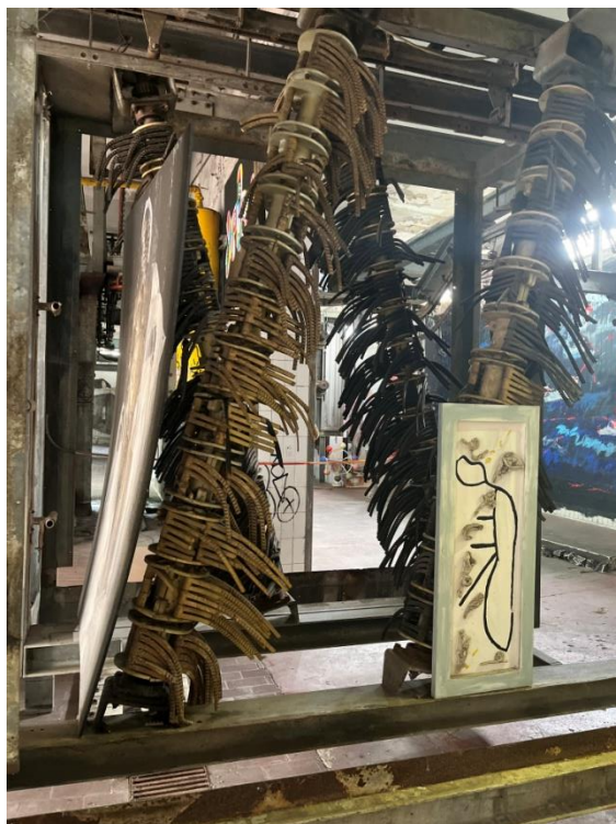
Slikovni prilog 18. Fotografija umjetničkog djela izloženog u MAAM -u.