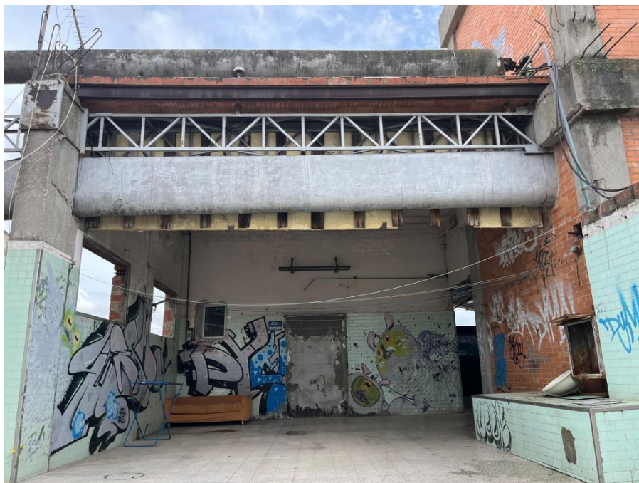
Slikovni prilog 9. Fotografija dijela zajedničke lođe.