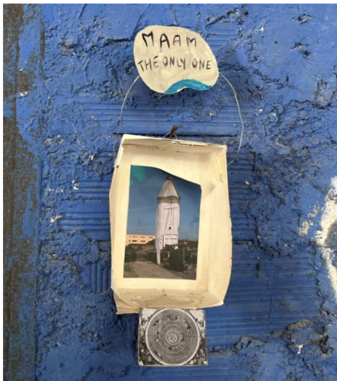
Slikovni prilog 15. Fotografija umjetničke instalacije koja prikazuje „raketu”.

Sam naziv Muzeja – Museo dell'Altro e dell'Altrove (hrv. Muzej Drugog i Drugdje), u kojem „altrove” (hrv. drugdje) predstavlja Mjesec, nadahnut je umjetničkim projektom izgradnje rakete za simulaciju putovanja na tolerantnije mjesto. Materijalom sakupljenim u krugu nekadašnjeg tvorničkog kompleksa, stanovnici skvota načinili su „raketu” i postavili je na odgovarajuće mjesto. Pri kraju de Finisova i Bonijeva filma, jedan od stanovnika Metropoliza izjavio je kako: „raketa je direktna poruka gradskoj upravi – ne, nismo pronašli svoje mjesto na Zemlji, stoga idemo na Mjesec”. 12 Stručnjaci koju su bili angažirani za organizaciju i provedbu ovog projekta, uključujući filozofe, astrofizičare, radikalne arhitekate i umjetnike, definirali su odlazak na Mjesec kao jedinstvenu priliku za potpunim samoodređenjem. U tom kontekstu, razlike među etničkim skupinama ne predstavljaju izvor predrasuda i sukoba, već resurs za preoblikovanje samopoimanja čovječanstva unutar šireg okvira. Znanstveno-fantastični moment ove vizije priziva utopijske misli povijesnih ličnosti koje su zamišljale druga vremena i svjetove, oslobađajući se konvencionalnih mišljenja. Stoga je ovaj projekt pokušaj nadilaženja trenutnih