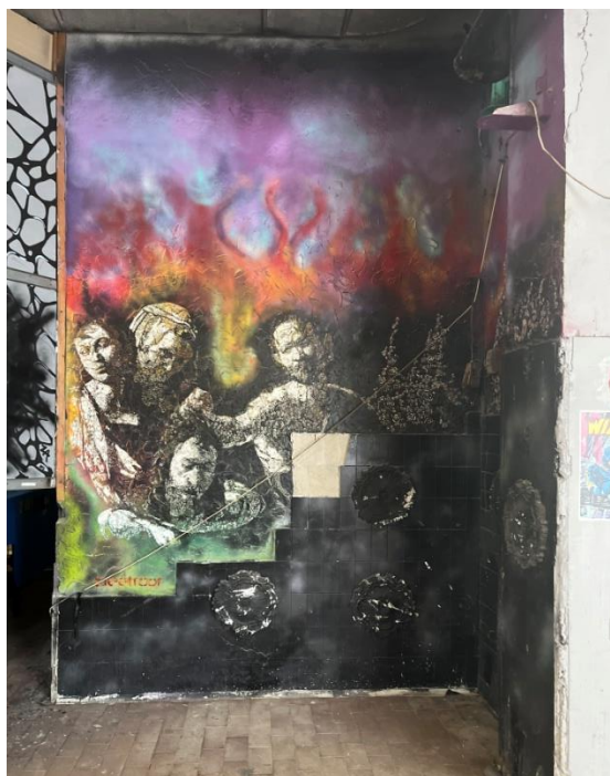
Slikovni prilog 19. Fotografija oslikanog zida u MAAM -u.