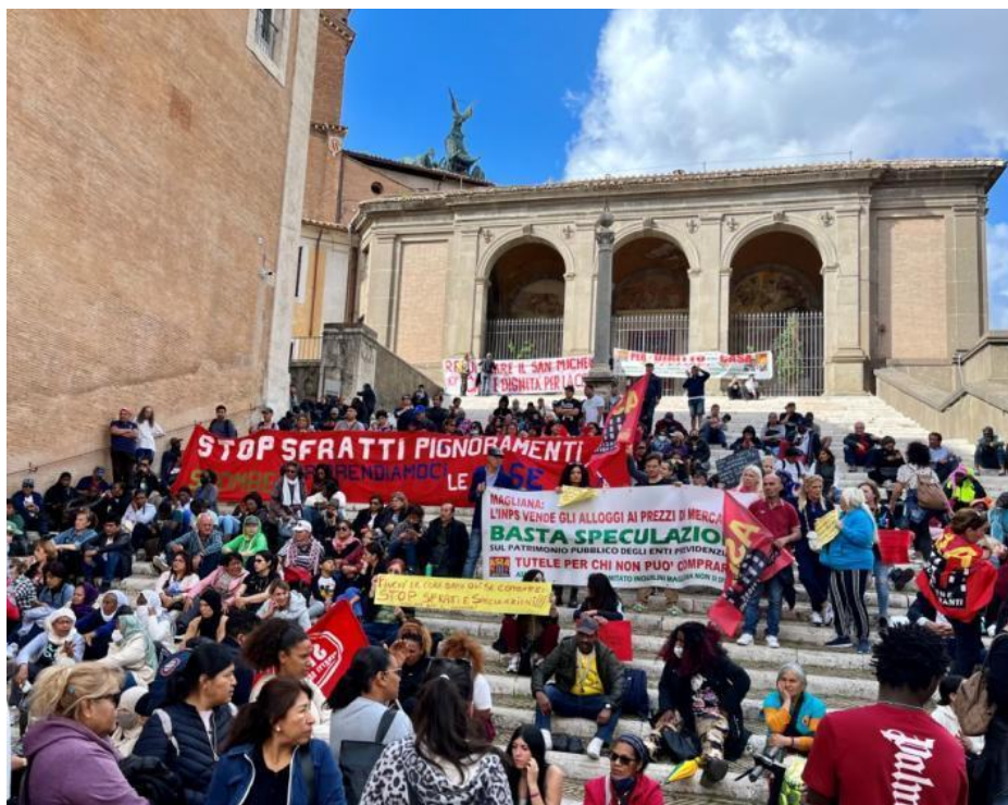
Slikovni prilog 8. Fotografija s demonstracije.

Opoziciju sustavnom dijelu istraživanja, odnosno reproduciranju znanja iščitanog iz literature, činio je moj pristup terenu pri kojem sam se suočila s mnogim konceptualnim, etičkim i metodološkim izazovima. Prevalili smo iscrpljujući put do Rima. Prebivali smo u skvotiranom stanu poprilične veličine u „iznimno dobrom stanju”. Smještaj koji nam je tako predstavljen izuzeo je detalje poput plijesni na zidu i ulaznih vrata koja se „zaključavaju” mehanizmom stezanja stare krpe. Naime, uoči dolaska rečeno nam je da u stanu inače živi otac moje sugovornice S. iz Perua koji je tada bio na putu pa se u iščekivanju smještaja nakon iscrpljujućeg puta gostoljubivost naših domaćina terena nije propitivala, niti se mogla shvatiti nesigurnost životnih uvjeta u skvotu koji je mnogima, kao i nama tih dana, predstavljao dom. No unatoč tome, svi smo zasigurno bili zapanjeni veličinom stana. Boravili smo u navedenom prostoru koji smo u zajedničkim prostorijama dijelili s našim sugovornicima, jeli smo specijalitete peruanske kuhinje, (ne)formalno razgovarali o prošlosti, sadašnjosti i budućnosti Metropoliza , družili se. Etnografski uvidi u ono što se predamnom očitovalo kao teren u nastajanju, bili su znatno drugačiji od udžbeničkog poimanja etnografskih metoda koje ovdje kao da nisu mogle biti prakticirane u smislu kako sam ih zamislila. Naše etnografsko istraživanje manifestiralo se na različite načine. Josip, Laura i Ante intervenirali su u prostor muzejskog kompleksa umjetničkim