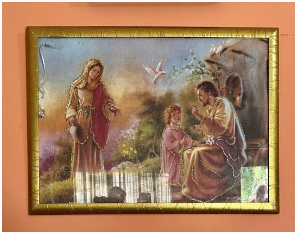
Slikovni prilog 14. Fotografija slike Svete obitelji iz interijera kuće sugovornice S. Autorica fotografije je Nikolina Durut.