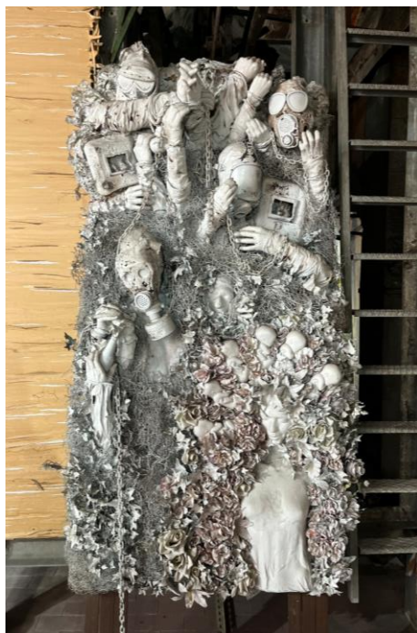
Slikovni prilog 17. Fotografija umjetničkog djela izloženog u MAAM-u.