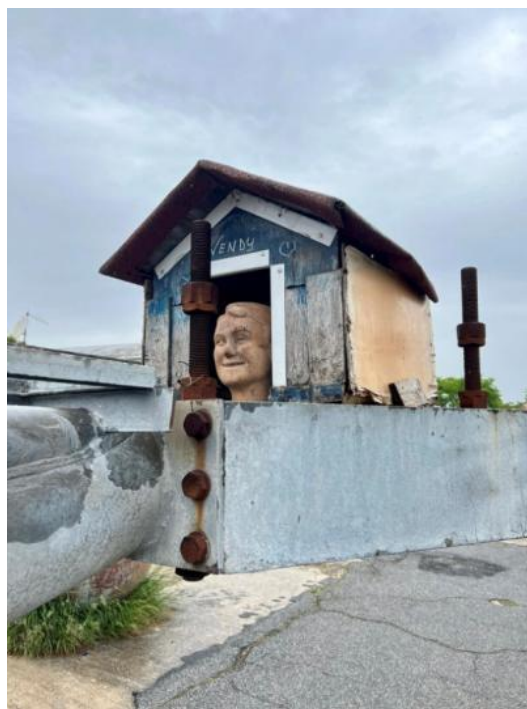
Slikovni prilog 6. Fotografija zajedničke umjetničke instalacije autora Josipa Zankija, Laure Stojkoski i Ante Dujmovića.