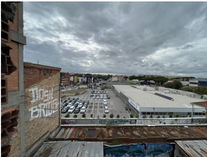
Slikovni prilog 20. Fotografija pogleda sa zida lođe na autosalon.

Naglašavanje ravnodušnosti te istodobne i gotovo naizmjenične solidarnosti prema potrebitima poput migranata, nisu karakteristični samo za Metropoliz . Navedene situacije mogu asociirati na hrvatski kontekst te način kako se medijski reprezentiraju priče o stranim radnicima. Vijesti online portala često su naslovljene bombastičnim naslovima: „strane radnike trpaju u poslovne prostore kao stoku...”, „Hrvati imaju novi unosan biznis: neki oglasi krajnje su bezobrazni”, „poduzetnik ugurao trideset i dva strana radnika u državni stan” i sl. O takvim situacijama Laura i ja smo razgovarale tijekom našeg boravka u Metropolizu . Sjedile smo na zajedničkoj lođi pred „našim” stanom i razmjenjivale sjećanja na prizore koje smo protumačile kao nepravedan tretman stranih radnika u Hrvatskoj. U trenucima uzrujanosti i ljutnje, pogled nam je zalutao preko zida lođe na autosalon koji se nalazio tik uz Metropoliz . Prizor je izgledao pomalo smiješno, budući da smo s vrha prilično derutne zgrade promatrale svijetlu konstrukciju nalik novogradnji pred kojom su se ritmički nizali automobili crne i bijele boje. Kasnije smo u razgovoru sa sugovornicom S. saznale da su se nekadašnji gabariti skvota protezali na čak dva kućna broja, Via Prenestina 913 – broju na kojem je smješten Metropoliz , i 911 – broju na kojem se danas nalazi autosalon. Iako je tada bila djevojčica, G., nećakinja moje sugovornice S., a