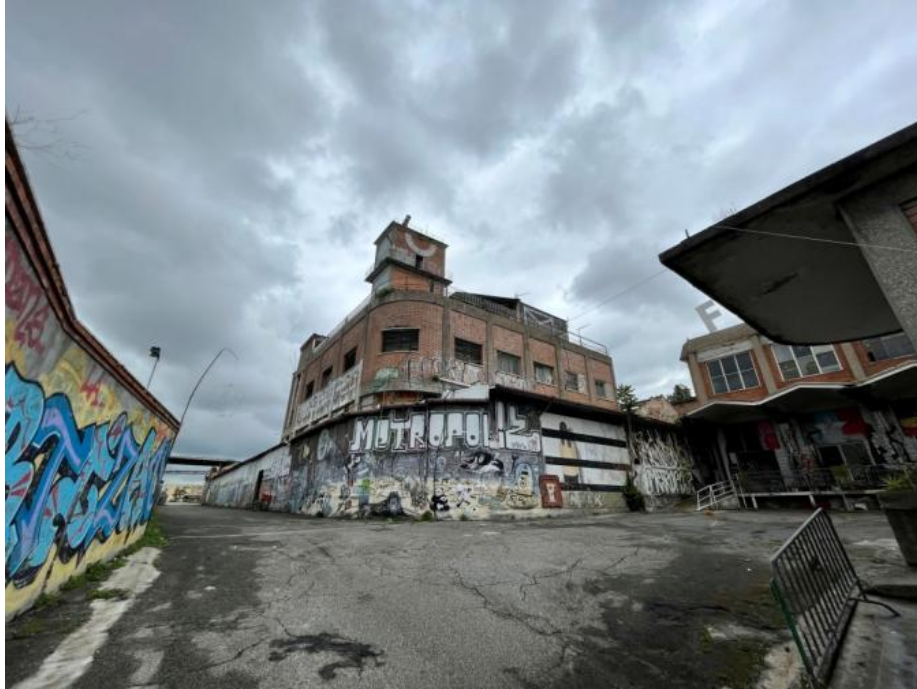
Slikovni prilog 2. Fotografija jednog dijela Metropoliza s tornjem; fotografirano s ulaza.