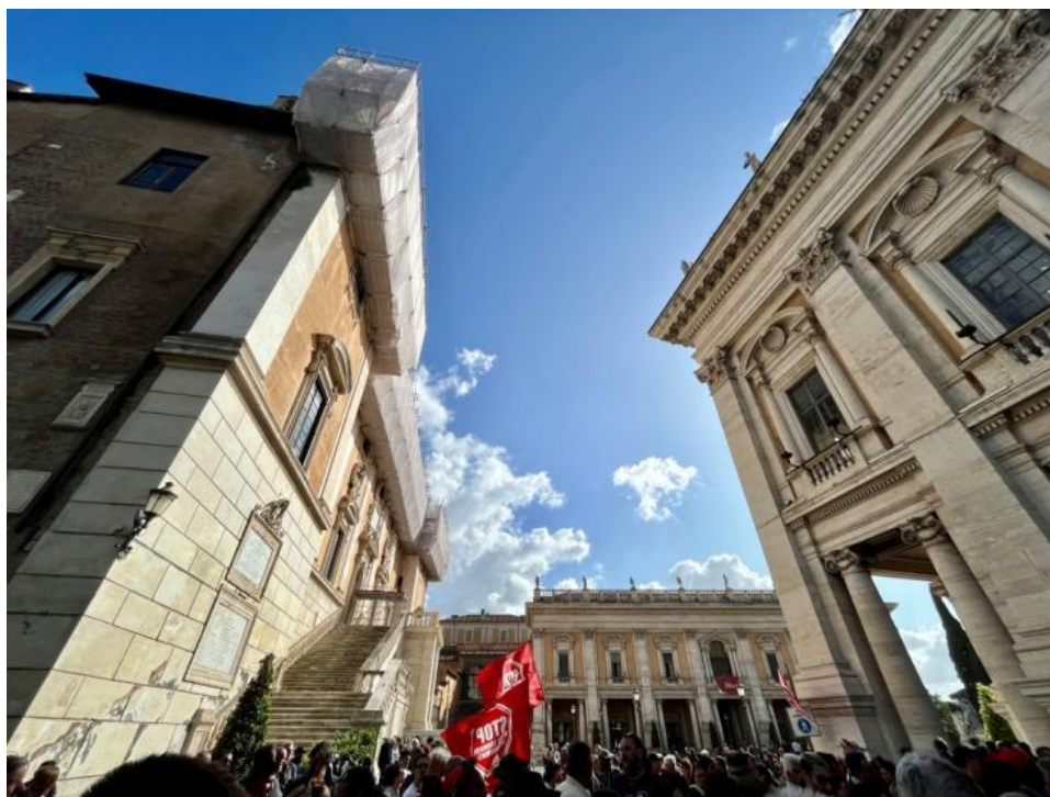
Slikovni prilog 7. Fotografija s demonstracije.