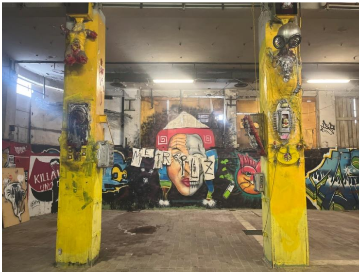
Slikovni prilog 16. Fotografija zidnih oslika i umjetničkih instalacija u MAAM-u.

ograničenja, pokušaj poticanja inkluzivnijeg i pragmatičnijeg razumijevanje čovječanstva. Promišljanje mjesta čovjeka u svemiru i međuljudskih odnosa, osnovna su ideja ovog umjetničkog pothvata, kao i prihvaćanje potencijala za radikalno drugačiju budućnost.