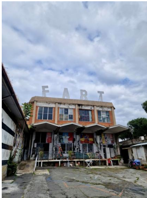
Slikovni prilog 3. Fotografija blok-zgrade s ulazom u MAAM .