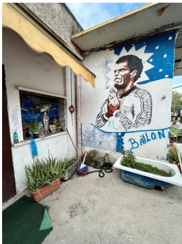
Slikovni prilog 12. Fotografija dijela fasade stana sugovornice S.