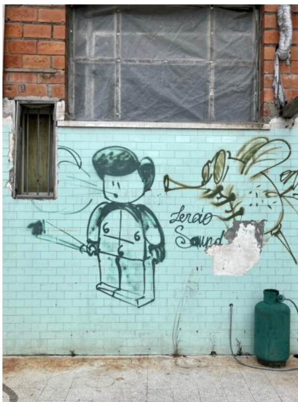
Slikovni prilog 10. Fotografija zida zajedničke lođe.