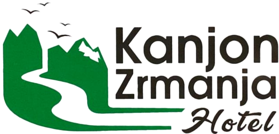
Slika 15. Logotip hotela Kanjon Zrmanja