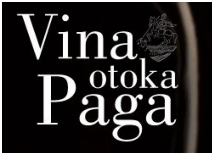
Slika 9. Logotip vinarije Vina otoka Paga