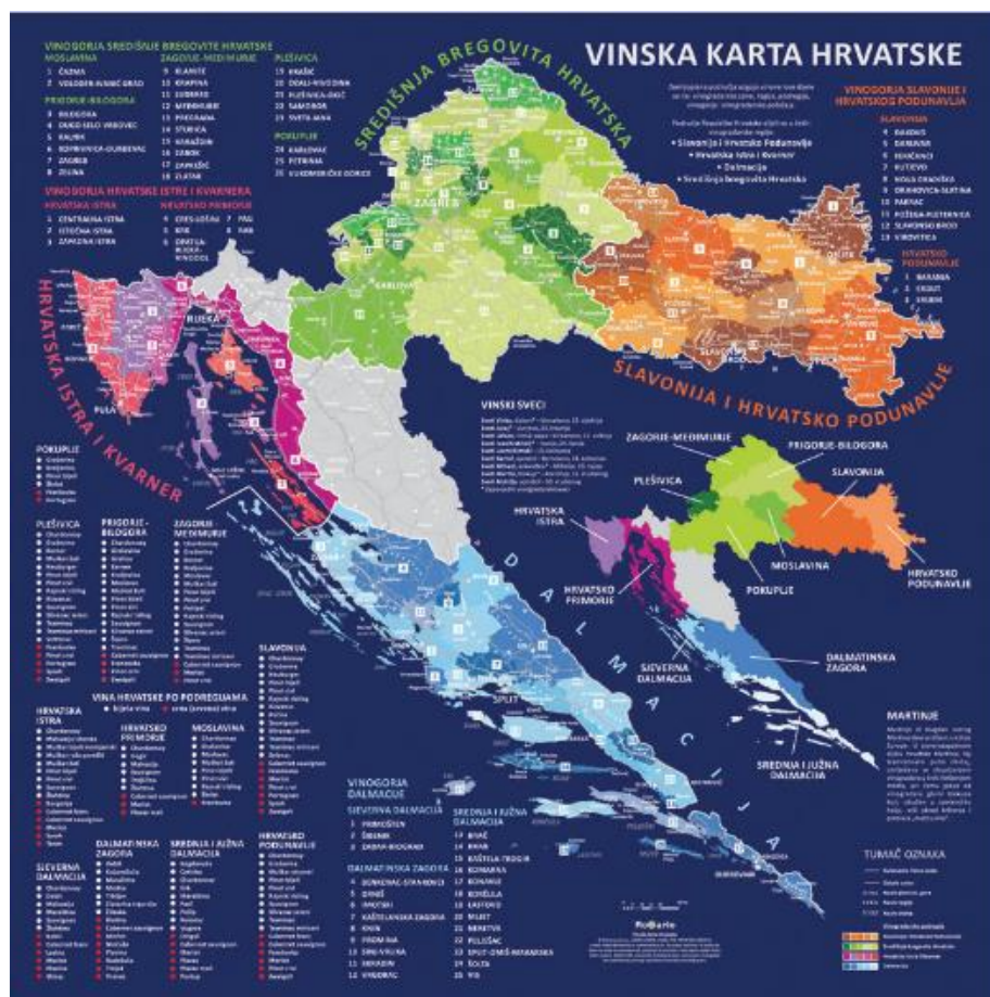
Slika 1. Vinske regije u Republici Hrvatskoj