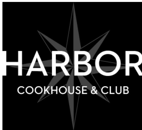
Slika 16. Logotip restorana Harbour Cookhouse&Club