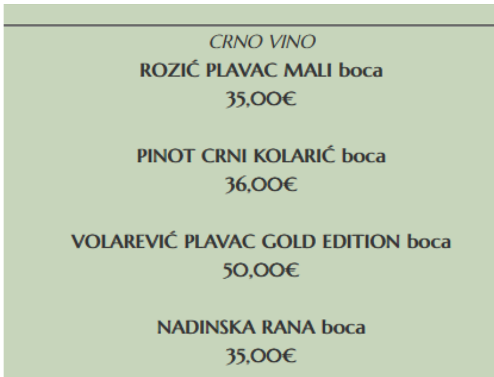
Slika 7. Vinska karta hotela Kanjon Zrmanje