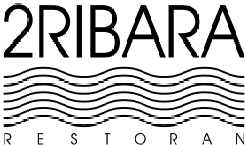
Slika 17. Logotip restorana Dva ribara