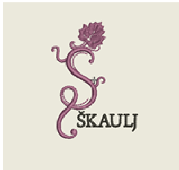
Slika 13. Logotip vinarije Škaulj