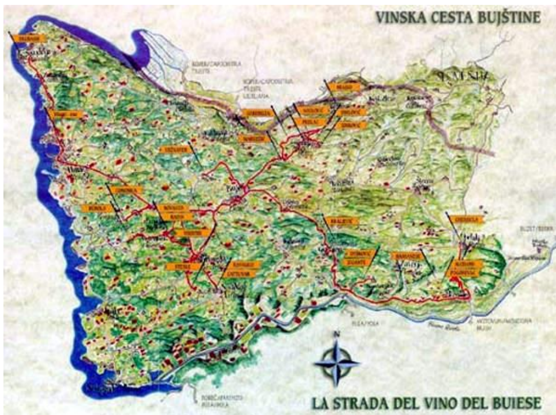
Slika 5. Vinska cesta Bujštine (Istra)