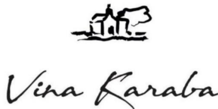
Slika 10. Logotip vinarije Karaba