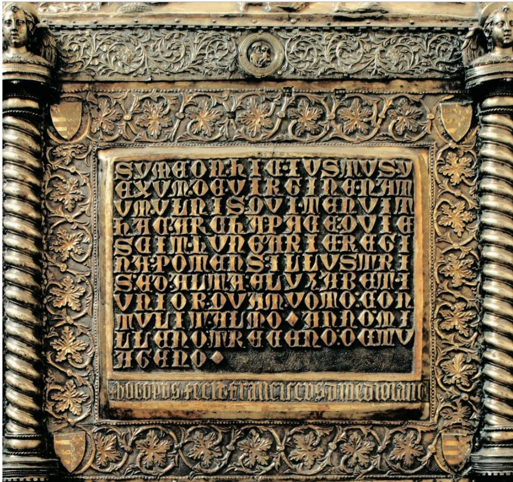
Prilog 8. Tekst na glagoljici ugraviran u škrinju sv. Šime.