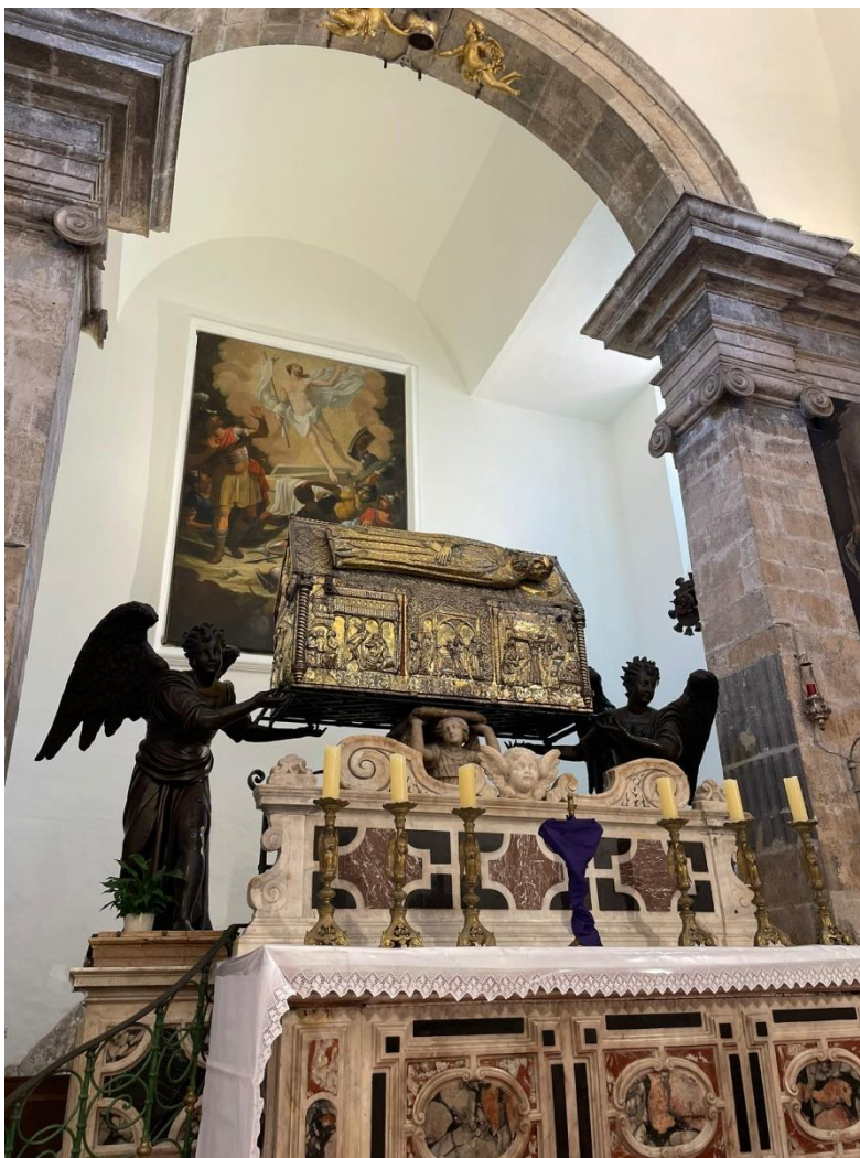
Prilog 3. Srebrna škrinja sv. Šime iza glavnog oltara.