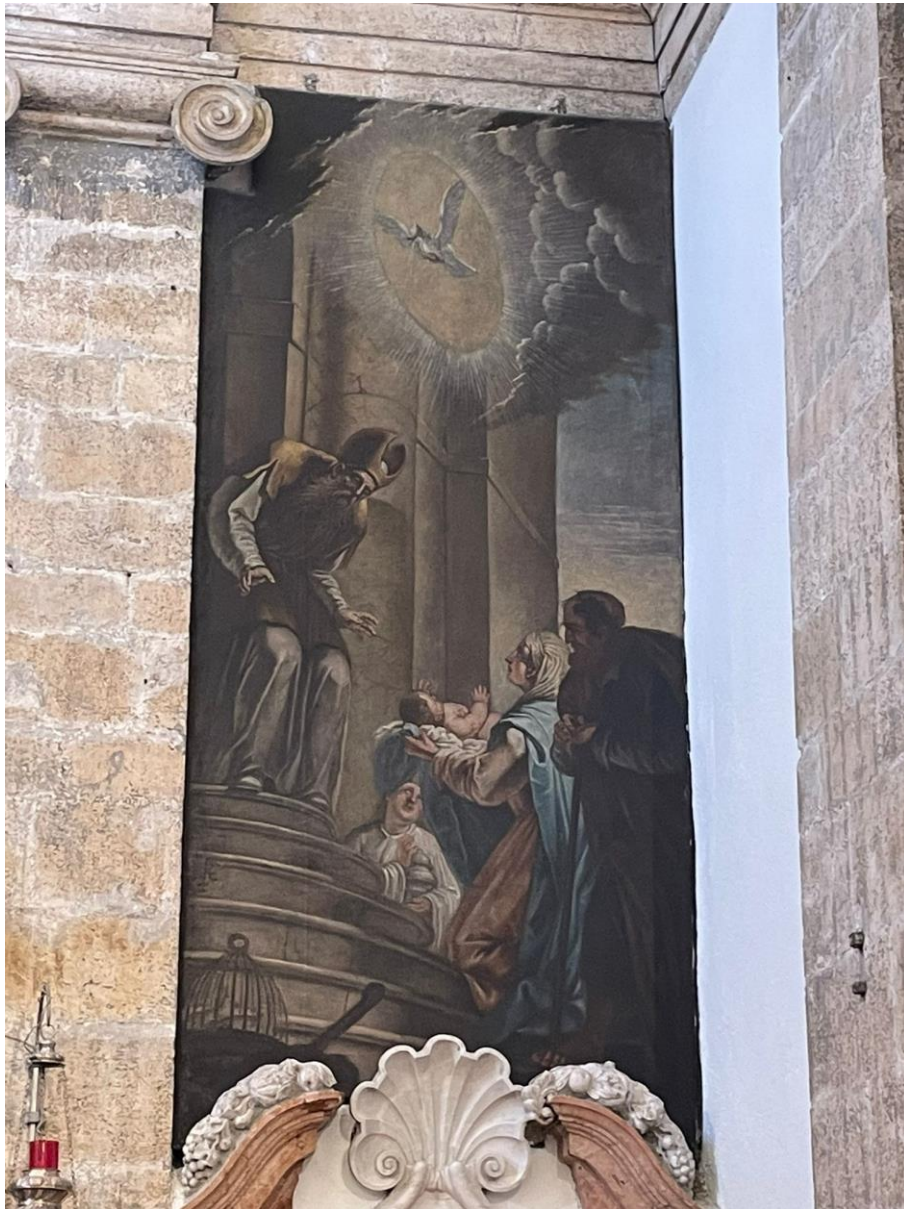
Prilog 10. Slika na zidu pored oltara s desne strane koja prikazuje starca Šimuna i Svetu Obitelj (prikazanje djeteta Isusa u hramu). Autor slike: Giovanni Battiste Augusti Pitteri. 40