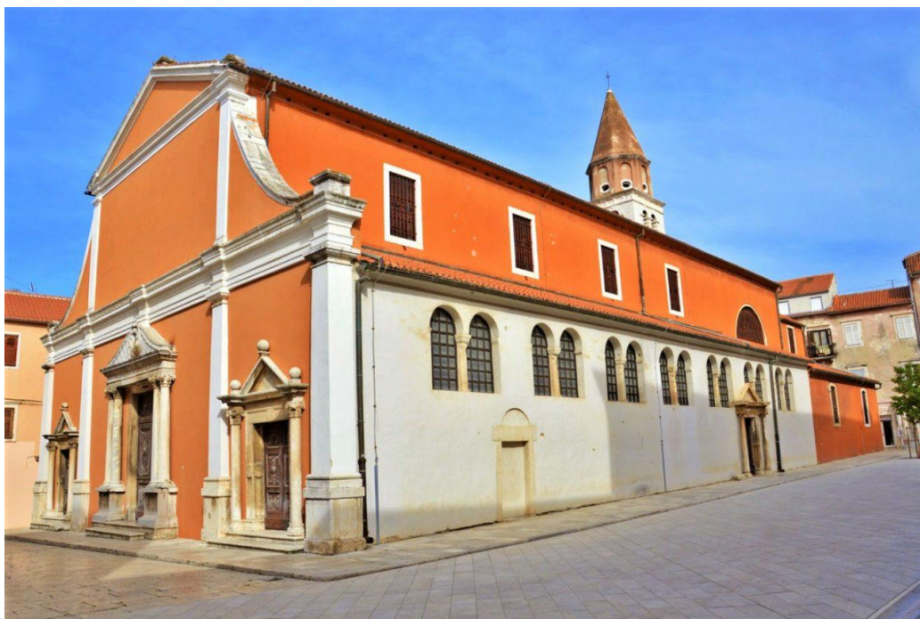
Prilog 1. Crkva sv. Šime na Poluotoku, Zadar.