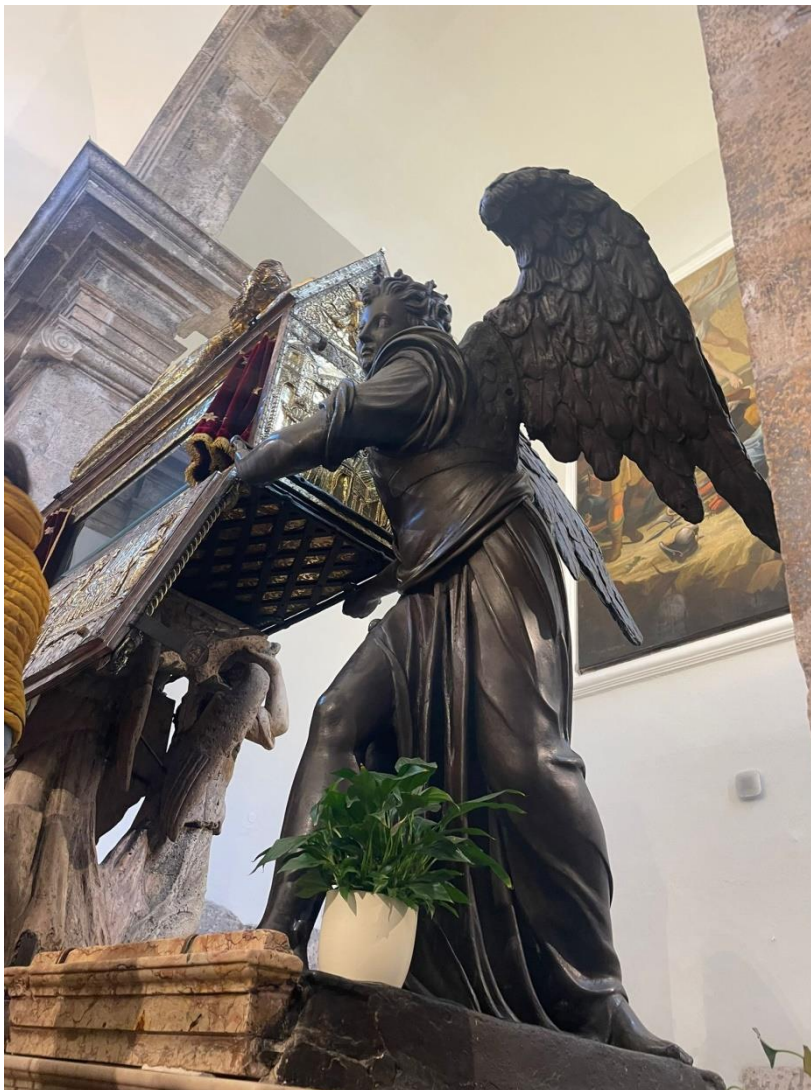
Prilog 4. Jedan od brončanih anđela.