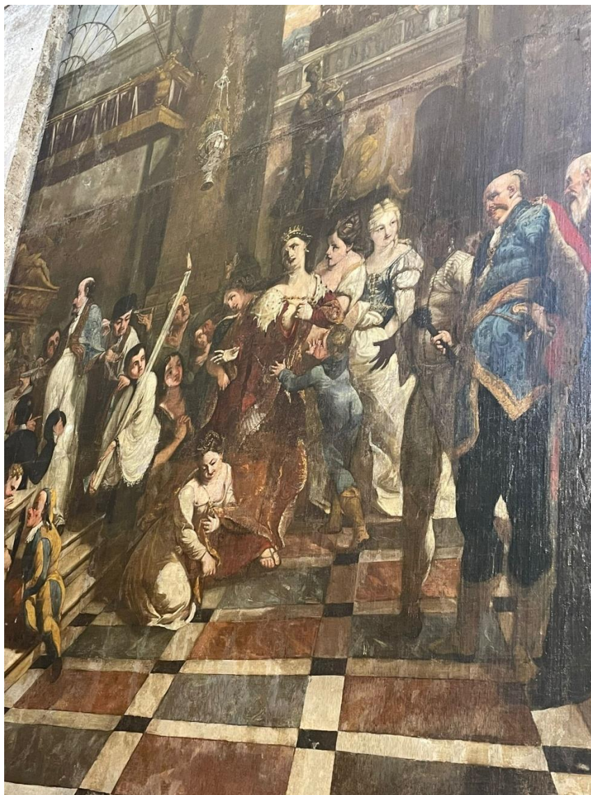
Prilog 9. Slika na bočnom zidu kod glavnog oltara koja prikazuje „Elizabetino ludilo“. Autor slike: Giovanni Battiste Augusti Pitteri. 39