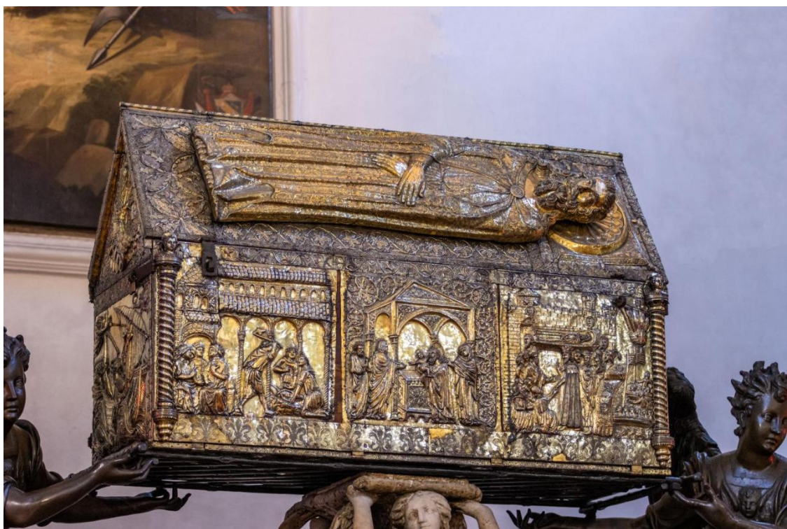
Prilog 7. Ukrasi na škrinji koji opisuju detalje vezane uz relikvije sv. Šime.