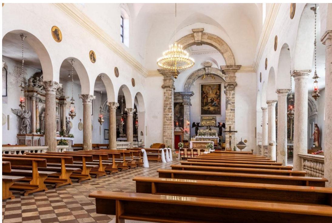
Prilog 2. Unutrašnjost trobrodne crkve sv. Šime.

https://www.zadarskanadbiskupija.hr/zadar-novi-zbor-chorus-sancti-simeoni-u-svetistu-sv-sime-pod-vodstvom-mihovila-buturica/