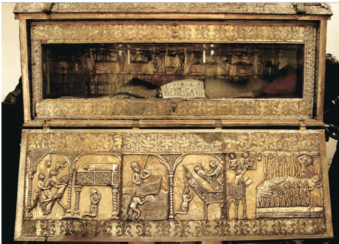
Prilog 6. Relikvije sv. Šime u škrinji.