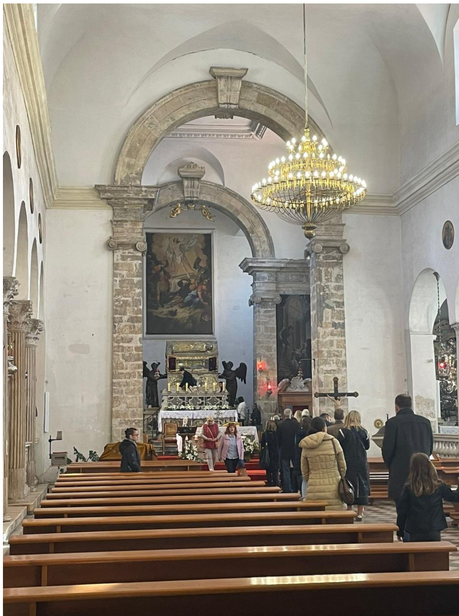
Prilog 5. Vjernici čekaju u redu i dodiruju relikvije i škrinju sv. Šime.