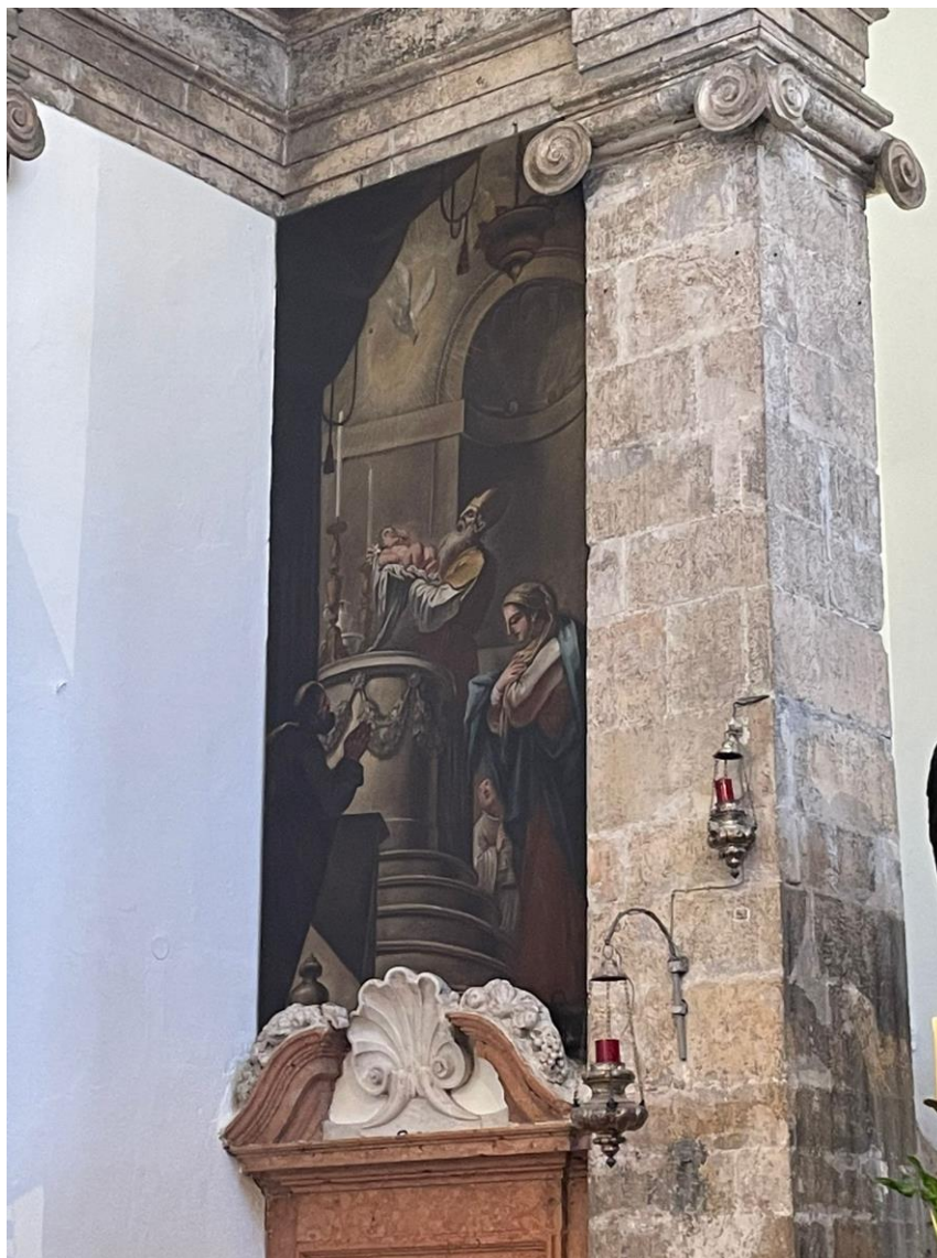
Prilog 11. Slika na zidu pored oltara s lijeve strane koja prikazuje starca Šimuna i Svetu Obitelj (prikazanje djeteta Isusa u hramu). Autor slike: Giovanni Battiste Augusti Pitteri. 41