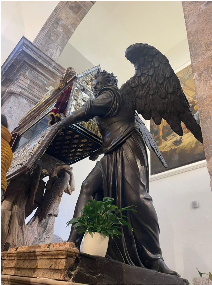
Prilog 4. Jedan od brončanih anđela.