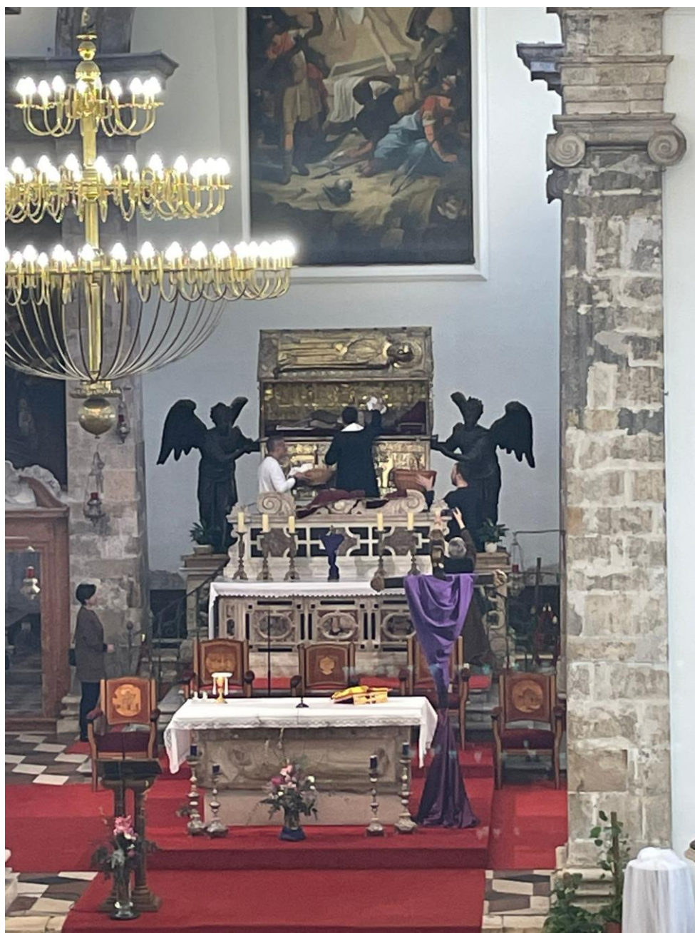
Prilog 12. Posvećivanje Pamuka sv. Šime.