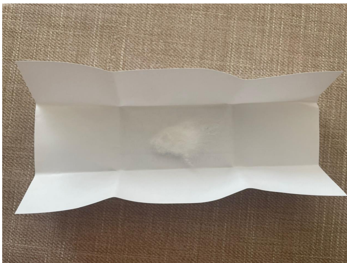
Prilog 14. Komadić posvećenog pamuka.