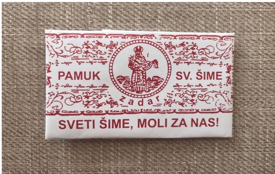
Prilog 13. Pamuk sv. Šime.