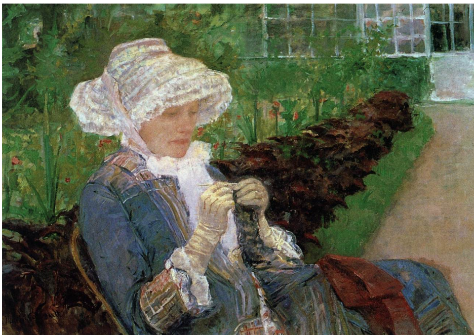
5. Mary Cassatt, Lydia kukiča u vrtu , 1881., Metropolitan Museum of Art, New York