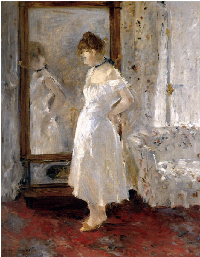
4. Berthe Morisot, Djevojka pred ogledalom , 1877.-'79., Museo Thyssen-Bornemisza, Madrid