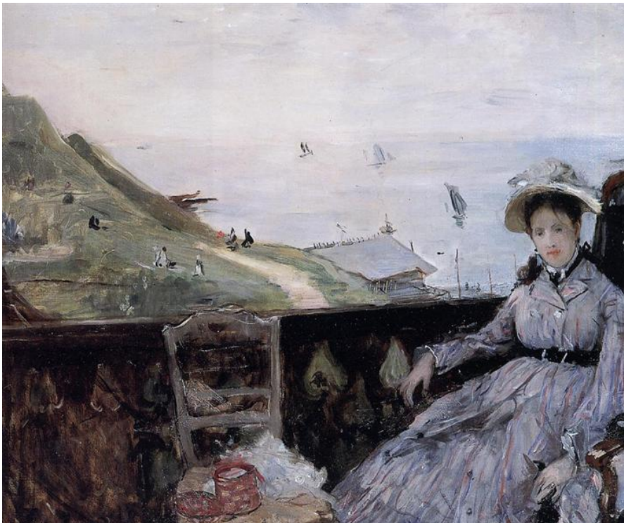
8. Berthe Morisot, Na terasi , 1874., Art Institute of Chicago, Chicago