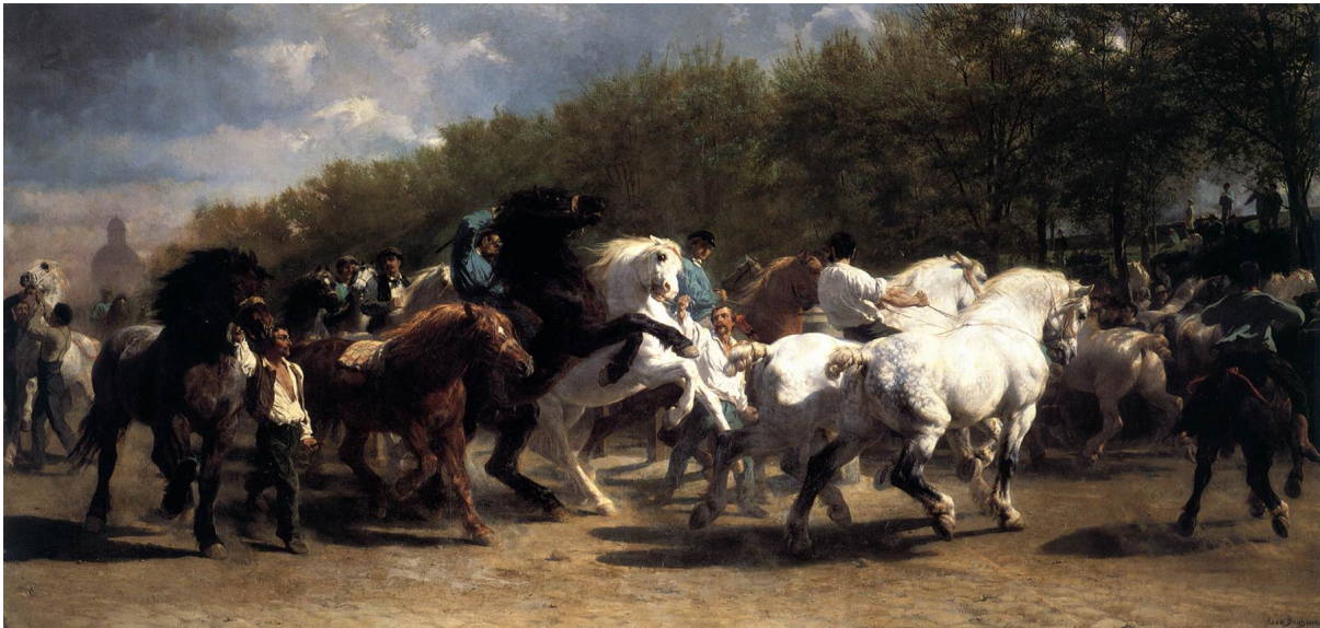
1. Rosa Bonheur, Konjski sajam , 1851.-'53., Metropolitan Museum of Art, New York