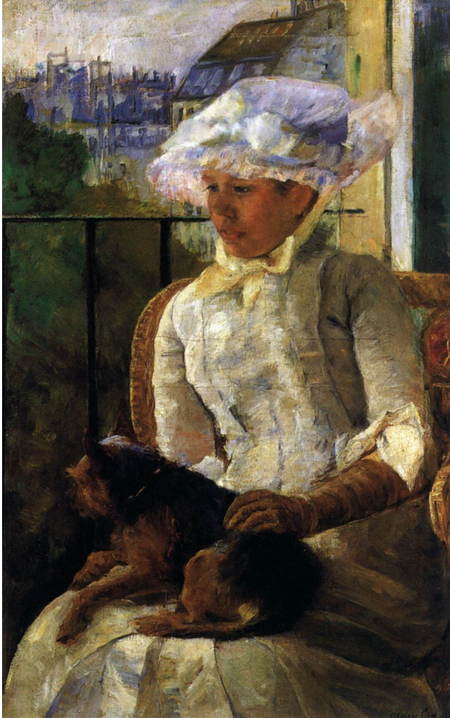
9. Mary Cassatt, Susan na balkonu , 1883., Corcoran Gallery of Art, Washington