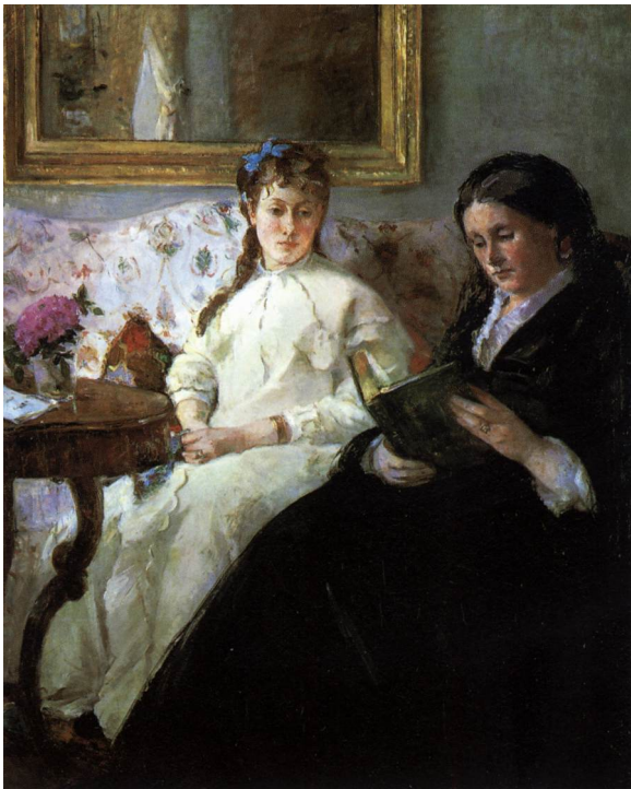
2. Berthe Morist, Majka i sestra čitaju, 1869.-1870, National Gallery of Art, Washington