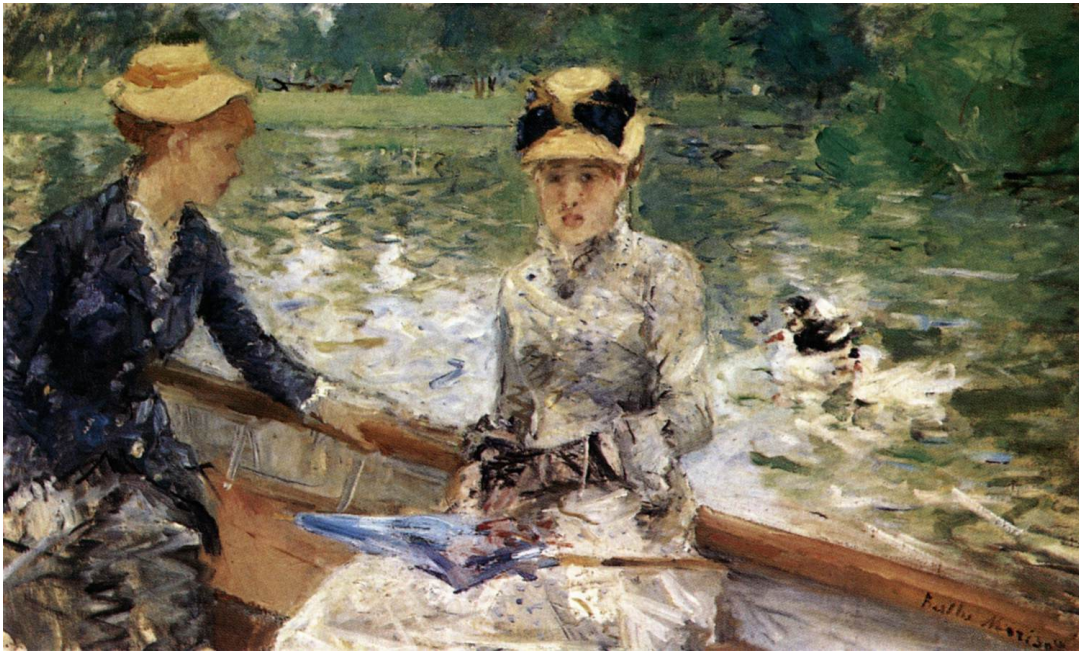
3. Berthe Morisot, Ljetni dan , 1880., National Gallery, London