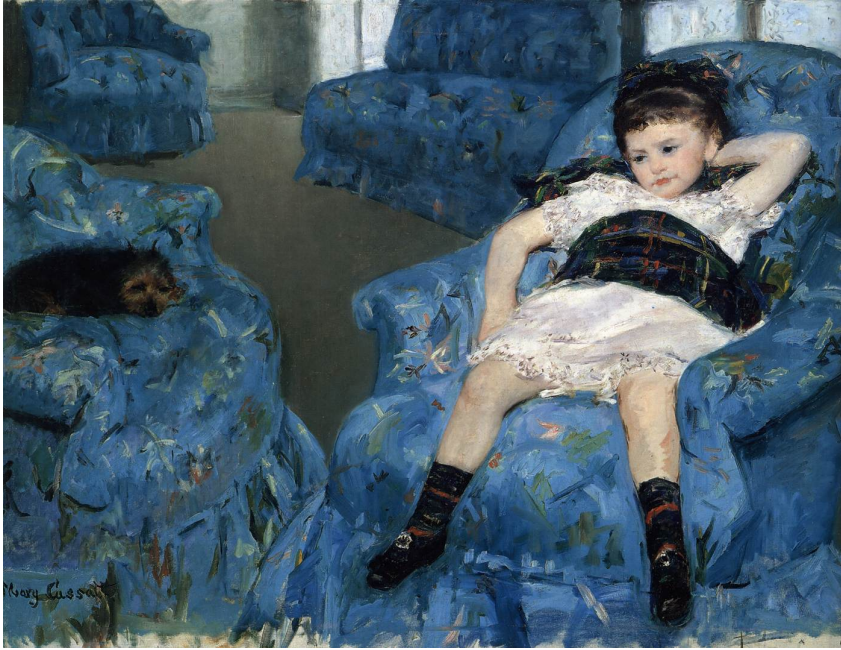
7. Mary Cassatt, Plava soba , 1878., National Gallery of Art, Washington