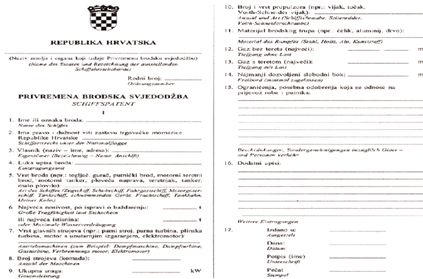
Slika 2. Privremena brodaska svjedodžba

Također, bitno je istaknuti kako se umjesto plovidbenog plovidbenog lista brodu može izdati privremena svjedodžba o državnoj pripadnosti brida (Burić, 2013.).