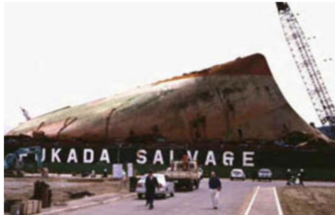
Slika 4. Pramčani dio broda Nakhodka nakon nesreće [9]

brod je u ovoj nesreći prevezio 19.000,00 tona nafte [3]. Prve mrlje nafte do japanske obale nakon pet dana od nesreće, te su malo po malo pogođeni obalni ribolovi, turističke aktivnosti, uzgoj ribe i nekoliko prirodnih mjesta. Pramčani dio broda nasukao se na obali (slika 4), a krmeni potonuo s dijelom tereta. U akcijama čišćenja sudjelovalo je čak preko 200.000,00 ljudi kojima je trebalo više od mjesec dana da izvuku svu naftu [9].