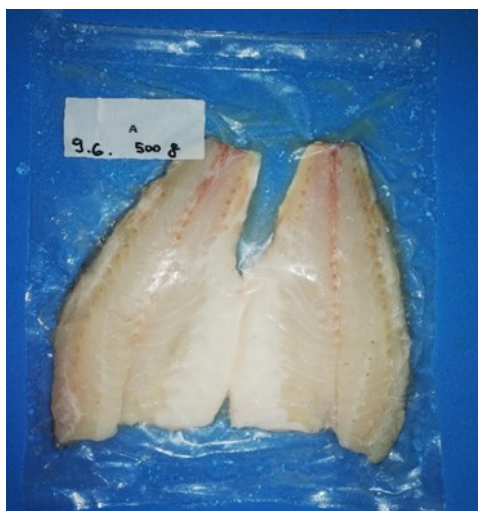
Slika 4. Pakiranje fileta brancina u plastičnoj vrećici sa pripadajućim oznakama (uzorak za mikrobiološku i kemijsku analizu, T11, Ike Jime metoda usmrćivanja).

Uzorci ribe su se nakon usmrćivanja filetirali u pogonu za preradu, vagali, pakirali u plastične vrećice (slika 4.), označavali po težini (npr. 500 g, 300 g), metodi usmrćivanja (uzorak A i B), te su se finalno pokrivali ledom i skladištili u hladnjači.