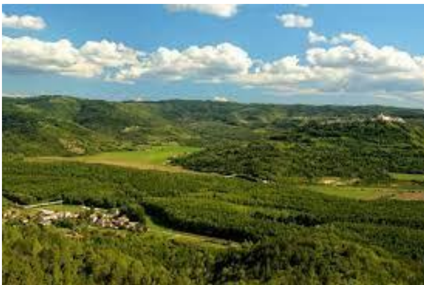
Slika 5. Istarske šume