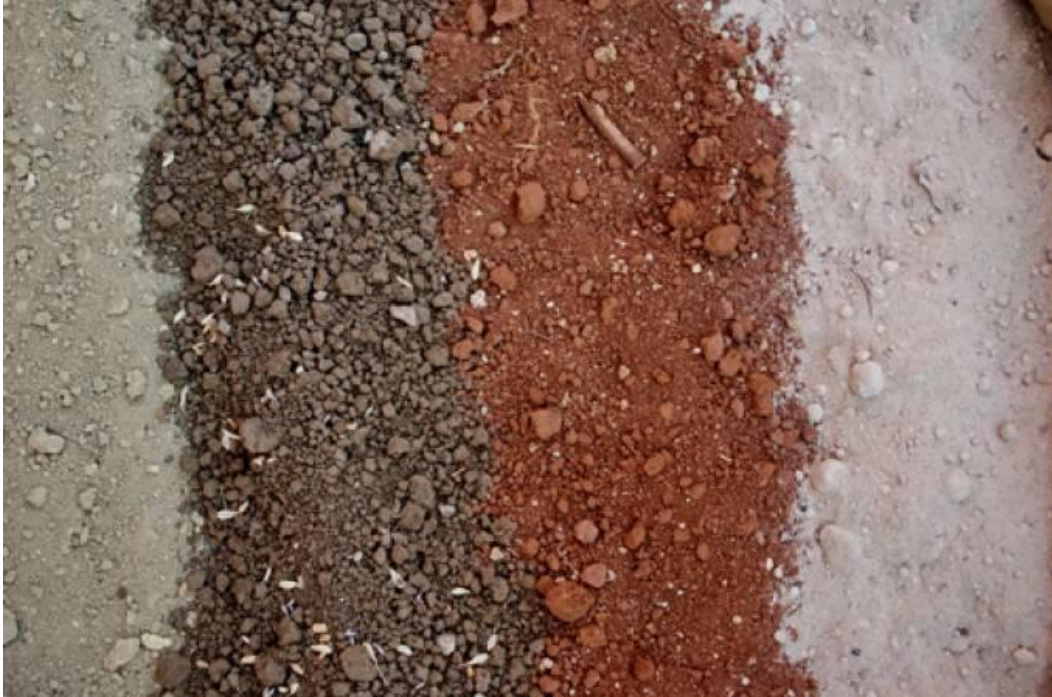
Slika 4. Četiri vrste tla u Istri

Čitava flišolika serija diskordantno je nataložena na starije naslage. U razdoblju kvartara čitav se prostor poluotoka izdizao, pa su se vodeni tokovi pojačano urezivali i produbljivali. Tako je zbog obilja vode s flišnoga naplavnoga područja došlo do skretanja Pazinskoga potoka u podzemni tok na kraju kanjonski urezanoga korita (Istarska enciklopedija, 2005.) .