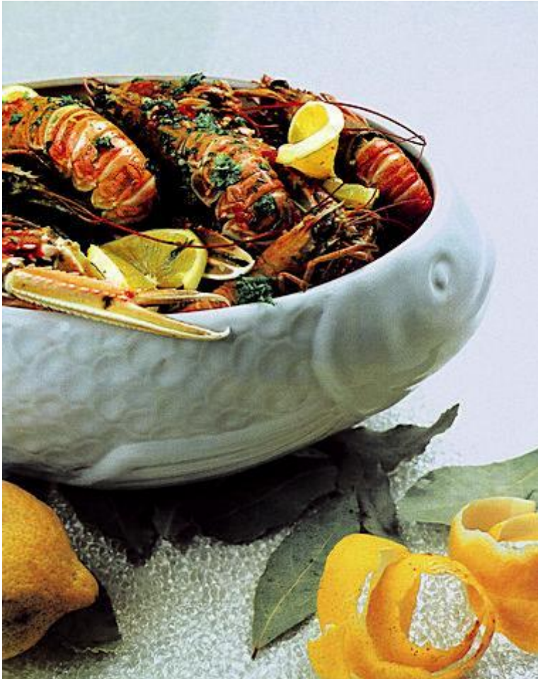
Slika 8. Škampi

kruha (od miješanoga kukuruznog i pšeničnog brašna), koji se zagrije na tronošcu na ognjištu, začini maslinovim uljem, potom se zarumenjene kriške kruha polože u bukaletu ili terinu (posudu), pošećere i zaliju zagrijanim crnim vinom (Kalapoš, S., 1998.).