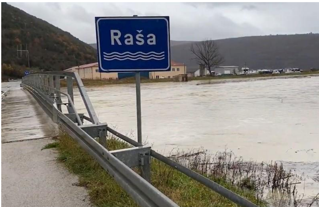
Slika 3. Rijeka Raša

Širina jezera najveća je na njegovu kraju, gdje se ponekad primjećuje vrtloženje vode. Obilazak jezera moguć je jedino uz pomoć čamca, jer je dubina vode uglavnom do 10 m. Ponor je formiran u vodopropusnim gromadastim krednim vapnencima na mjestu kontakta s vodonepropusnim flišnim eocenskim sedimentima. Izdizanjem istarske vapnenačke ploče u geološkoj prošlosti vode iz flišnoga zaleđa počele su duž rasjednih pukotina korozijski i erozijski širiti raspucali vapnenac te tako oblikovati kanale, prolaze i dvorane različitih veličina i širina. Dolaskom na kompaktnije naslage, voda u obliku priobalnih izvora ponovno izlazi na površinu. Za vrijeme proljetnih i jesenskih padalina te iznenadnih ljetnih pljuskova u ponor dotječu velike količine poplavne vode, pa se razina vode na otvoru podigne i više od 50m.