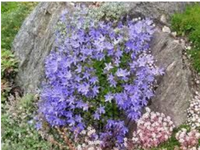
Slika 6. Flora Istre