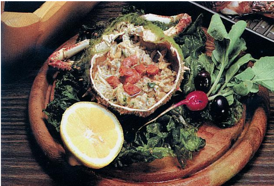
Slika 8. Salata od rakovica

Salata se začinjala mašću otopljenih cvarki ili črčki, morskom solju i domaćim vinski octom, a samo u posebnim prilikama domaćim maslinovim uljem. Stariji se radič prvo kuhao i zatim pripremao u fritaji kako bi izgubio na gorčini. Tipična mediteranska salata sastojala se od rige, rokulje, rokule i kuhanoga krumpira. Meso se jelo samo u posebnim prilikama, za vjenčanja i u doba blagdana. Najviše se trošila svinjetina: osim pršuta, omiljeni su žlomprt (ombulo, zarebnjak, kanica), kao i pršut natrljan i paprom i solju, te kobasice, najčešće posluživane s kapuzom.