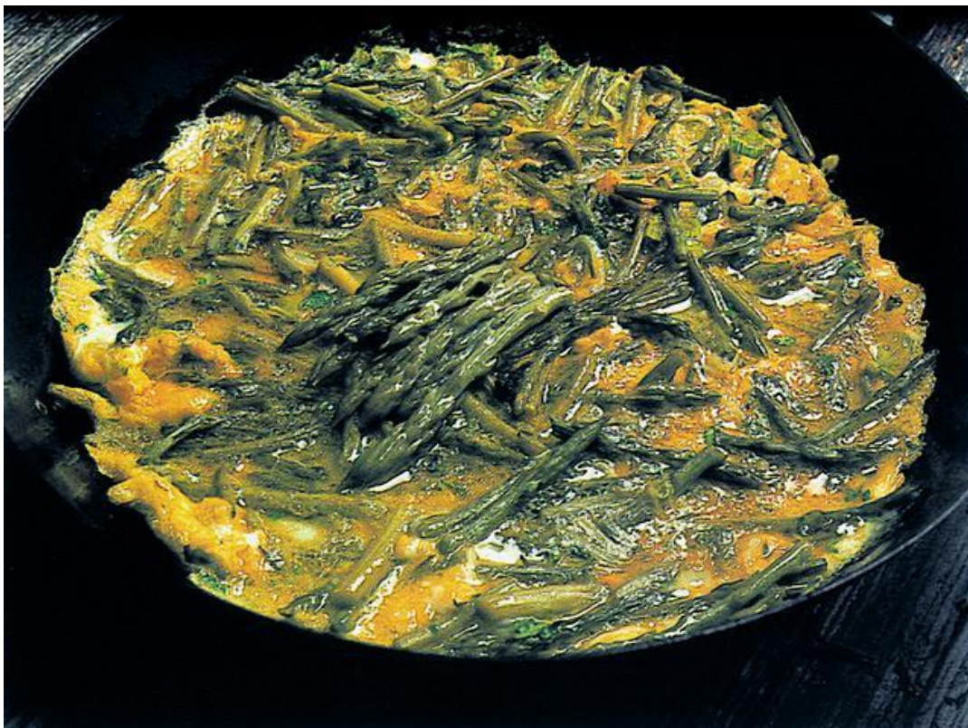
Slika 7. Divlje šparoge s jajima