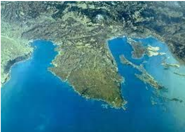
Slika 1. Istarski poluotok

Duboki i uski Limski zaljev očiti je primjer potopljene riječne kanjonske doline u kršu, koju je svojom erozijskom snagom oblikovao Pazinski potok. Njime je u geološkoj prošlosti voda s Ćićarije otjecala u more. Zbog izdizanja kopna duž rasjeda (Pazinski ponor) voda koja dotječe Pazinskim potokom nastavlja svoje otjecanje podzemnim tokovima. Mlađi fluvijalni procesi erozije i akumulacije djelomično su izmijenili obalne oblike. Rijeke nose i naplavljuju trošan materijal, nastao ispiranjem flišnih padina. Mirna je djelomično zatrpala potopljeni dio kanjonske doline i nataložila močvarnu ravnicu, a slično se dogodilo oko ušća Rižane, Dragonje i Raše. Prije presijecanja tektonskim pokretima i Pazinski je potok zatrpavao niže dijelove Limske drage (Vlahović, I i sur., 2003.).