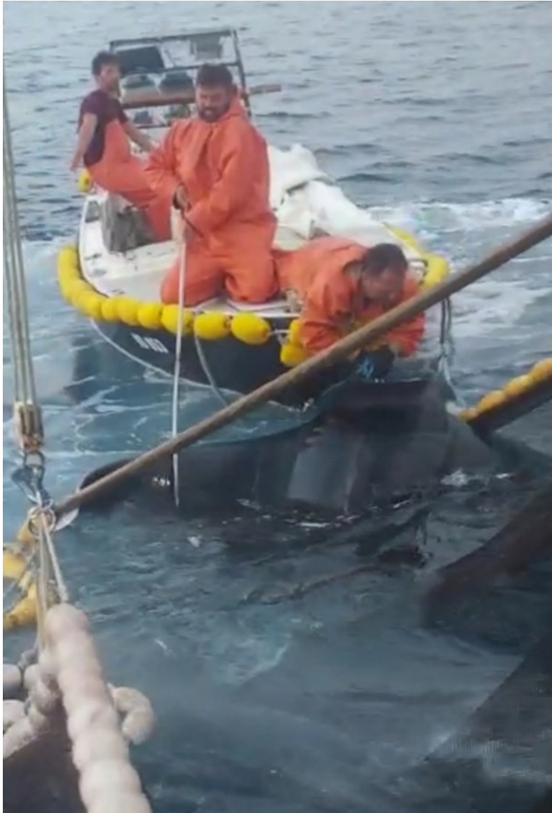
Slika 3. Golub uhan ( M. mobular ) u prilovu