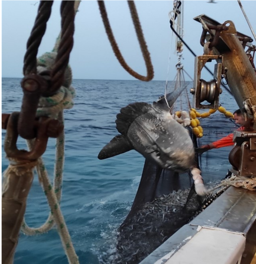
Slika 2. Veliki bucanj ( M. mola ) u prilovu

Tablica broj 3. prikazuje kako su se u 83 evidentirana ribolovna dana ulovila 2 goluba uhana (slika 3), 1 žutuga ljubičasta i 5 glavatih želvi. Morske ptice nisu evidentirane u prilovu, dok su morski sisavci zabilježeni u interakciji s ribolovnim alatom bez da su ulovljeni kao prilov.