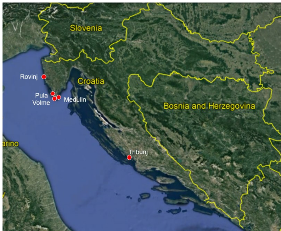
Slika 1. Mjesta i luke u kojima su se provodila anketna istraživanja o prilovu u mrežama plivaricama srdelarama

U istraživačkom dijelu rada korišteni su anketni upitnici u lukama i na ribarskim plovilima, te su ispitani ribari koji se isključivo bave ribolovom mrežama plivaricama srdelarama. Aktivnosti istraživanja (prikupljanje i obrada podataka) obavljeno je u skladu s "GFCM (eng. General Fisheries Commission for the Mediterranean ) Data policy" dokumentom, koji sadrži standardizirana pravila i procedure za pohranu, pristup, zaštitu i korištenje podataka o slučajnim ulovima ugroženih vrsta morskih organizama u ribarstvu Sredozemnog i Crnog mora. Istraživanje se koncentrira na ribolovne aktivnosti koje se odvijaju u neposrednoj blizini luka jer su one idealno mjesto za prikupljanje podataka o ulovu i prilovu, s obzirom da se i iskrcaj odvija u istim. (slika 1.). U razdoblju od travnja 2021. do kolovoza 2022. provedeno je ukupno 55 anketa u lukama i 28 terenskih promatranja sa plovila. Većina anketa prikupljena je u lukama u istarskom području (Pula, Volme, Medulin, Rovinj), dok su u luci Tribunj prikupljena 22 anketna upitnika u lukama, i 4 terenska promatranja sa plovila.