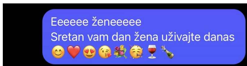
Slika 1. (Messenger, 8.3. 2024.)

Sljedeći primjer prikaz je komunikacijskih tekstova koji je su popraćeni emotikonima i skraćenicama: