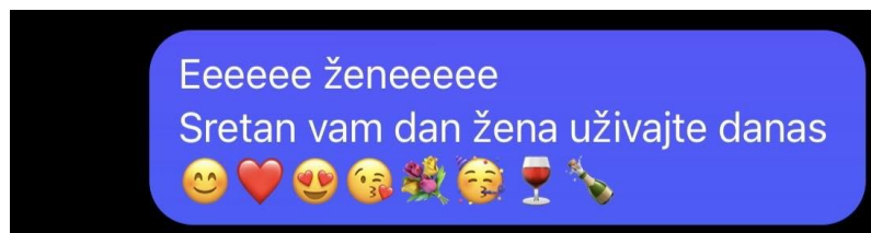
Slika 1. (Messenger, 8.3. 2024.)

Sljedeći primjer prikaz je komunikacijskih tekstova koji je su popraćeni emotikonima i skraćenicama: