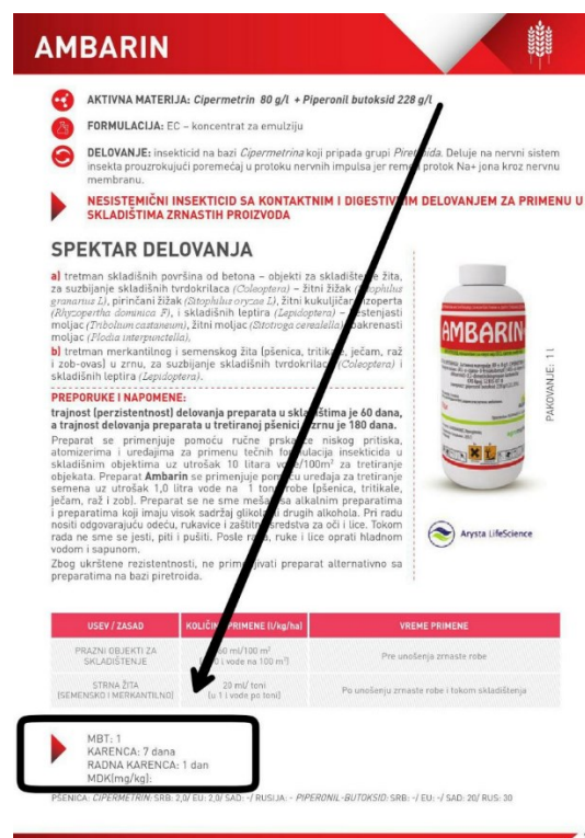
Slika 3. Primjer karence pesticida u iznosu od sedam dana.

Karenca je definirana kao vrijeme koje mora proći nakon zadnje aplikacije sredstva za protekciju bilja do žetve ili berbe, a izražava se u danima. Taj sigurnosni razmak iznimno je bitan jer omogućuje da se aplicirano sredstvo za zaštitu razgradilo do propisane vrijednosti. Propisana vrijednost za svaku biljnu kulturu određena je prema karakteristikama sredstava za zaštitu bilja, načinu korištenja, količini primijenjenog sredstva i metabolizmu aktivne tvari. Karenca istog sredstva može biti različita za različite kulture na koje se primjenjuje. Također, propisana je zabrana rada za vrijeme koje mora proći od primjene sredstva do ponovnog ulaska radnika na tretiranu površinu. Osim za radnike, radna zabrana se može odrediti i za životinje koje dolaze na ispašu. Za ljude se izražava u satima, a za životinje u danima. Ukoliko se karenca ne poštuje moguća je veća izloženost ostacima pesticida od dopuštenih što može biti štetno za zdravlje i ljudi i životinja. Osim na tretiranim područjima, ostatke pesticida možemo pronaći i na susjednim, netretiranim područjima. Do toga dolazi ukoliko se pesticidi primjenjuju kod vjetrovitog vremena kada dolazi do širenja na okolna područja (10).