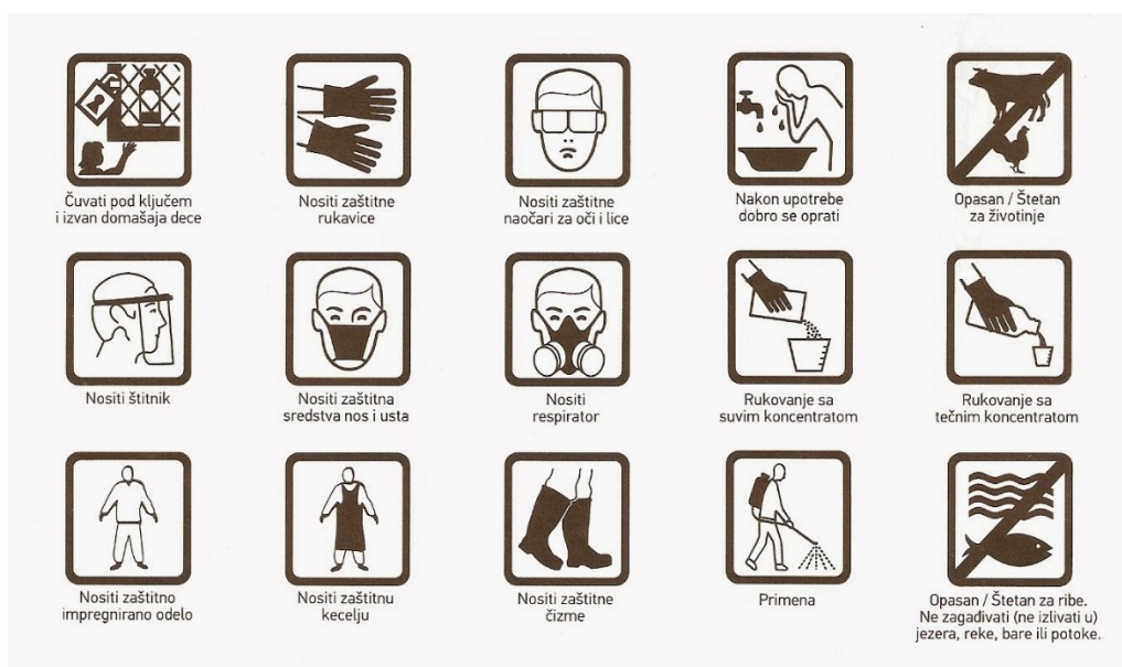
Slika 2. Mjere zaštite pri uporabi pesticida.

Nakon obavljenog zahvata, zaštitnu odjeću koja je došla u kontakt sa sredstvom treba isprati vodom prije skidanja. Zaštitna obuća treba biti otporna na kemikalije te ju je potrebno također isprati vodom prije izuvanja. Zaštitne rukavice moraju biti otporne na kemikalije i ne smiju propuštati mineralna ulja, vodu te organska otapala (HRN EN 374). Zaštitna maska je obavezna ukoliko se primjenjuju sredstva koja mogu izazvati oštećenja i nadražiti dišne puteve. Ovisno o razini djelovanja koriste se zaštitne maske s visokom, srednjom ili niskom sposobnošću hvatanja čestica. Bitno je koristiti i zaštitne naočale u slučaju uporabe sredstava kod kojih je moguće prskanje. Važno je da dobro prijanjaju i štite osobu koja koristi potencijalno štetno sredstvo pri radu (26).