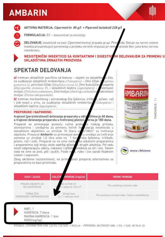
Slika 3. Primjer karence pesticida u iznosu od sedam dana.

Karenca je definirana kao vrijeme koje mora proći nakon zadnje aplikacije sredstva za protekciju bilja do žetve ili berbe, a izražava se u danima. Taj sigurnosni razmak iznimno je bitan jer omogućuje da se aplicirano sredstvo za zaštitu razgradilo do propisane vrijednosti. Propisana vrijednost za svaku biljnu kulturu određena je prema karakteristikama sredstava za zaštitu bilja, načinu korištenja, količini primijenjenog sredstva i metabolizmu aktivne tvari. Karenca istog sredstva može biti različita za različite kulture na koje se primjenjuje. Također, propisana je zabrana rada za vrijeme koje mora proći od primjene sredstva do ponovnog ulaska radnika na tretiranu površinu. Osim za radnike, radna zabrana se može odrediti i za životinje koje dolaze na ispašu. Za ljude se izražava u satima, a za životinje u danima. Ukoliko se karenca ne poštuje moguća je veća izloženost ostacima pesticida od dopuštenih što može biti štetno za zdravlje i ljudi i životinja. Osim na tretiranim područjima, ostatke pesticida možemo pronaći i na susjednim, netretiranim područjima. Do toga dolazi ukoliko se pesticidi primjenjuju kod vjetrovitog vremena kada dolazi do širenja na okolna područja (10).