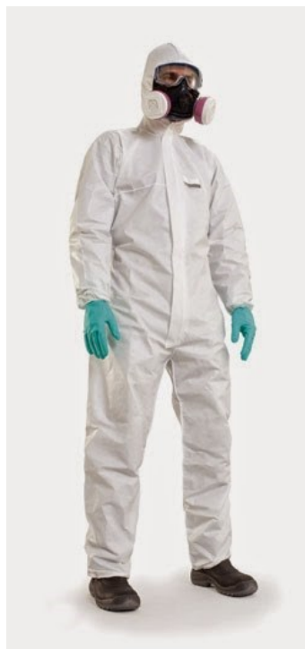
Slika 1. Zaštitna odjeća, obuća, rukavice i maska.

Osnovna mjera za smanjenje rizika od otrovanja pesticidima je uporaba zaštitne opreme. Kod rukovanja sa sredstvima koja se koriste za zaštitu bilja može se primjenjivati sljedeća zaštitna oprema: zaštitna pregača, zaštitna odjeća, zaštitna kapuljača, zaštitne rukavice, zaštitna obuća, štitnici za lice, zaštitne naočale koje dobro prijanjaju i zaštitna filtarska maska ili polumaska te u posebnim radnim uvjetima i samostalni uređaj za disanje (26). Svaki dio zaštitne opreme mora biti označen s brojem kategorije i oznakom CE kojom proizvođač dokazuje da je oprema proizvedena u skladu s odredbama Zakona o održivoj uporabi pesticida (28). Zaštitna odjeća mora imati osim broja kategorije i CE oznake, trgovačko ime, naziv proizvođača, broj specifične norme po kojoj je izrađena te piktogram sa svrhom prikaza specifične opasnosti od kojih odjeća štiti te način održavanja odjeće kao i razinu protektivnog djelovanja. Kod rukovanja određenim kemikalijama potrebno je koristiti nepropusnu zaštitnu odjeću te posebnu zaštitu za glavu i vrat. Kape ili pamučni šeširi nisu pogodni jer brzo upijaju tvari (26).