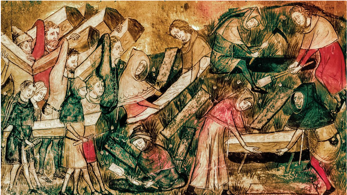
Slika 3 Najraniji prikaz utjecaja kuge -prikazuje ljude kako nose ljesove onih koji su umrli od bolesti u Tournaiju, dan. Belgija, 1349.

različitosti spolova te kako se smatra da žene ili muškarci mogu ili ne mogu konzumirati određene namirnice, s dozom banalnosti da muškarci ne mogu konzumirati hladnu salatu.