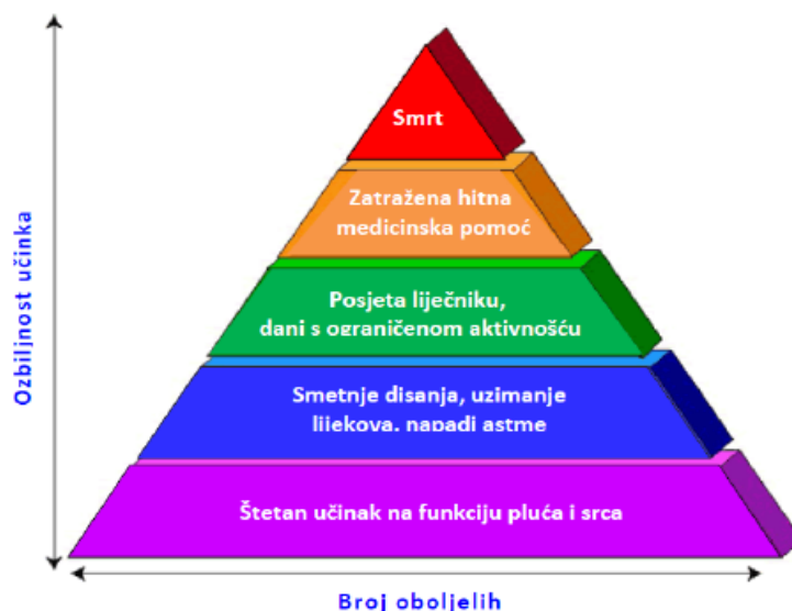
Slika 2. Zastupljenost učinaka onečišćenosti zraka na zdravlje ljudi (1)

2 prikazana je piramida učinaka onečišćenosti zraka na zdravlje ljudi (1).