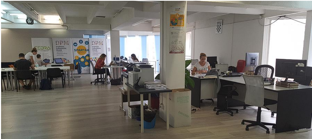
Slika 6. Atmosfera coworking prostor za digitalne nomade