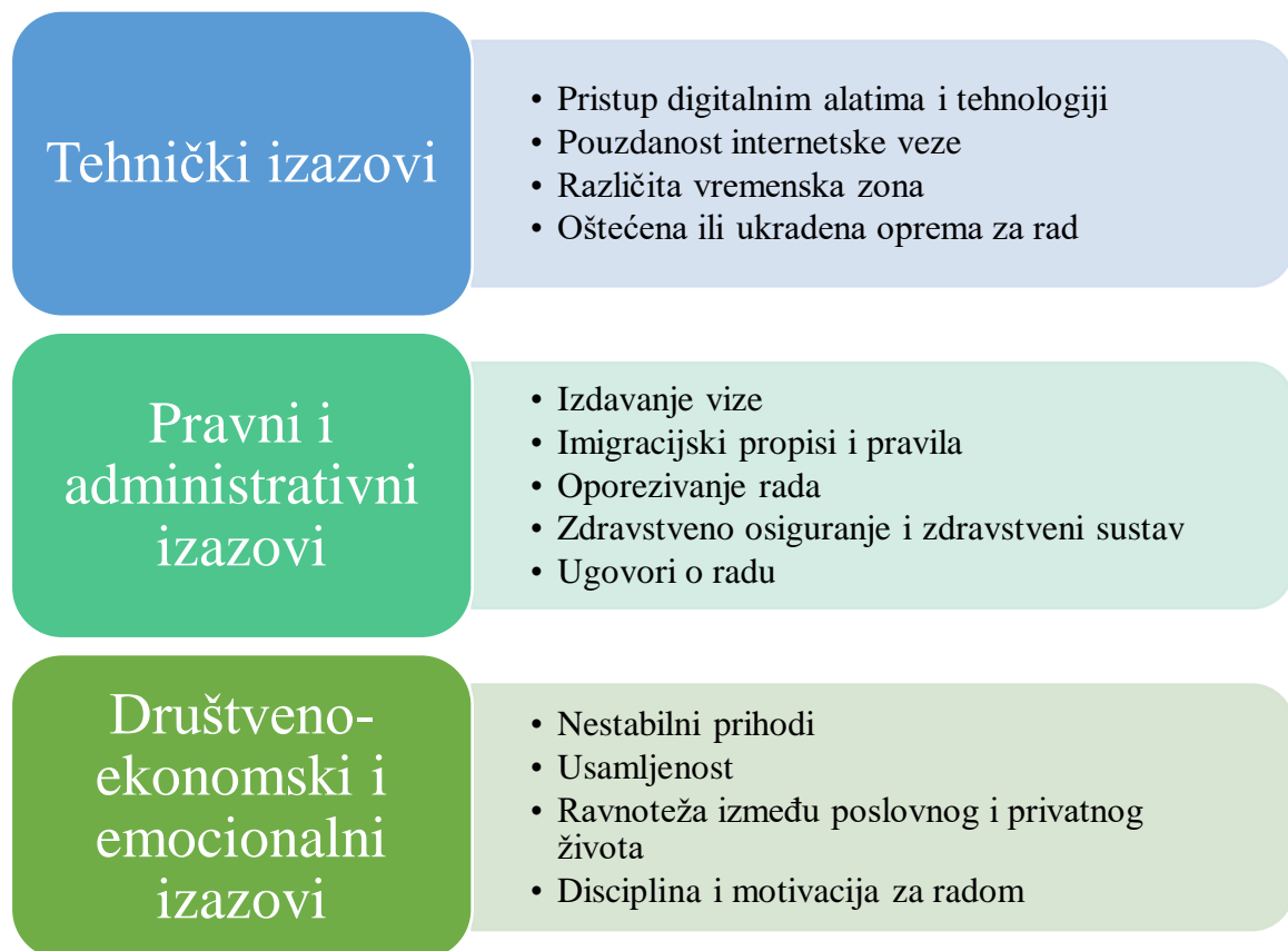
Slika 4. Izazovi digitalnog nomadstva