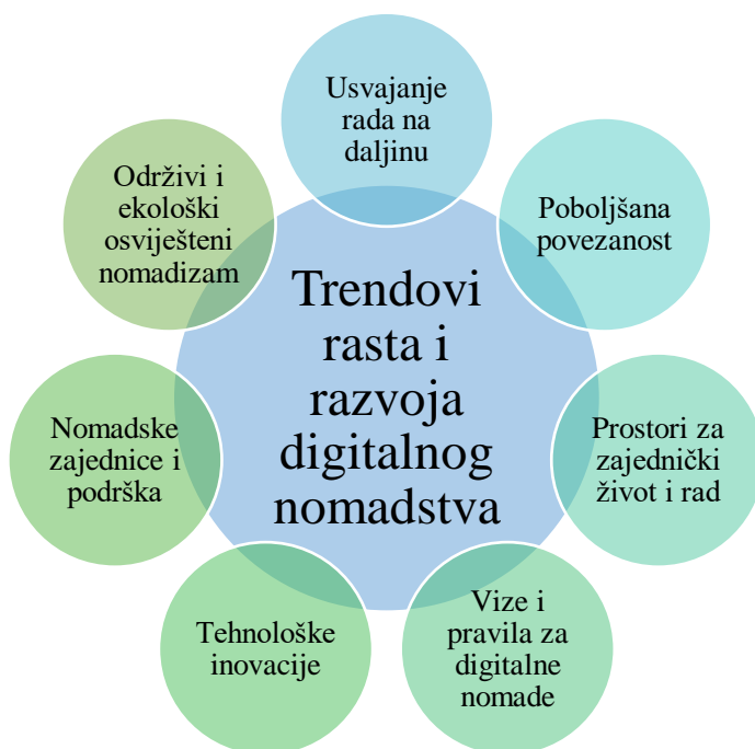
Slika 5. Trendovi rasta i razvoja digitalnog nomadstva