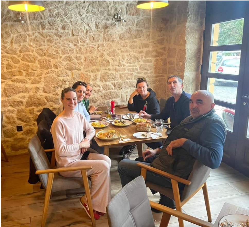
Slika br. 2. Obitelj na okupu uz specijalitete Hercegovine

U prethodnom dijelu rada govorili smo o gastronomiji i značaju gastro turizma za naše krajeve. Tema ovog poglavlja je također kompleksna ali s druge strane u jednu ruku je i škrta. Pri tome ne misli se na gastro ponudu već na postojanje hotela kao takvih. Tek određeni gradovi i općine u Hercegovini imaju hotelski smještaj (u pravom smislu te riječi op. a.). Stoga je odluka pala na zadržavanje priče u gradu Čapljini. Naravno, Čapljina također ne obiluje hotelima, sve do prije dvije godine čak nije imala niti jedan pravi hotel (stari hotel "Mogorjelo" nažalost je bio ugašen op. a.). Danas postoji uspješan hotel "President" čiju ćemo gastro ponudu predstaviti u daljnjem dijelu poglavlja. Pored navedenog hotela, odlučeno je predstaviti gastro ponudu iz još dva objekta iz našeg grada te poznatu vinsku kuću iz obližnjeg Čitluka. Izabrali smo dva predstavnika iz reda restorana i konoba, riječ je o restoranu sa višedesetljetnom tradicijom "San Marino" i konobi "Hercegovac" te podrumima "Andrija".