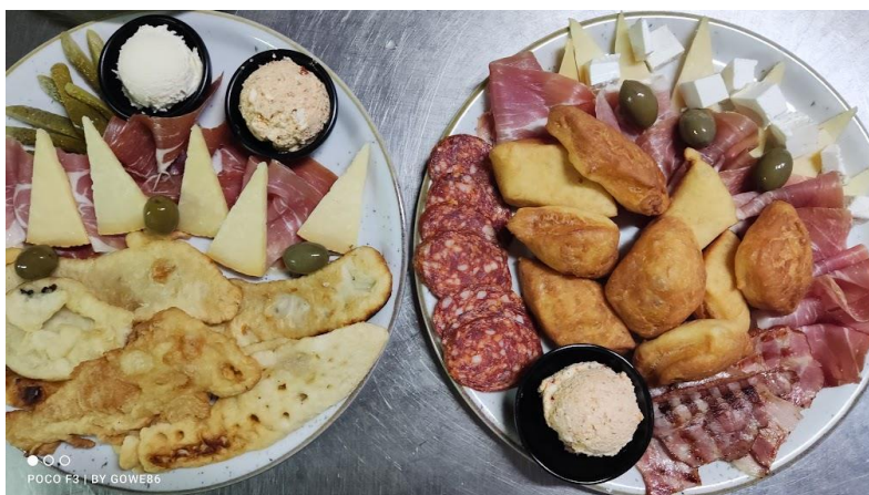
Slika br. 5. Simbol Hercegovine – uštipci i sir sa mesnim prilogom