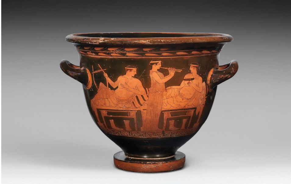
Slika br. 1. Prikaz kratera iz stare Grčke za miješanje vina i vode (preuzeto iz: POLAČEK GAJER, J., Grčka gastronomska poezija: Ἡδονήθηα Arhestrata iz Gele , Latina et Greaca, vol. 2, 37, 2020. str. 33.)

Dubrovniku i gradovima današnje Italije) mora se gledati kao (pokušaj) povratka na mirnije ili prosperitetnije vrijeme. 26