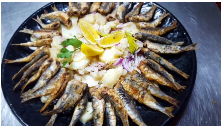
Slika br. 4. Riblji specijaliteti na hercegovački način