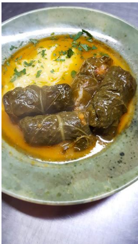
Slika br. 6. Svježe napravljeni japrak sa dnevne ponude (foto: Karla Vego 7.1.2023.)