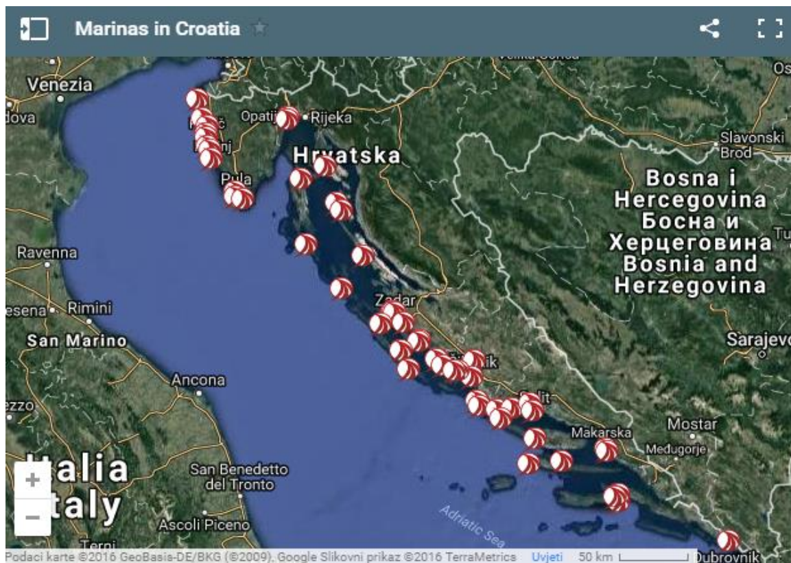
Slika 12. Marine na hrvatskoj obali