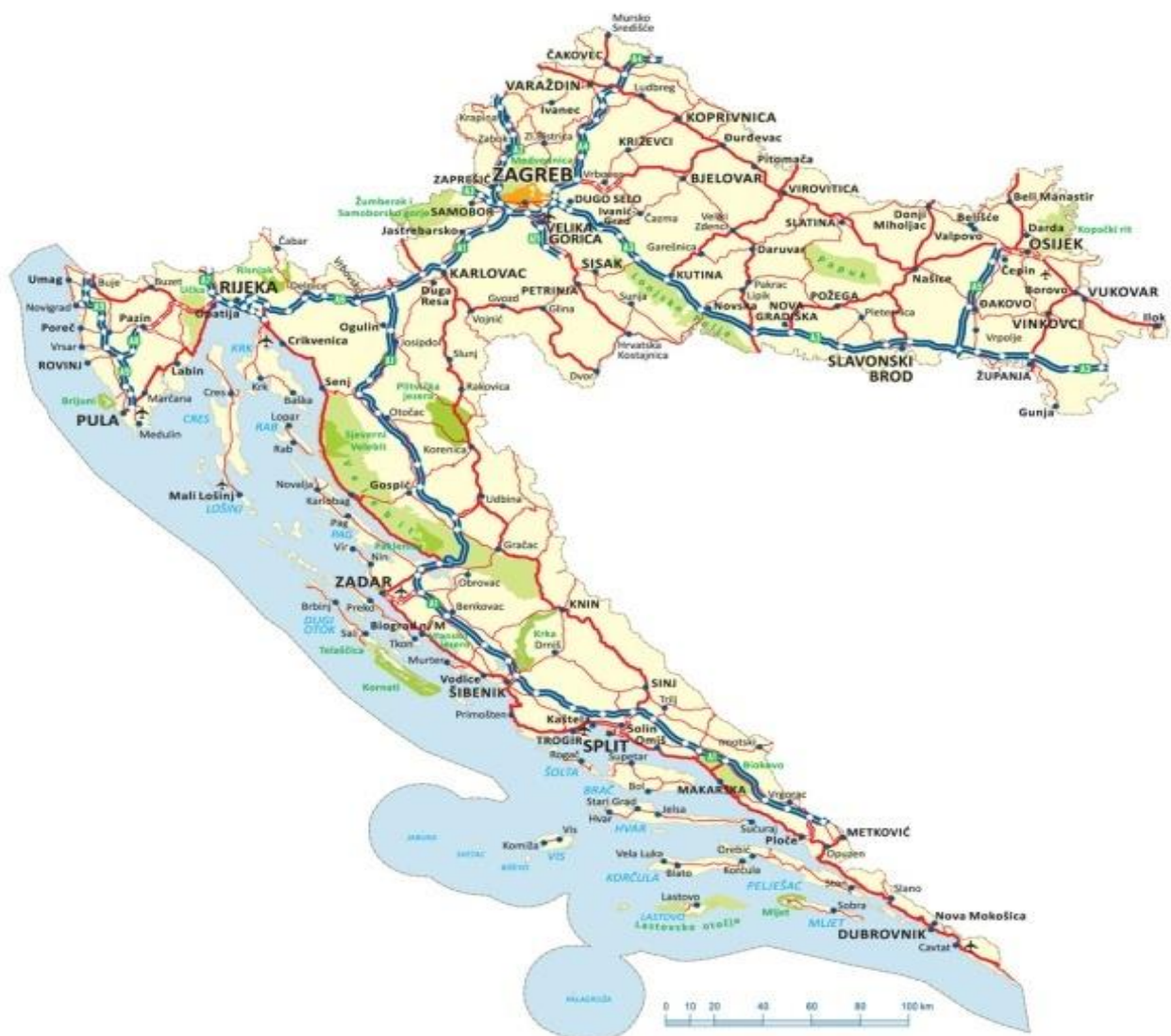
Slika 1. Karta Republike Hrvatske