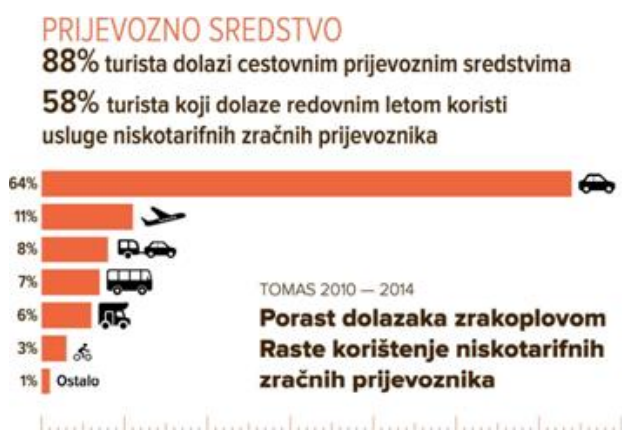
Slika 7. Prijevozna sredstava