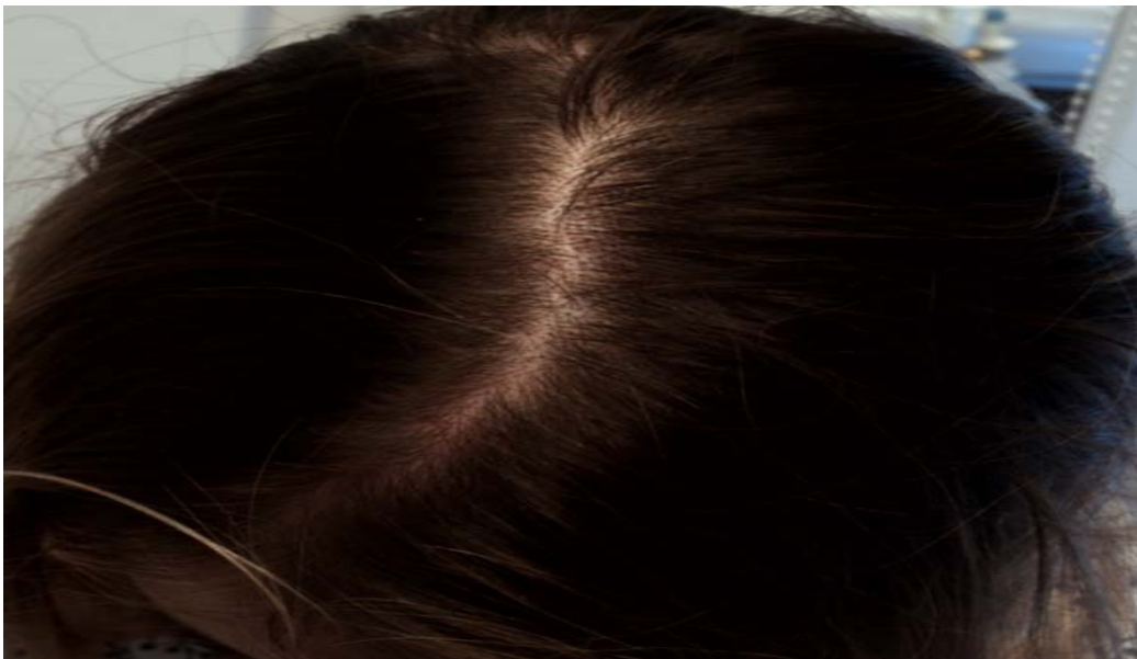
Slika 2A. Akutni telogeni efluvij. Klinički se vidi prorijeđeno vlasište.

Telogeni efluvij je neupalna akutna ili kronična alopecija koja obično zahvaća cijelo vlasište u oba spola djece, adolescenata i odraslih. Poremećaj prijelaza iz anagene faze u telogenu fazu može biti posljedica psihološkog stresa, akutne ili kronične bolesti, trudnoće ili nakon poroda, pothranjenosti odnosno metaboličkih razloga, sistemskih bakterijskih ili virusnih infekcija, kirurškog zahvata i lijekova, kao što su antikonvulzivi, antidepresivi, antikoagulansi, oralna hormonska kontracepcija i retinoidi. Telogeni efluvij nastaje približno tri tjedna nakon okidačkog događaja, obično je samoograničavajući i traje oko četiri do šest mjeseci (13).