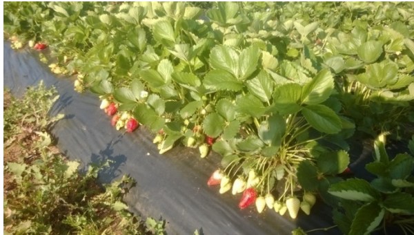
Slika 2. Uzgoj jagode na crnoj polietilenskoj foliji

Prije postavljanja folije zemljište je potrebno dobro pognojiti, a potom naorati. Zemljište se može prekrivati folijom ručno ili pomoću uređaja koji se postavi na traktor. Polaganje folije pomoću traktora je brže i folija bolje prianja uz tlo. Ovakav način postavljanja je puno jeftiniji od ručnog. Da foliju ne bi podizao vjetar, treba je sa svih strana dobro pričvrstiti za tlo. Krajevi se vezuju za kočić zabijen u tlo na kraju reda, a bočne strane folije se ukopaju u tlo čitavom dužinom na 6 do 8 cm dubine. Jagoda se na foliji sadi od sredine srpnja do kraja rujna. Njega jagode na crnoj foliji sastoji se od prihranjivanja preko lišća, zaštite od bolesti i štetočina, odstranjivanja vriježa i polijevanja nasada (Šoškić, 2009.; Krpina, 2004.; Volčević, 2008.).