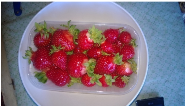
Slika 5. Plodovi sorte Alba

Plod: Krupan i ujednačen, vrlo pravilnog izduženo-koničnog oblika, sjajne tamnije crvene boje. Meso ploda je crveno, vrlo čvrsto, izvrsnih organoleptičkih karakteristika, vrlo aromatično. Oraščići (ahene) su u razini površine ploda. Čaška je nešto sitnija i lako se odvaja od ploda.