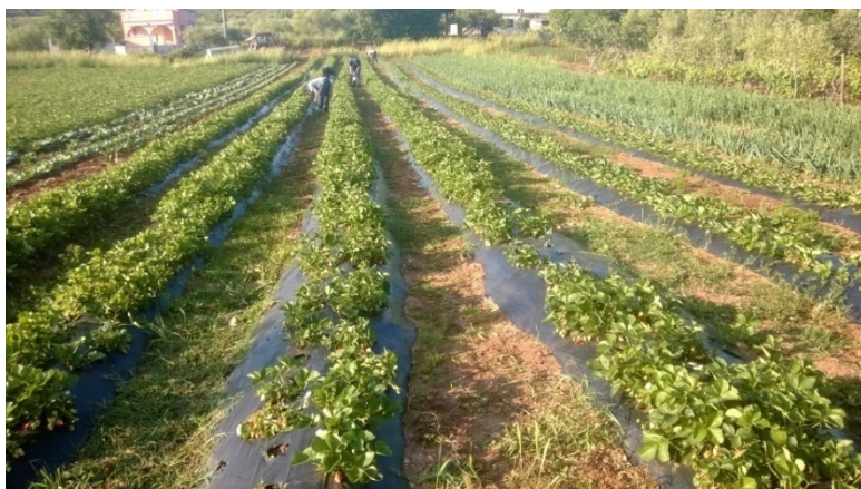
Slika 3. Berba jagode