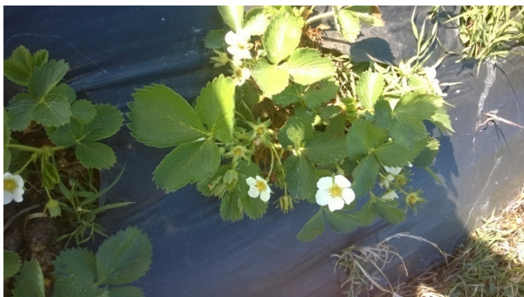
Slika 1. Cvijet jagode

PLOD jagode, kako navodi Mratinić (2012.) nastao je od većeg broja pojedinačnih jednosjemenih plodova oraščića povezanih ispupčenom i mesnatom cvjetnom ložom. Sastoji se od ploda, sjemenki, čašice i peteljke. Autor dalje navodi kako plod jagode može biti različitog oblika i krupnoće, što ovisi o sorti i uvjetima uzgoja. Oblik jagode može biti okrugao, spljošten, valjkast, klinast, sroluk, valjkast, kruškast te nepravilan. Po krupnoći, plodovi se mogu grupirati u: vrlo krupne (mase preko 20 g), krupne (mase od 14-17 g), srednje krupne (mase od 11-14 g) i sitne (mase manje od 11 g).