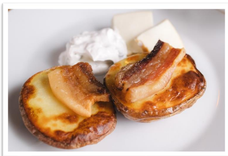
Izvor 7: Vilicom kroz Hrvatsku, 2017.