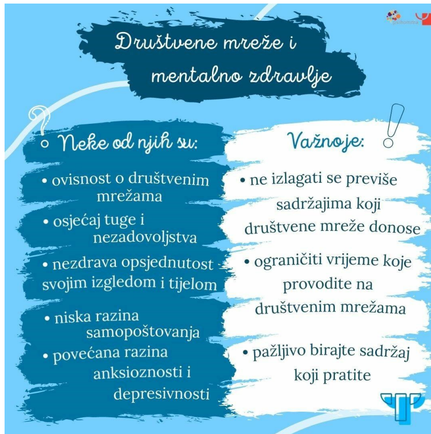
Slika 2. Društvene mreže i mentalno zdravlje

internetskog zlostavljanja, smatrajući ga smiješnim i zabavnim, nesvjesni negativnog utjecaja na žrtvu (14).