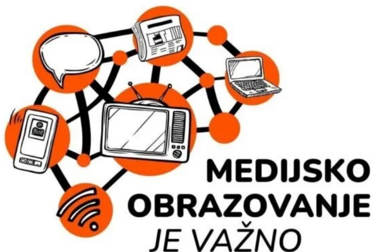
Slika 5. Važnost medijskog obrazovanja

Prevencija ovisnosti zastupljena je u svim skupinama školske djece i mladih. Teme koje se obrađuju tiču se prevencije ovisnosti o pušenju, alkoholu, psihoaktivnim drogama i Internetu, odnosno tehnologijama (43). Već se u prvom razredu osnovne škole započinje s obradom ovog modula, učeći djecu kako da pripreme program osobnog zdravog ponašanja. Djeca već u trećem razredu uče kako ovisnost utječe na zdravlje. Na ovaj način djeca nakon obrađenih cjelina prepoznaju zdrave životne navike i njihove prednosti, ali i uviđaju koliko velik utjecaj medija može biti (43).