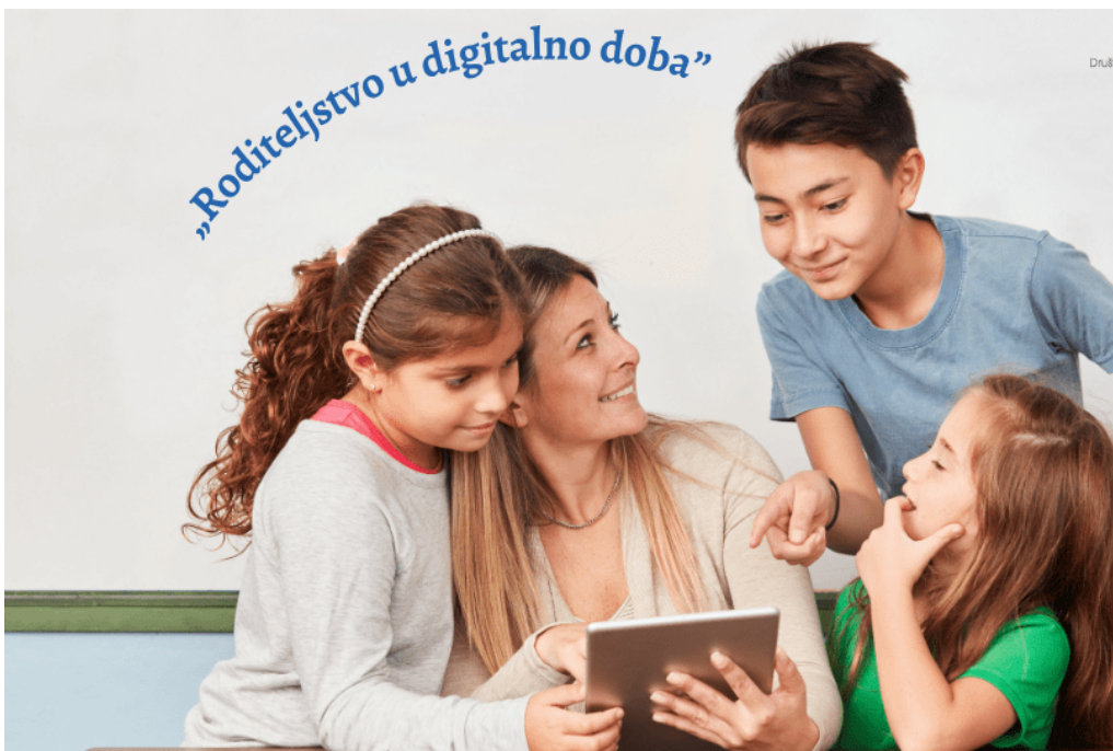
Slika 6. Roditeljstvo u digitalno doba

Roditeljski nadzor i ponašanje u zadnjih je desetak godina dobilo novo područje djelovanja, a dokazano je da rizik od online zlostavljanja može smanjiti roditeljska uključenosti. Skup roditeljskih postupaka kojim roditelji prate aktivnosti djece; zabranjujući određena ponašanja na internetu i uspostavljajući pravila, nazivamo roditeljski nadzor (47).