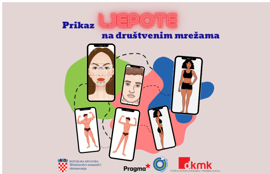
Slika 3. Prikaz ljepote na društvenim mrežama