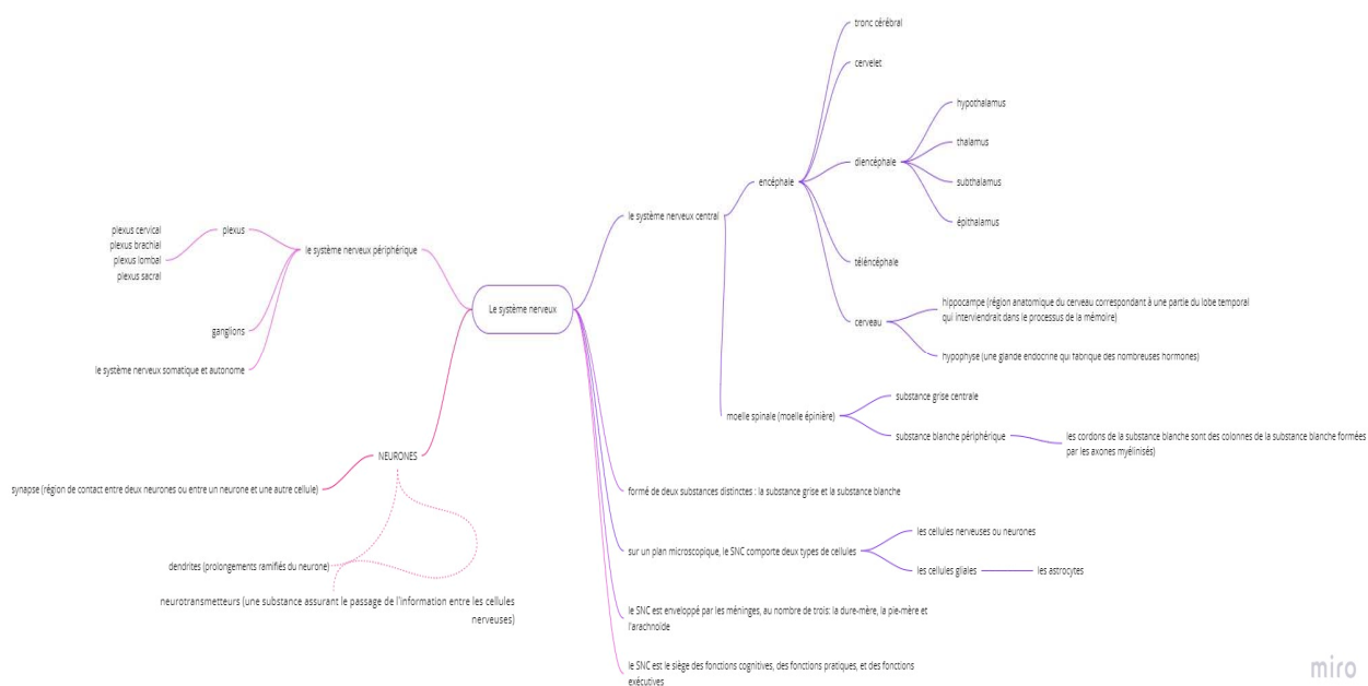
Image 3 L'arbre terminologique