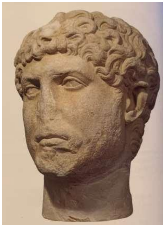
Slika 8 Portret muškarca s bradom, Flanova, treće desetljeće 2. st., Zavičajni muzej Poreštine, Poreč