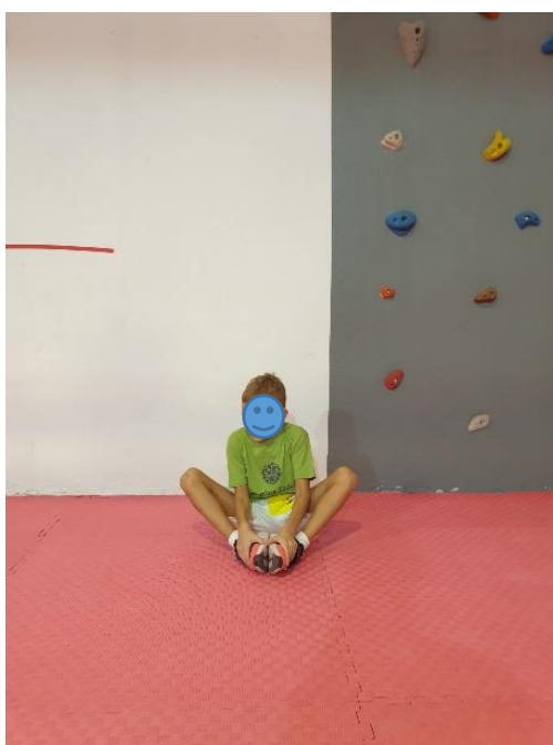
Slika 14. Vježba "Leptir"

UTJECAJ VJEŽBE: jačanje i istežanje mišića nogu