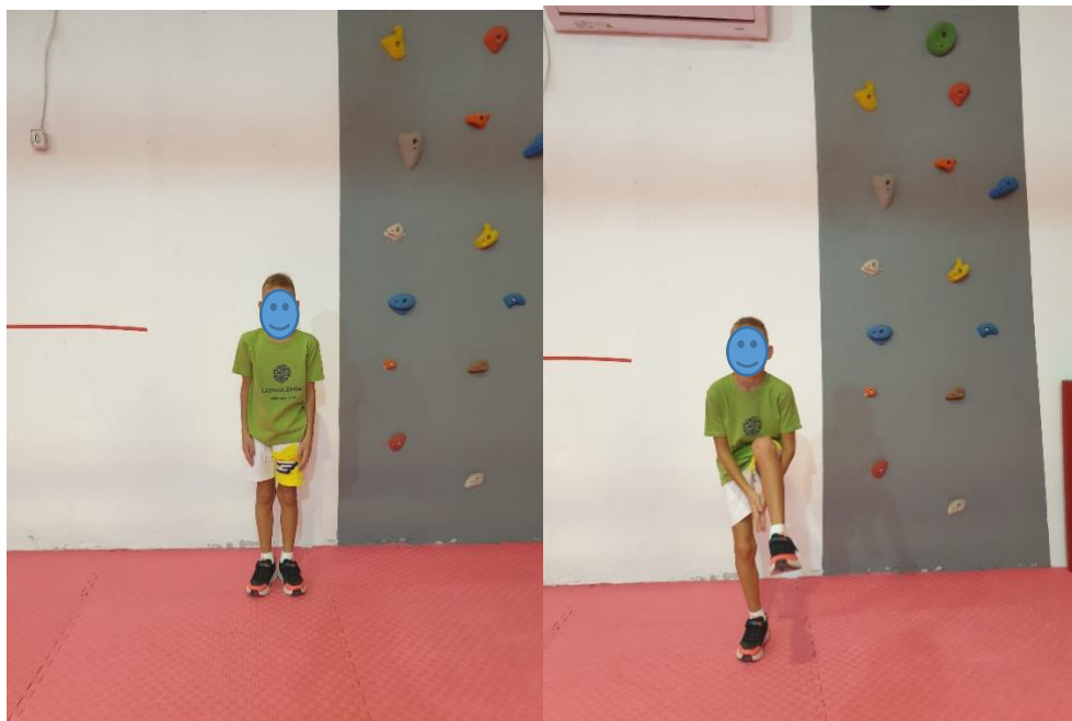
Slika 13. Vježba "Pljesak ispod noge"

UTJECAJ VJEŽBE: jačanje mišića cijelog tijela