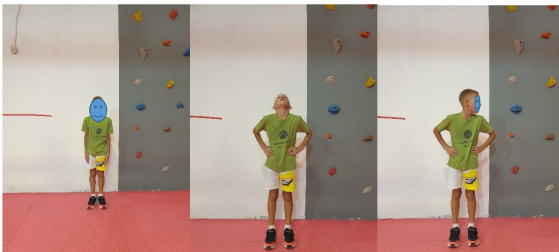
Slika 9. Vježba "Da-ne"

UTJECAJ VJEŽBE: jačanje i istežanje vratnih mišića