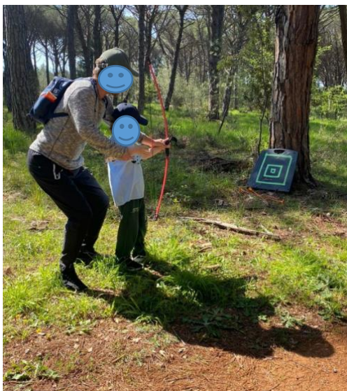
Slika 2. Tjelesno vježbanje s roditeljima u prirodi

trčanje gdje djeca sa svojim roditeljima obavljaju zadatke od starta sve do cilja na kojemu ih čeka diploma i voće.