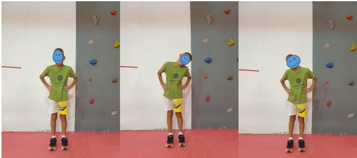
Slika 10. Vježba "Tik-tak"

UTJECAJ VJEŽBE: razgibavanje vrata i vratnih mišića