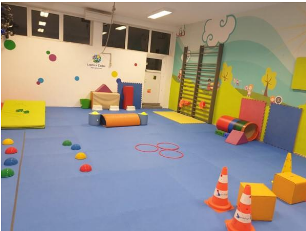
Slika 7. Primjer poligona gimnastike

U nogometu uz napisanu temu izvode i vođenje lopte između prepreka i pucanje petom u gol. Ukoliko se primijeti otežano ili krivo izvođenje vježbi, napravi se pauza u kojoj trener ponavlja zadatak usmeno te ga i demonstrira. Cijelo vrijeme motivirati, naglasiti ako netko radi dobro ili ako je nekome potrebno više vremena posvetiti se tom djetetu duže. Aerobik većina djece voli, no postoje neki (često su to dečki) koji ne vole ples, stoga se treba prilagoditi njima te maksimalno pojednostaviti i što je najvažnije učiniti ovaj sport zabavnim. Na prvom treningu radi se bez rekvizita, a sljedeći se koriste štapići i step aerobik. Ovdje je važno prepoznati umor djece te znati kad sniziti intenzitet ili stati. Kod vježbi za stopala djeci je najzabavnije jer su bosa i osjećaju se slobodnijima. Vježbe su napravljene tako da su odmah jedna do druge, a sastoje se od raznih materijala tj. podloga koja će djeci stimulirati stopala. U manjini su djeca koja ne žele skinuti tenisice te treniraju u njima što treba prihvatiti i motivirati ih.