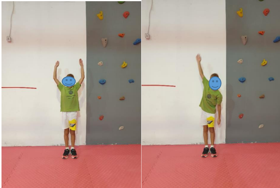
Slika 11. Vježba "Plivanje" (vlastita arhiva)