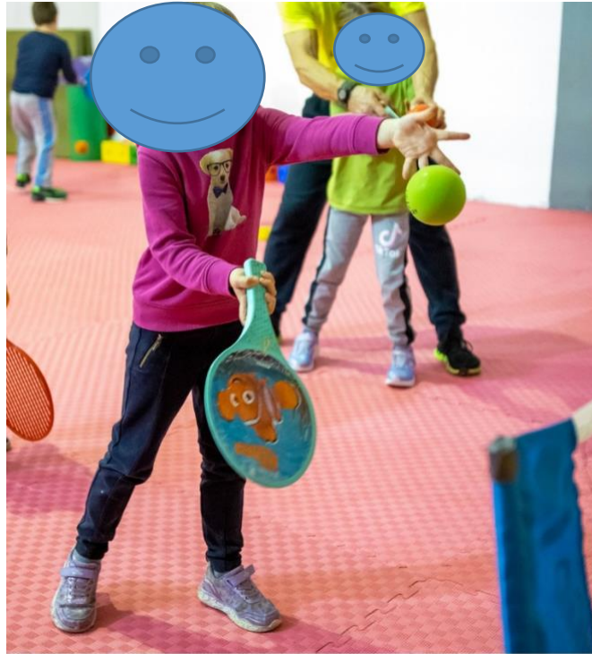
Slika 8. Tenis

Tenis se izvodi na početku vrlo jednostavno, učenje držanje reketa te vođenje loptice po podu ili nošenje loptice na reketu po određenoj duljini. Do ožujka mnoga djeca savladaju osnove pa onda stavimo i mrežu preko koje djeca uče prebacivati lopticu. U atletici djeca uče pravilne tehnike trčanja, ali i ostale atletske discipline poput skakanja u dalj. Upoznaju pojmove poput niski i visoki skip te ih izvode.