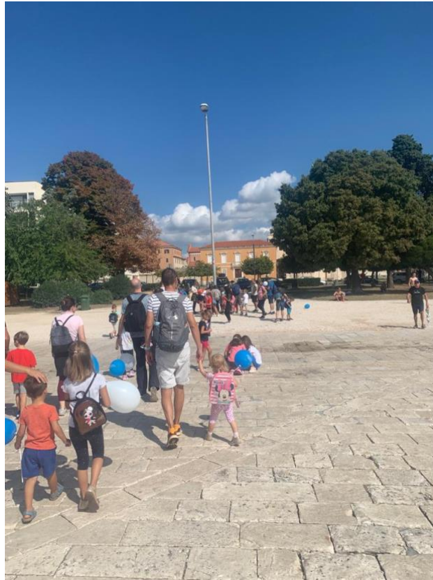
Slika 3. Šetnja s djecom i roditeljima