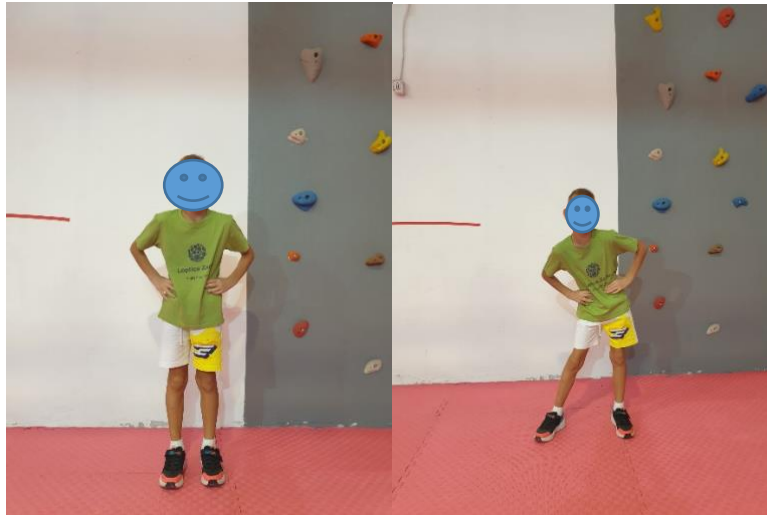
Slika 12. Vježba "Mikser"