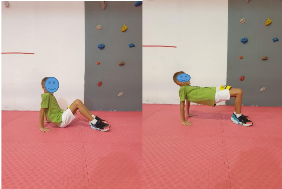
Slika 15. Vježba "Stolić"