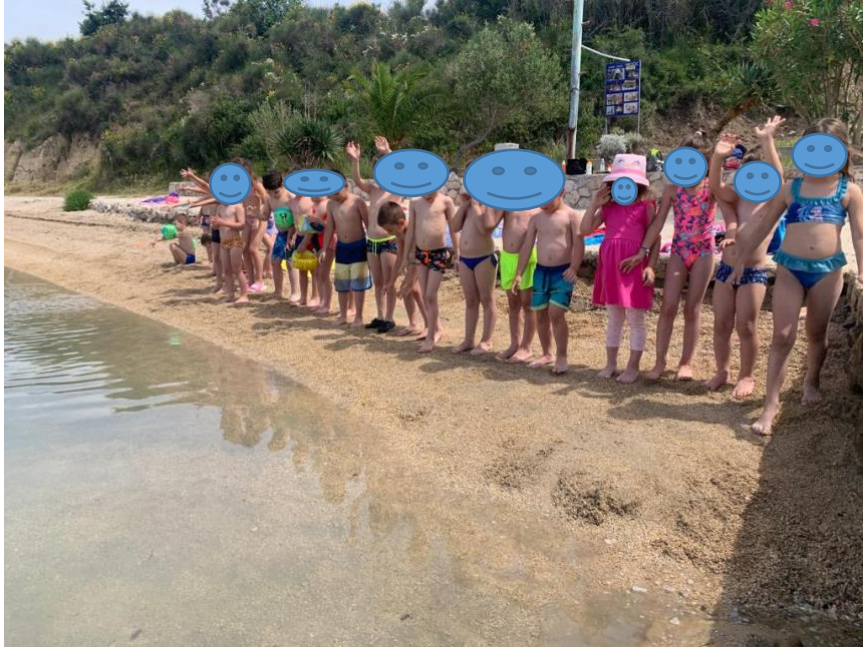
Slika 4. Ljetni kamp s „Lopticom“