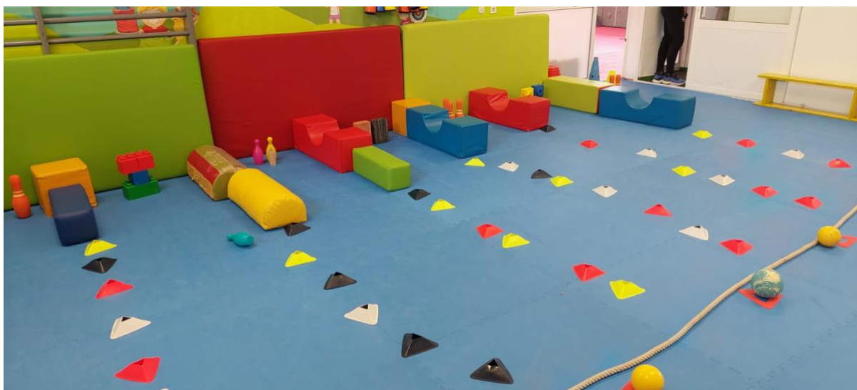
Slika 6. Primjer treninga na temu kuglanja

U gimnastici je glavna vježba, kao i što je u samoj tablici zapisana tema, kolut naprijed niz kosinu. Kosina se primjenjuje zbog potencijalne energije te kako bi sportaš imao više zamaha. Kod izvođenja koluta voditelj tj. trener mora cijelo vrijeme asistirati kako se ne bi dogodila ozljeda i kako se djetetu ne bi stvorio strah od izvođenja ove vježbe. Glavne točke kod koluta naprijed su sljedeće: glavu spuštamo dolje na prsa te ih brada cijelo vrijeme mora dodirivati, ukoliko se brada ne stavi na prsa, tijelo ne može izvesti vježbu jer nema oblik kuglice.