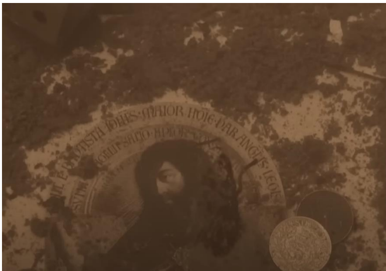
Slika 4. Stalker 1:26

Druga kategorija vode, ona koja poplavljuje unutarnje prostore, ukazuje kako priroda, odnosno Zona preuzima prostore kojima su jednom vladali ljudi. Promatrajući poplavljene pločice (Slika 4.), ikonu ili druge predmete pod vodom, kao i poplavljenu zgradu u kojoj je Soba, stječe se dojam kako takav prostor sugerira ideju gubitka kontrole ljudi nad prostorom Zone te prikazuje krhkost ljudskih tvorevina u usporedbi sa silom Zone. Voda u romanu puno je rjeđi motiv. Na skici Zone (Slika 1.) vidljivo je kako vodene mase na zauzimaju njezin veliki dio. U romanu se spominje jarak u kojem je Sliznjak poginuo (27) te smrdljiva močvara kroz koju prolaze Red i Artur na putu do Zlatnog balona (203) u kojoj nema nikakvog života, a Red naglašava kako se „čak i tužna vrba tu osušila i istrunula“ (219). S obzirom na to da je u jarku Sliznjak poginuo, a da močvara guta Artura do koljena, čini se kako se o vodi u romanu opet može razmišljati kroz prizmu opasnosti koju spominje McAndrew, odnosno, posjetitelji Zone sigurniji su na suhom nego li u vodi. Međutim, močvara dobiva i dimenziju sigurnosti kada na svom putu do Zlatnog balona Red i Artur upadnu u zamku koja ih ispeče jer Artur olakšanje od opekotina pronalazi u hladnoći smrdljive ustajale vode (226).