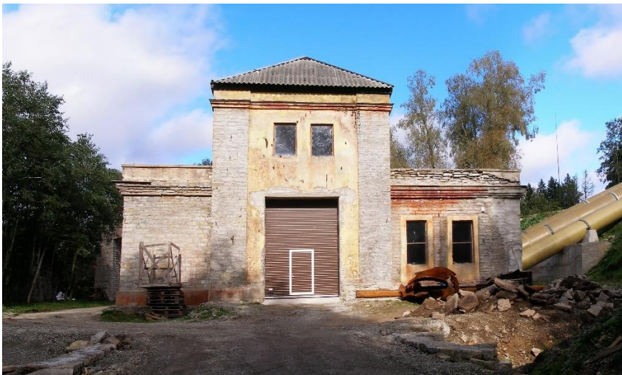
Slika 7. Jägala

Kada bi se prostor Zone u filmu promatrao potpuno neovisno od radnje, odnosno svega onoga što se može saznati o prostoru kroz dijaloge, i kada bi se izostavili filmski elementi poput izmjenjivanja boja, specifičnih kadrova i kutova snimanja, došlo bi se do bitno drugačijih zaključaka. U filmu su prikazane napuštene urušene građevine, šine, prostor postrojenja s bunkerima, cijevi, šuma, drveće, cvijeće, rijeka i, iako bi izostanak ljudi u tom prostoru možda stvorio osjećaj nesigurnosti ili otuđenosti, Zona se ipak ne bi doimala opasnom kada bismo zanemarili sve filmske elemente i radnju. To se može potkrijepiti promatranjem Slike 6. na kojoj je prikazana zatvorena hidroelektrana Jägala-Joa u Estoniji, lokacija na kojoj je sniman dio filma Stalker . Takav prostor sam po sebi ne nosi ništa zastrašujuće, a iako je napušten, doima se vrlo obično, eventualno otužno. Radnja nije jedino što prostor u filmu razlikuje od prostora u navedenom kadru. U filmu Stalker vješto su birani kutovi snimanja kako bi Zona bila pomalo mistična, gledatelj često vidi samo fragment prostora u krupnom planu te je relativno malo kadrova snimljeno u općem planu. Povrh toga, u filmu su boje vrlo jednolične čak i u dijelovima filma koji su u boji, a ne u sepiji. Sve boje su veoma tamne i ne postoji ništa jarkih boja, na primjer trava nije jarko zelena već je otužno zelenkasto-smeđa, a rijeka se čini više sivom nego plavom.