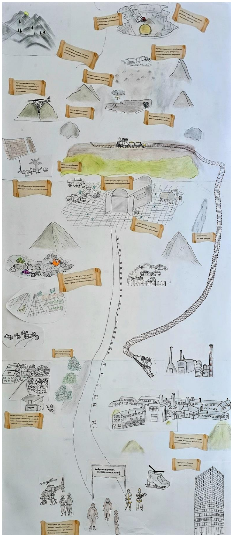
Slika 1. Skica Zone iz romana Izlet pored puta