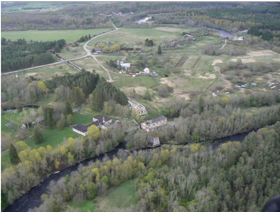
Slika 6. Hidroelektrana Jägala-Joa

Razmišljajući o Tuanovoj tezi da ljudi prostor doživljavaju ne samo pomoću vida, već pomoću svih osjetila, moglo bi se doći do zaključka kako je i olfaktivni doživljaj Zone neugodan. U filmu protagonisti spominju kako se osjeća smrad rijeke, zatim kako cvijeće ne miriše jer ga je Dikobraz uništio, dok se u romanu pak spominje kako močvara smrdi „mokrom hrđavošću“ (203), ali se ni u jednom ne spominje da nešto u samoj Zoni miriše ugodno. Svi ti mirisi povezuju se sa svojevrsnim uništenjem – raspadanjem i truleži, što asocira na prolaznost, a prolaznost na smrt. Sve to pridonosi stvaranju neugodne atmosfere koja pobuđuje strah od prolaznosti. U filmu se u Zoni nalazi cvijeće, drveće i rijeka, a u romanu se spominju planine, ali, iako se takvi predjeli obično povezuju s ugodnim mirisima i čistim zrakom, čini se kako je jedini miris Zone smrad. To dodatno doprinosi percepciji Zone kao neugodnog mjesta jer ona ne samo da izgleda strašno već i loše miriše. U romanu se to dodatno naglašava zato što kao kontrast smradu u Zoni postoje ugodni mirisi u Harmontu, na primjer kada Redrik prolazi pored pekare „preplavi [ga] val toplog, neobično ukusnog mirisa“ (100).