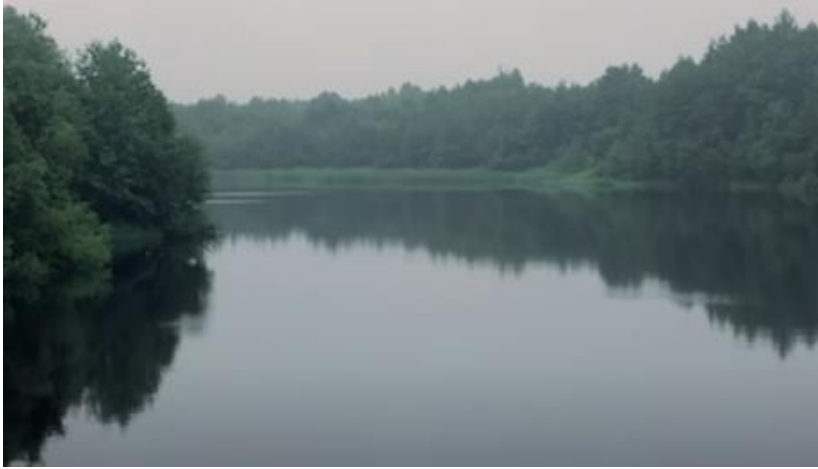
Slika 3. Stalker 1:30

Voda u prostoru Zone bi se mogla podijeliti u dvije kategorije: voda u prirodi (rijeka i vodopadi) i voda u poplavljenim građevinama Zone. Te dvije kategorije imaju različite vrijednosti.