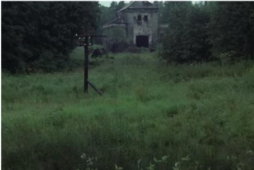
Slika 8. Stalker 0:44

Koliki je doista utjecaj boje na prikaz prostora veoma je očito na dvjema fotografijama građevine s početka filma. Slika 7. jednostavno je fotografija lokacije na kojoj je sniman film, a na Slici 8. je kadar filma. Iako se isto mjesto nalazi na objema slikama, one ostavljaju sasvim drugačiji dojam na promatrača zbog razlike u boji. Na Slici 7. boje nisu dorađene dok je na Slici 8. prostor značajno potamnjen, stoga se građevina u filmu doima puno turobnijom nego što to ona u stvarnosti jest. Kada se kadriranju i poigravanju bojama nadoda još i Stalkerova izjava: