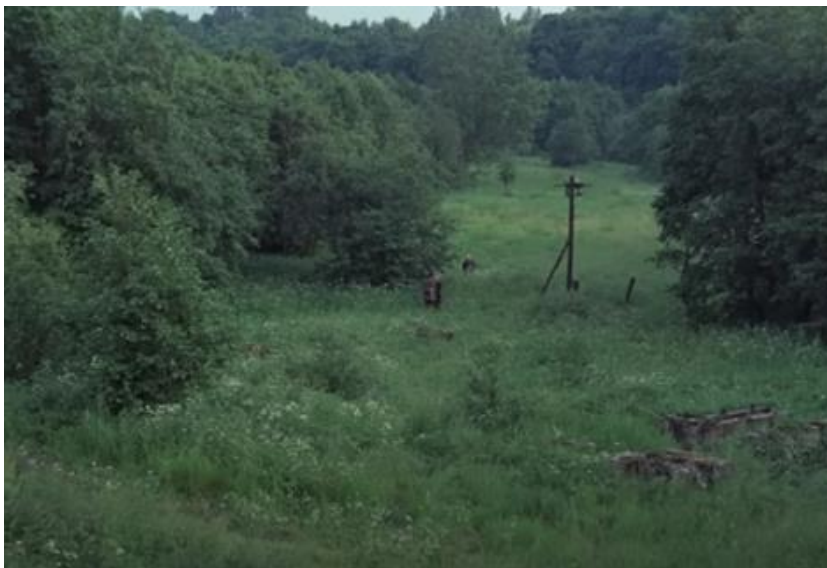
Slika 2. Stalker 0:53

Osjećaj beskrajna Zone u Stalkeru pojačava i njezino kontrastiranje s uskim prostorom objekta kroz koji prolaze glavni likovi na putu do Zone, a koji zbog ograničenosti i ispunjenosti vodom potiče klaustrofobiju. Čini se kako se Tarkovski poigrava s različitim konceptima dimenzija koji bi u promatraču mogli izazvati uznemirenost kako bi Zonu oslikao kao odbojan prostor. U romanu postoje jasni opisi kretanja, na primjer pri prvom prikazanom ulasku u Zonu doznajemo kako se s desne strane nalazi Institut, s lijeve Kužna četvrt, a Red, Tender i Kiril putuju u letećoj kaljači od oznake do oznake sredinom ulice (35). U filmu pak, iako je prikazano kako se Profesor, Pisac i Stalker kreću kroz prostor, zbog presjeka kadrova ne dobiva se jasna ideja smjera, prostora ili razdaljina i sve to dodatno gradi nelagodnu atmosferu.