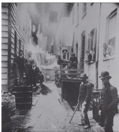
Slika 1. Jacob Riis, Bandit's Roots , 39 ½ Mulberry St., 1887., Museum of the City of New York, (izvor: M. STANGE, 1989., 9.)