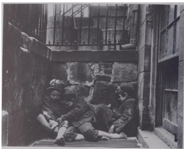
Slika 2. Jacob Riis, Street Arab sin Sleeping Quarters , 1880s., Museum of the City of New York, (izvor: M. STANGE, 1989., 20.)