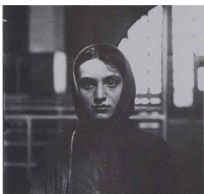
Slika 3. Lewis Hine, Mlada ruska Židovka na otoku Ellis , 1905., International Museum of Photography at George Eastman House, New York