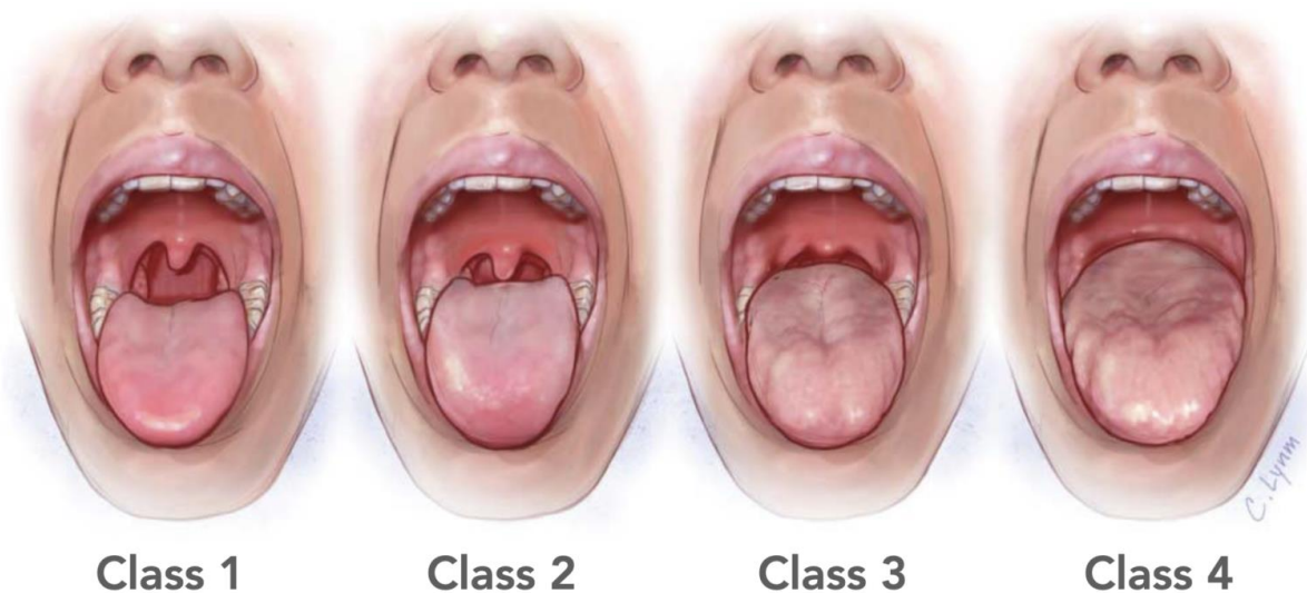
Slika 1. Mallampati klasifikacija vidljivosti orofaringealnih struktura

Prijeoperacijska procjena i pregled dišnog puta obuhvaćaju Mallampati klasifikaciju vidljivosti orofaringealnih struktura. Procjenjuje se vidljivost mekog nepca, uvule i nepčanih lukova kada pacijent otvori usta i ispruži jezik. Ova procjena obuhvaća 4 klase, prva u kojoj su vidljive sve strukture do četvrte u kojoj nije vidljivo niti meko nepce. Treća i četvrta klasa ukazuju na otežani dišni put.