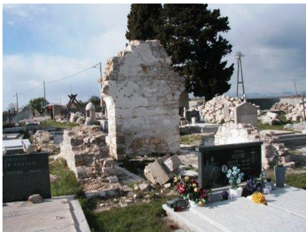
Prilog 8. Ostatci crkve Uznesenja Blažene Djevice Marije, Perušić. Izvor:

http://zupe.zadarskanadbiskupija.hr/?attachment_id=9396