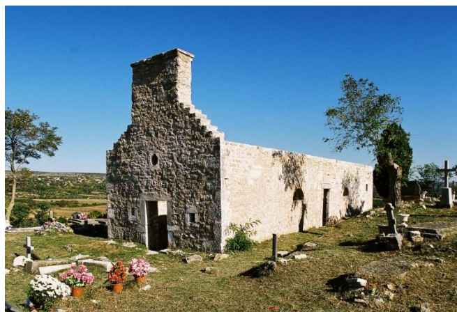
Prilog 16. Crkva Uznesenja Blažene Djevice Marije ("Runjavica" na groblju), Korlat.