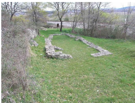
Prilog 6. Arheološki lokalitet Crkvina, Benkovac.