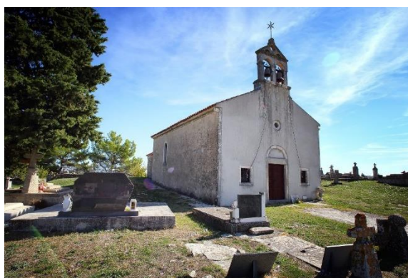
Prilog 12. Crkva sv. Mihovila, Vukšić. Izvor: https://muzej-benkovac.hr/kulturno-povijesna-bastina-benkovackog-kraja