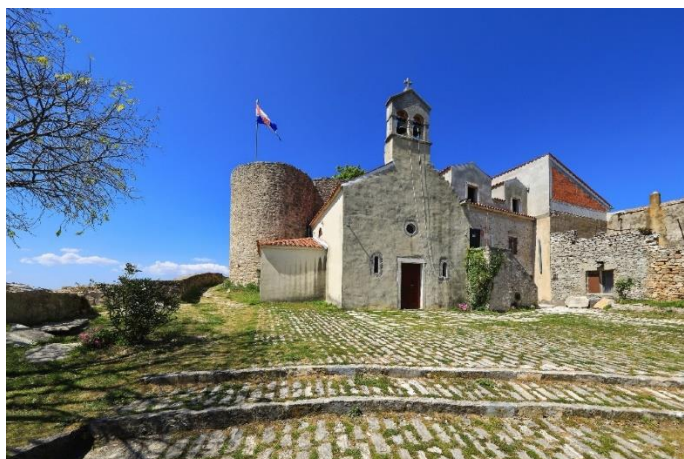
Prilog 3. Crkva sv. Ante, Benkovac.