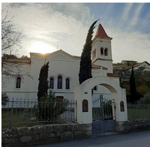
Prilog 26. Crkva sv. Trojice, Obrovac.