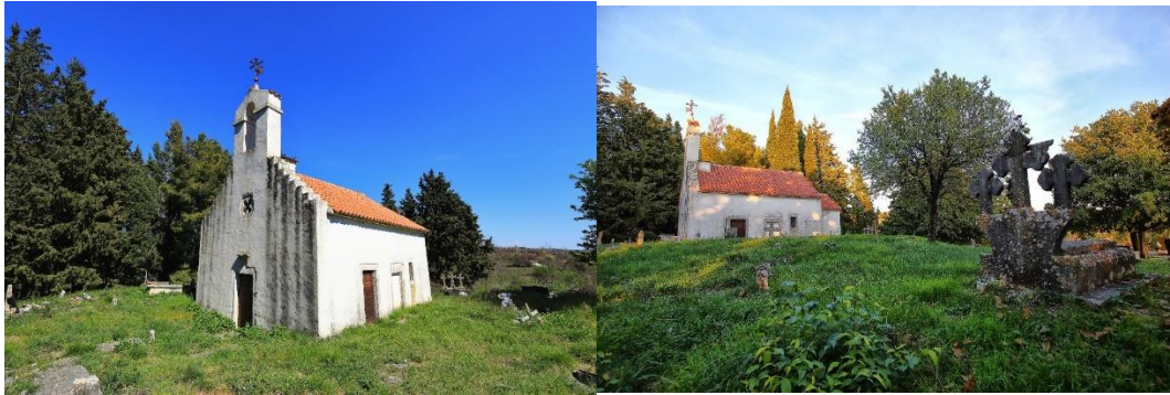
Prilog 13 i 14. Crkva sv. Nikole, Kula Atlagić.