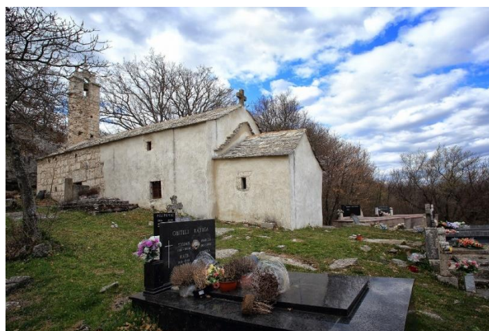
Prilog 23. Crkva sv. Ivana Krstitelja, Medviđa.