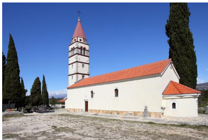
Prilog 20. Crkva sv. Kirika i Julite, Karin Donji.