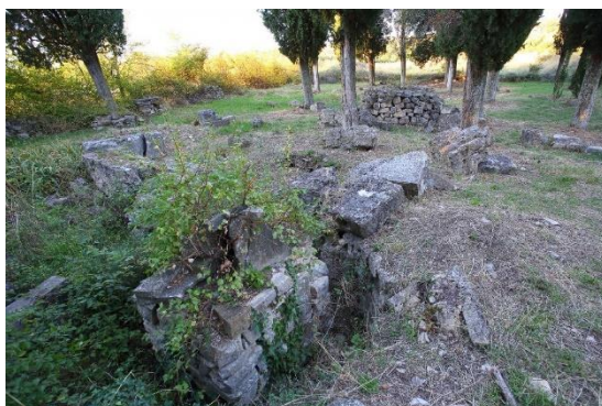
Prilog 17. Crkva sv. Jerolima, Korlat.