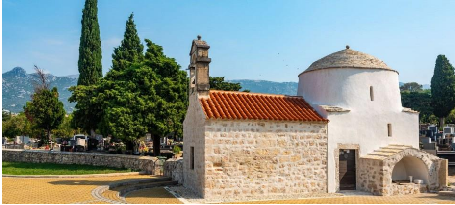
Prilog 35. Crkva sv. Jurja, Rovanjaska.