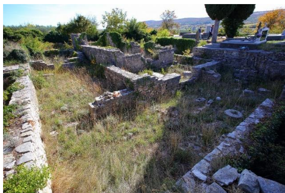
Prilog 24. Ostatci crkve sv. Martina, Lepuri.