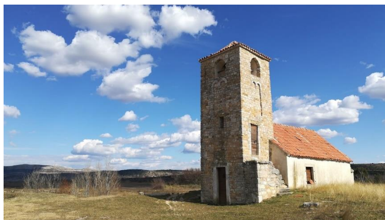
Prilog 40. Crkva sv. Petra, Morpolaca.