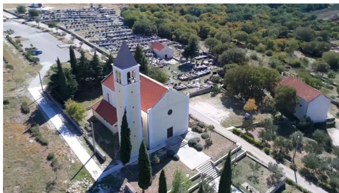
Prilog 29. Crkva sv. Jurja, Kruševo.