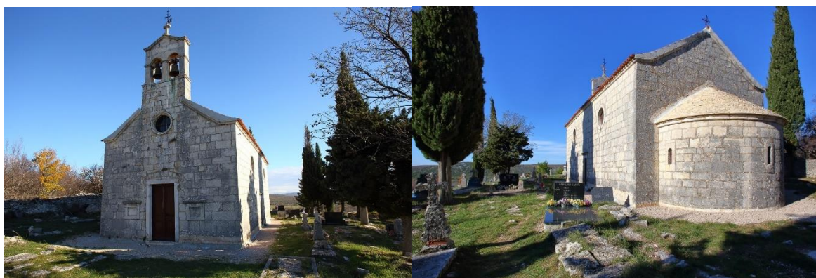
Prilog 21 i 22. Crkva sv. Lazara, Brgud.