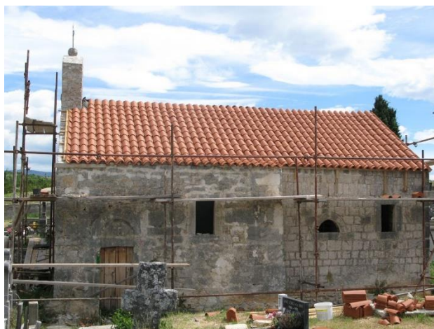
Prilog 29. Crkva sv. Jurja na groblju, Kruševo.