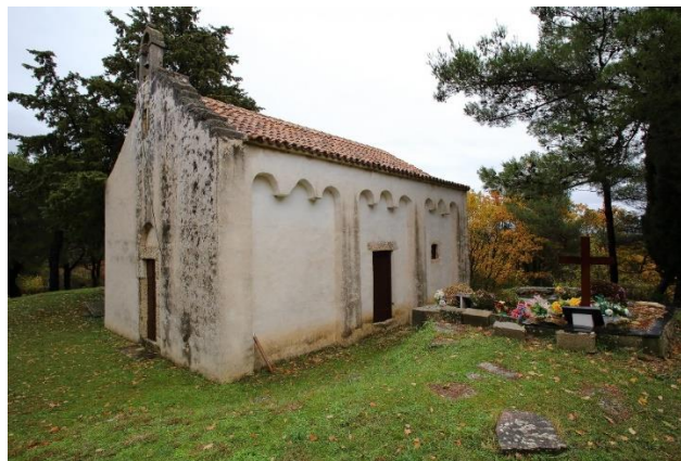
Prilog 15. Crkva sv. Petra, Kula Atlagić.