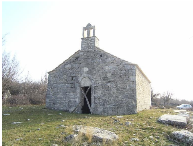
Prilog 36. Crkva sv. Ilije, Parčići.