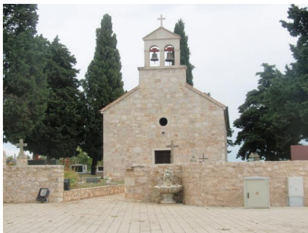
Prilog 38. Crkva sv. Kuzme i Damjana, Polača.