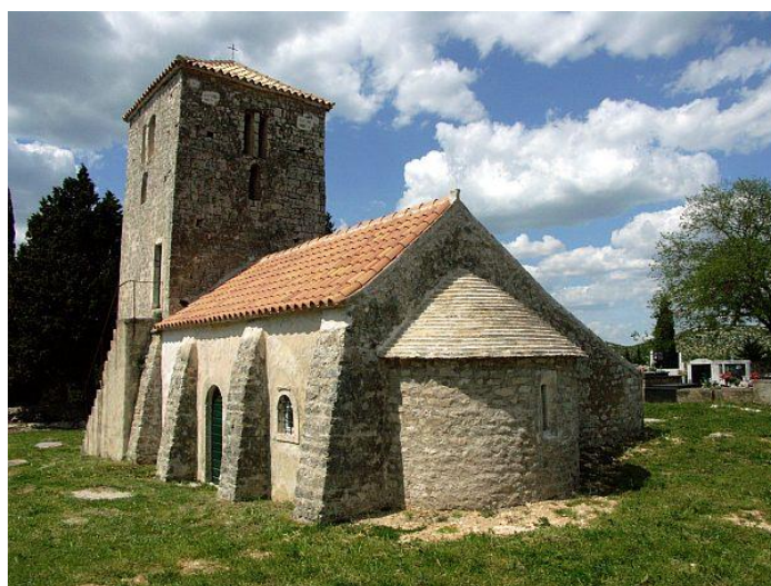
Prilog 39. Crkva sv. Ivana Krstitelja, Banjevci.