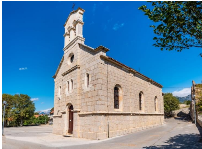
Prilog 33. Crkva sv. Jerolima, Jasenice.