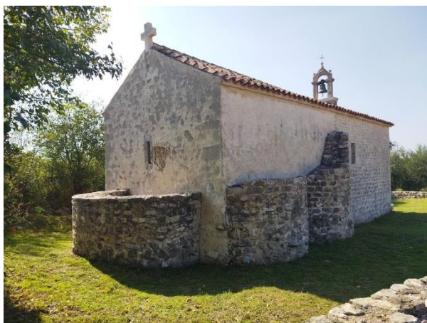
Prilog 42. Crkva sv. Marije, Škabrnja.