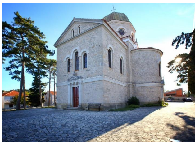
Prilog 4. Crkva sv. Jovana, Benkovac.