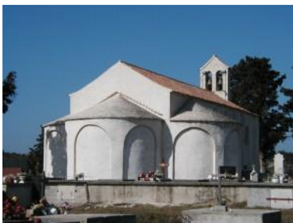
Prilog 43. Crkva sv. Martina, Pridraga.