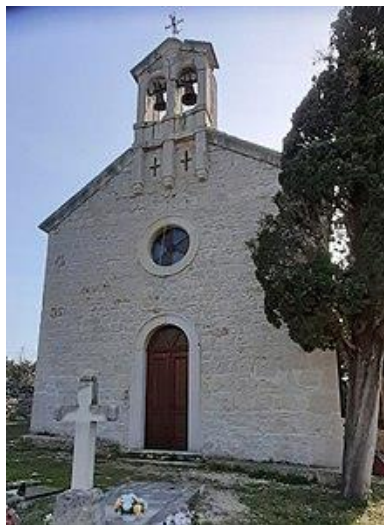
Prilog 37. Crkva sv. Simona Stolpnika, Gornja Jagodnja.