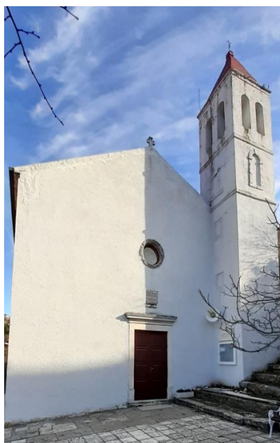
Prilog 25. Crkva sv. Josipa, Obrovac.