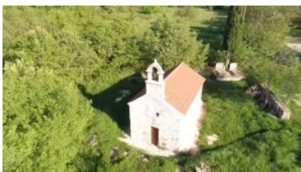
Prilog 28. Crkva sv. Kuzme i Damjana, Kruševo.