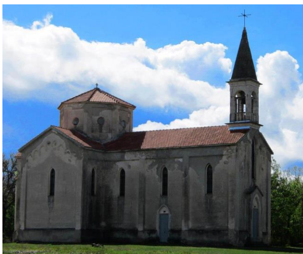
Prilog 30. Crkva Rođenja Bogorodice (Mala Gospojina), Bilišani Gornji.