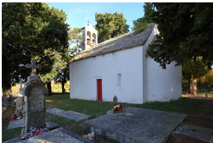
Prilog 9. Crkva sv. Petke, Kolarina.