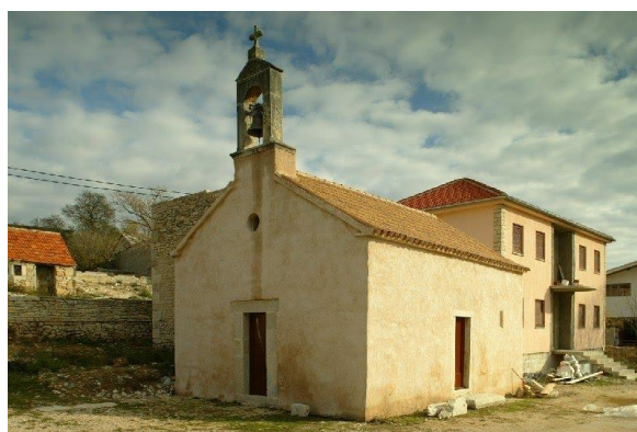
Prilog 7. Crkva sv. Jurja, Perušić.

https://registar.kulturnadobra.hr/#/details/Z-1735