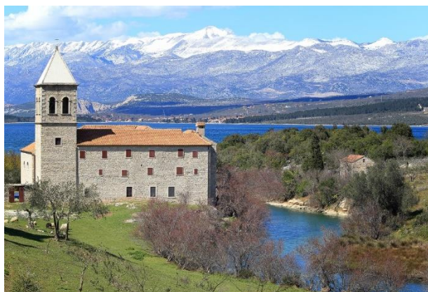
Prilog 19. Franjevački samostan Blažene Djevice Marije, Karin Donji.