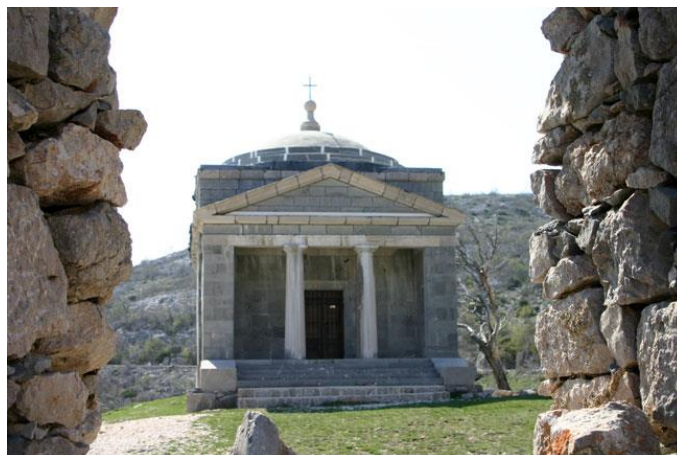
Prilog 34. Crkva sv. Frane, Podrag.