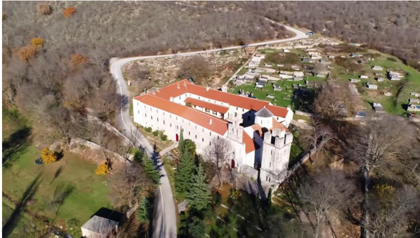
Prilog 32. Manastir Krupa, Krupa.