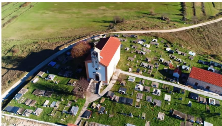
Prilog 27. Crkva sv. Georgija, Obrovac.