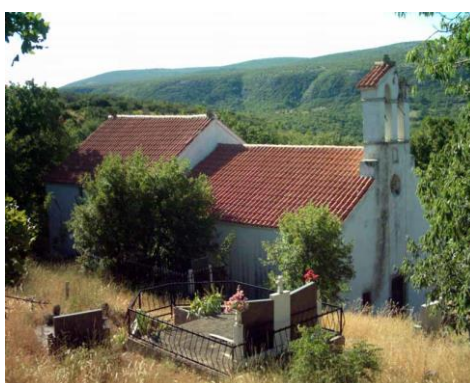
Prilog 31. Crkva sv. Jovana, Bilišani Donji.