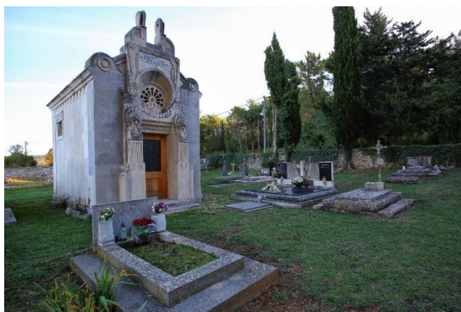
Prilog 5. Mauzolej obitelji Meštrović, Benkovac. Izvor: https://muzej-benkovac.hr/kulturno-povijesna-bastina-benkovackog-kraja

Izvor: https://muzej-benkovac.hr/kulturno-povijesna-bastina-benkovackog-kraja