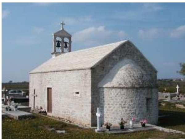
Prilog 41. Crkva sv. Luke na groblju, Škabrnja.