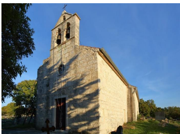
Prilog 18. Crkva sv. Georgija, Gornje Biljane.