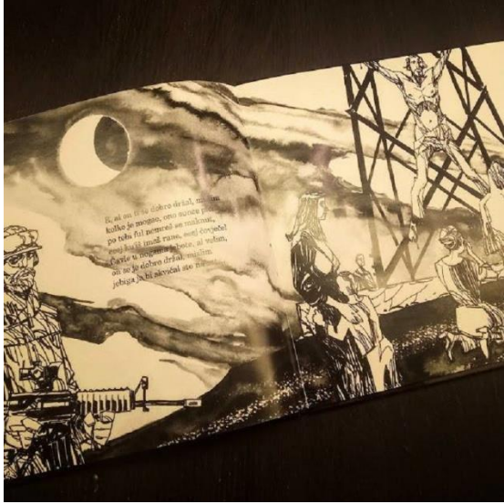
Slika 3. Ilustracija i tekst u slikovnici Superstar (2018.)

Tekst i ilustracije su u svakoj slikovnici vrlo usklađene. Svaka ilustracija prati tekst (primjer Slika 3.), ali i da nema teksta preko ilustracije bi se poanta shvatila, što je rezultat kvalitetne slikovnice. Autori teksta su napisali vrlo jasno što su htjeli reći, pa i one slikovnice s narječjima i pisane u žargonu su jasne i razumljive čitatelju. Sadržaj u slikovnicama je neprimjeren djeci, ali nezačuđujuć obzirom da se radi o slikovnicama za odrasle. Sami podnaslov koji je otisnut na naslovnici svake slikovnice „slikovnica za odrasle“ jasan je signal da ovu knjigu ni po čemu ne bi trebalo ponuditi ili čitati – djeci (Slika 4.).