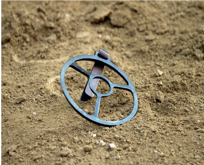
Foto. N. 3. L' anello di alca