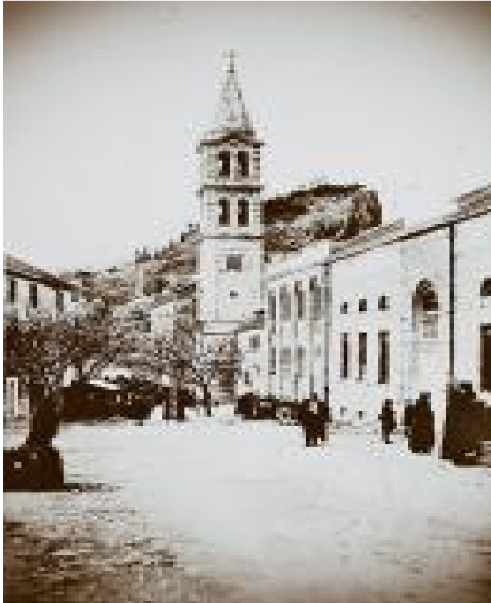
Foto. N. 4. Sign nell'Ottocento