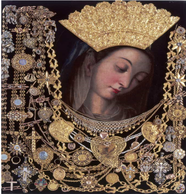
Foto N.1. L'immagine della Miracolosa Madonna di Sign

Una delle immagini più belle dell'arte cristiana e allo stesso tempo il gioiello più bello della città di Sign è l'immagine della Miracolosa Madonna di Sign. Si tratta di un dipinto su tela (58X44) del XVI secolo, opera di un artista ignoto. Alcuni dicono che la città di origine di questa immagine fosse Sign, ma quando i Turchi vennero a Sign, i frati l'hanno portata via, a Rama. Nel 1687, quando i frati fuggirono dall'invasione turca verso la contea di Cetina portarono con sé l'immagine della Madonna. Nel 1691 dopo essersi fermata brevemente a Dugopolje, Clissa e Spalato l'immagine è stata portata a Sign e d'allora non ha mai più lasciato questa città. Dopo la celebre vittoria contro i Turchi del 1715, per merito della Madonna, i soldati di Sign in segno di ringraziamento hanno raccolto 80 zecchini e hanno fatto una corona d'oro con la croce per l'immagine della Madonna. Nel 1716, il 22 settembre l'immagine è stata incoronata e nel 1721 è stata trasferita alla nuova chiesa dove si trova ancor oggi 29 .