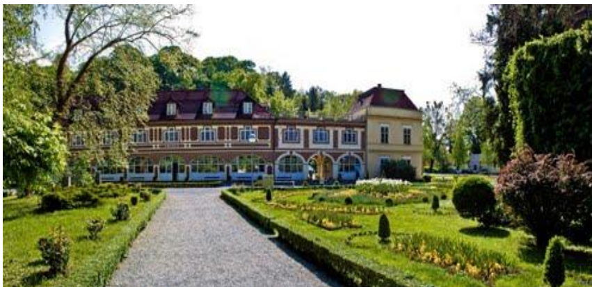
Slika 1: Arcadia

http://www.panoramio.com/user/217038/tags/Daruvar