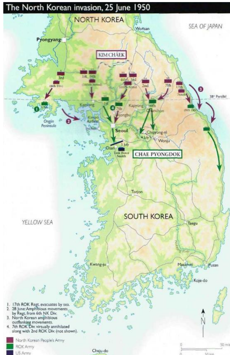
Slika 3. Prvotni napad Sjeverne Koreje, fokusiran na grad Seoul

U prvotnom napadu sudjelovalo je 10 sjevernokorejskih divizija koje su kopnenim putem namjeravali okružiti i uništiti južnokorejsku vojsku, i 1 pukovnija koja je izvršila amfibijski napad u blizini Seoula. 19 Efikasnost sjevernokorejske vojske iznenadila je zapadni