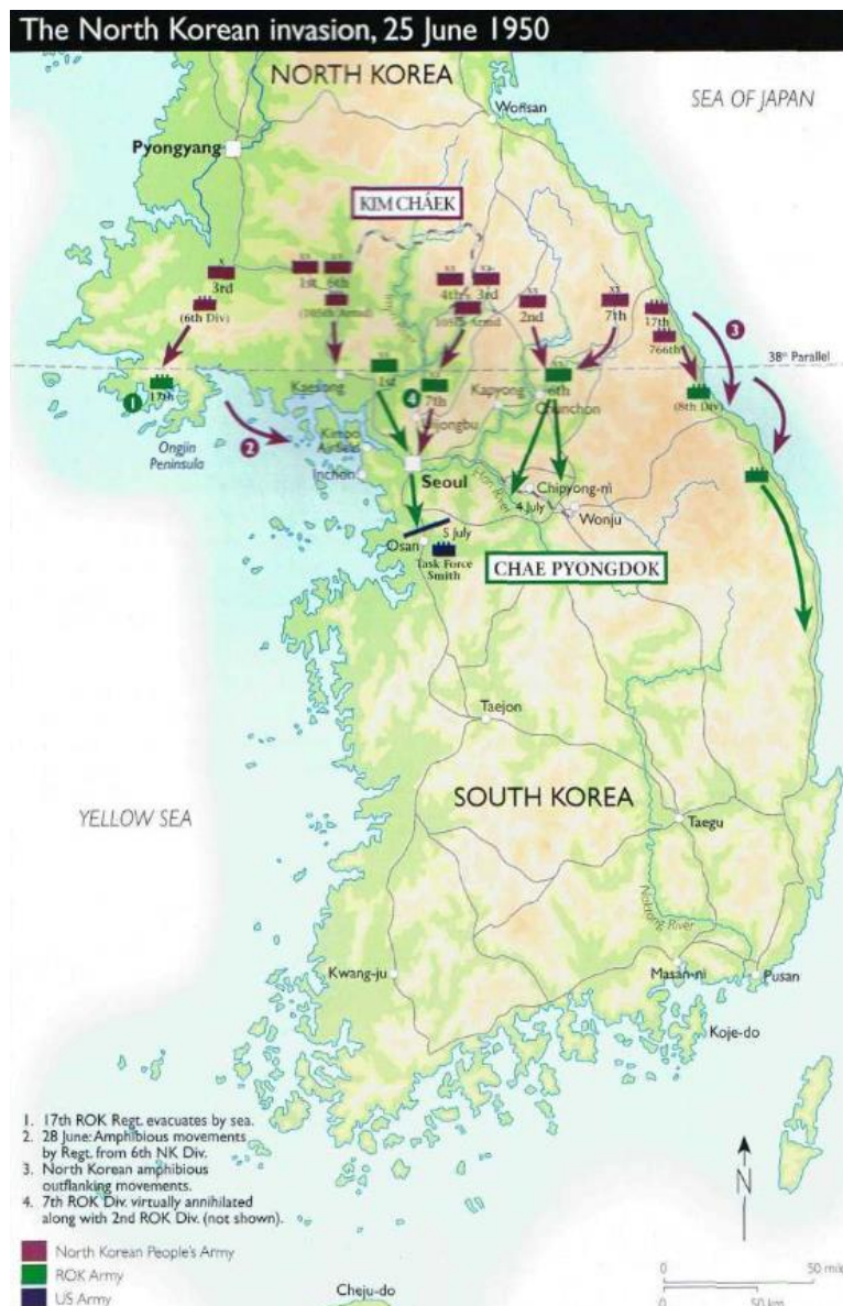
Slika 3. Prvotni napad Sjeverne Koreje, fokusiran na grad Seoul

U prvotnom napadu sudjelovalo je 10 sjevernokorejskih divizija koje su kopnenim putem namjeravali okružiti i uništiti južnokorejsku vojsku, i 1 pukovnija koja je izvršila amfibijski napad u blizini Seoula. 19 Efikasnost sjevernokorejske vojske iznenadila je zapadni