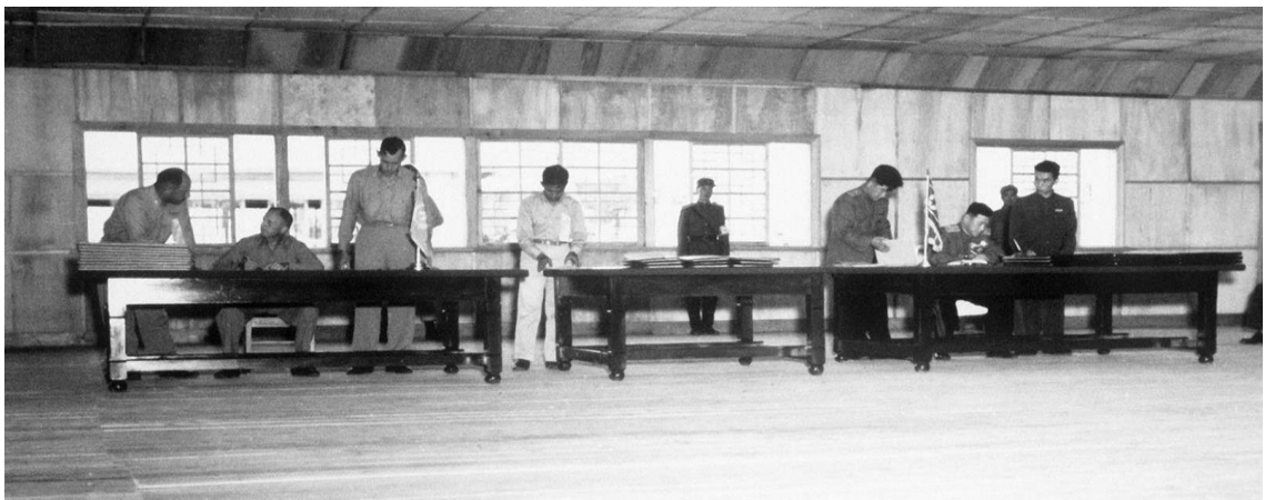
Slika 6. Korejski sporazum o prekidu vojnih aktivnosti potpisan između zaraćenih strana 27. srpnja 1953. godine

Koreje i Kine. Nakon prvotnog prekida vatre dogovorena je konferencija u Ženevi 1954. godine, na kojoj se potaknula rasprava o ujedinjenju korejskog poluotoka, no kao i u prijašnjim pokušajima do zadovoljavajućeg rezultata bilo je nemoguće doći, pretežito zbog ideološke komponente. Korejski rat tehnički je završio 1953. godine, 150.000 američkih vojnika izgubilo je svoje živote boreći se na strani Južne Koreje, dok je Sjeverna Koreja izgubila oko 1.3 milijuna vojnika, a Kina oko 800.000 do 1 milijun vojnika. 34 Rat je imao katastrofalne posljedice za Sjevernu Koreju, čija su gradovi i industrija bili gotovo kompletno uništeni, a sjevernokorejska populacija vidjela je drastičan demografski pad. Iako je tehnički korejski rat završen 1953. u realnosti situacija je bila potpuno drugačija jer do službenog primirja nikada nije došlo, stoga su u nadolazećim godinama bili česti upadi sjevernokorejske vojske na teritorij Južne Koreje, prilikom čega je život izgubilo nekoliko stotina civila i vojnika. Građani Južne Koreje nikada nisu zaboravili ključan doprinos SAD-a tijekom korejskog rata, podižući brojne spomenike američkim vojnicima, dok je pak situacija u Sjedinjenim Američkim Državama bila suprotna, rat se pretežito ignorirao jer nije postignuta odlučujuća pobjeda, a nadolazeći Vijetnamski rat, postao je velika tema unutar američke historiografije. 35