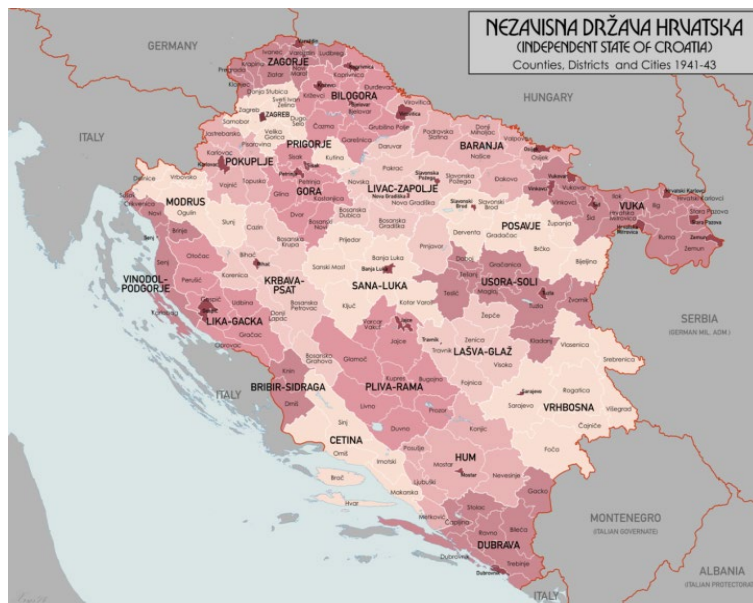
Karta 1. Administrativna podjela NDH od 1941. do 1943. 19

Vučjačka skupina 16,17 djelovala van tog geografskog okvira. Treba spomenuti i četnike s Majevice koji su potpisali primirje, ali ne i vrhovništvo NDH koje su u studenom 1942. razbili partizani. 18