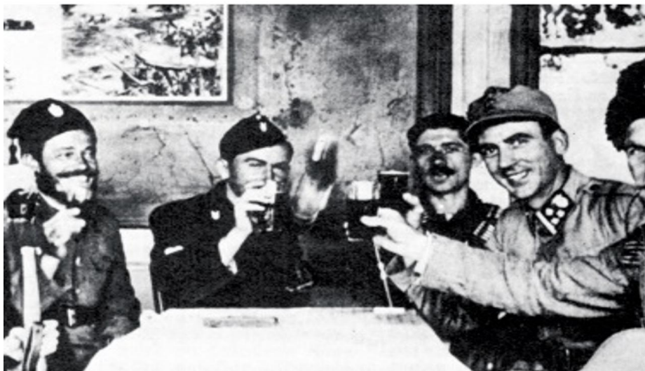
Slika 2. Druženje ustaških i domobranskih časnika s četničkim zapovjednicima. 40

Možda najapsurdniji primjer je bilo druženje ustaša i četnika, iako četnici nikako nisu željeli surađivati s Ustaškom vojnicom, već samo s Domobranstvom, postoje zapisi o „Druženju ustaša i četnika“, zbog čega su vlasti bile zabrinute, iako su propagirale suradnju. Ali postoji primjer gdje su Ozrenski četnici zarobili domobrane koji su utvrđivali prugu, 07. 09. 1942, iako su domobrani odmah pušteni, četnici nisu htjeli predati oružje, na što su im vlasti uskratile isporuku hrane. Sa Zeničkim četnicima je odnos bio napet, kako s vojskom tako i sa stanovništvom. U suštini su odnosi ovisili o lokalnim značajkama, dok su u nekim nisu niti postojali u veći su išli u željenom smjeru. 39