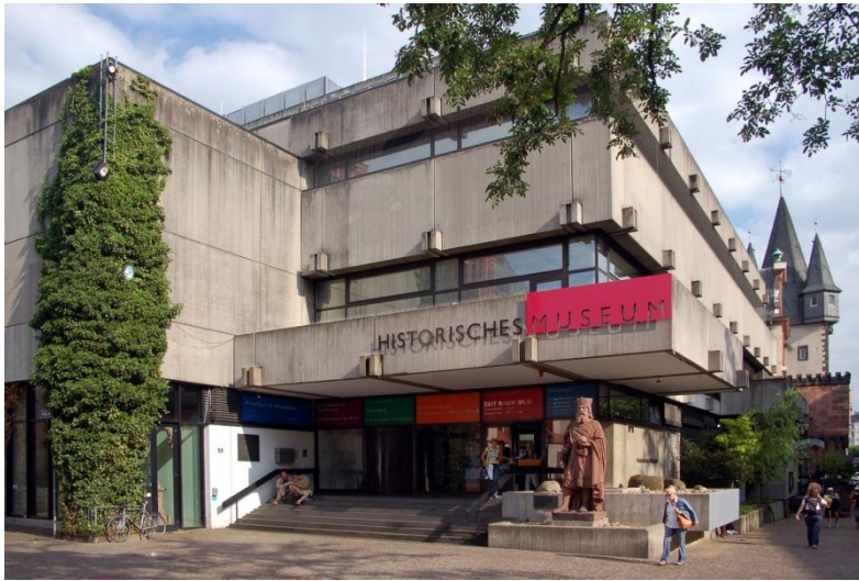
Slika 7. Frankfurtski povijesni muzej