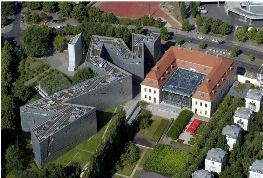
Slika 5. Židovski muzej