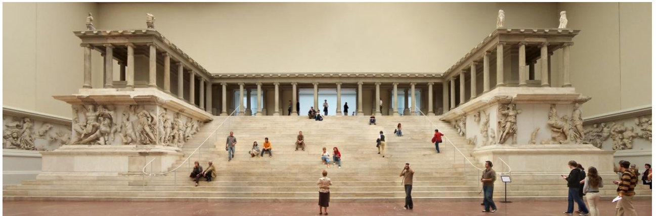
Slika 4. Muzej Pergamon