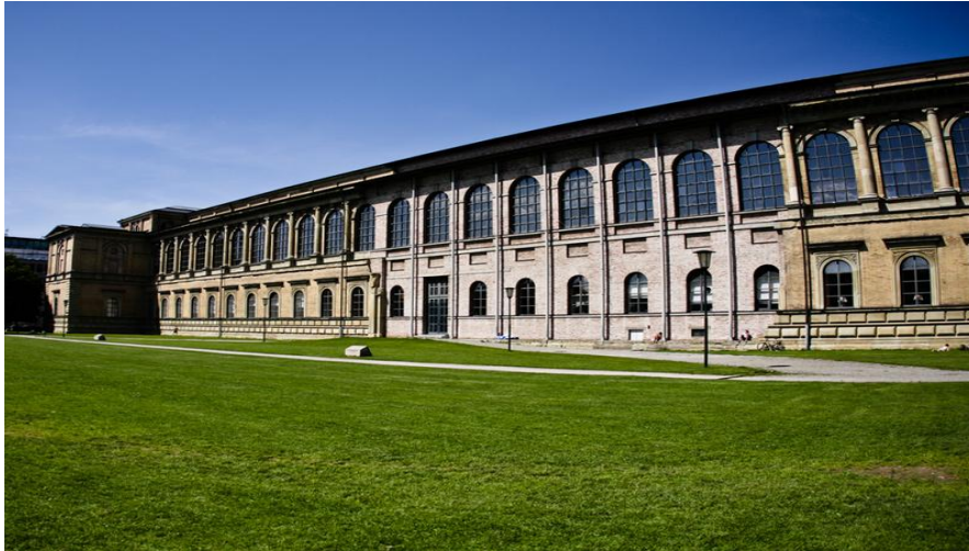
Slika 2. Alte Pinakothek