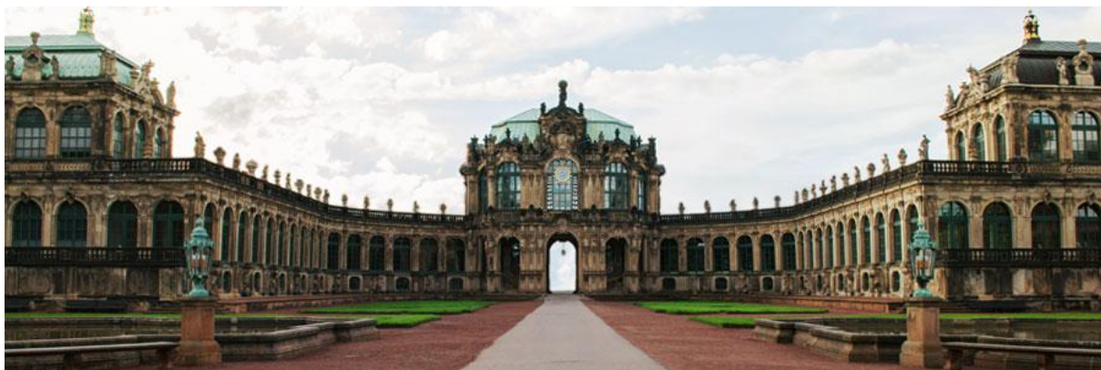
Slika 6. Zwinger mit Semperbau