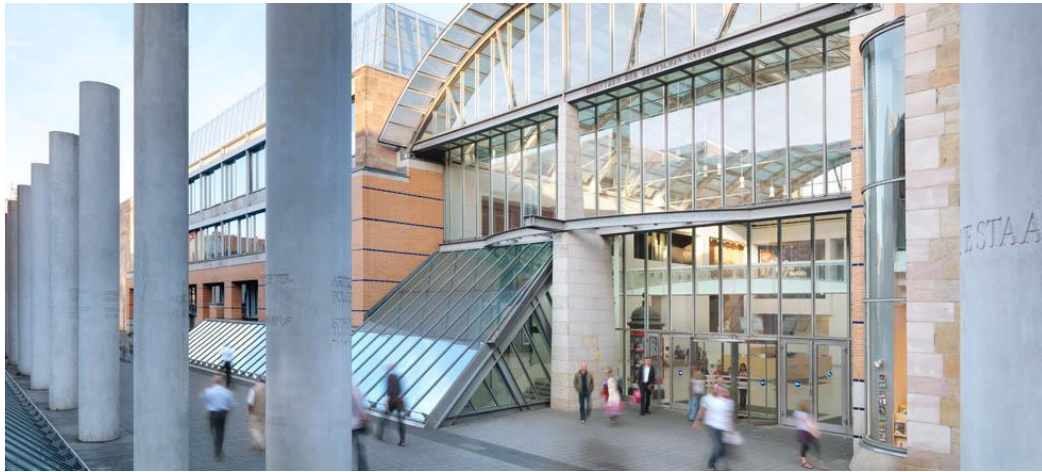
Slika 3. Germanisches National Museum