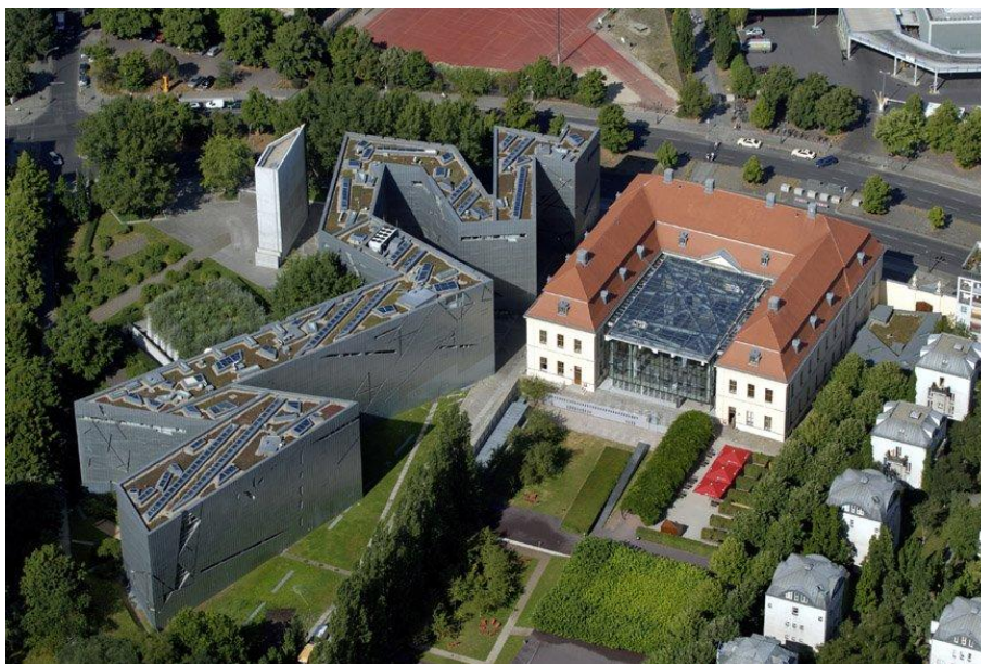
Slika 5. Židovski muzej