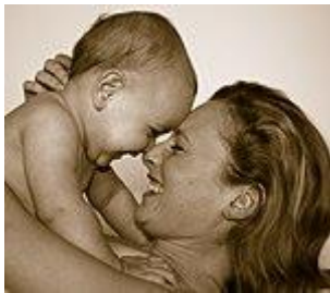
Slika 1. Majka i dijete

Djeca mogu i s očevima razviti snažnu emocionalnu povezanost te im postaju jako privržena i očevi povratno doživljavaju iste osjećaje. „Sigurnost djetetove privrženosti skrbniku ovisi o osjetljivosti skrbnika na dječje ponašanje. No čak i onda kada otac i dijete imaju vrlo siguran odnos, on vjerojatno nije toliko snažan kao odnos između oca i majke.“ (Vasta i sur., 2005: 481). Razna istraživanja pokazuju da djeca u trenucima uplašenosti ipak prije traže majku nego oca.