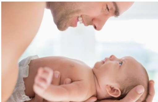
Slika 2. Otac i dijete