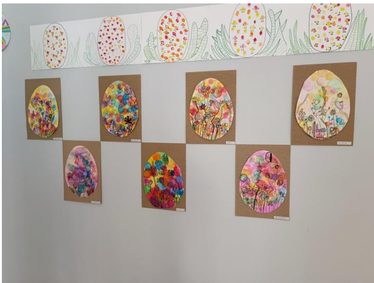
Slika 4 Radovi učenika („Uskršnje pisanice“)

Učenici su kao podlogu za svoje radove koristili smeđi regljasti hamer papir na koji su lijepili vesele pisanice obojane raznim vodenim bojama. Svojim pisanicama su dali dodatnu posebnost korištenjem flomastera uz pomoć kojega su crtali različite floralne motive. Radove su izradili učenici prvog razreda.