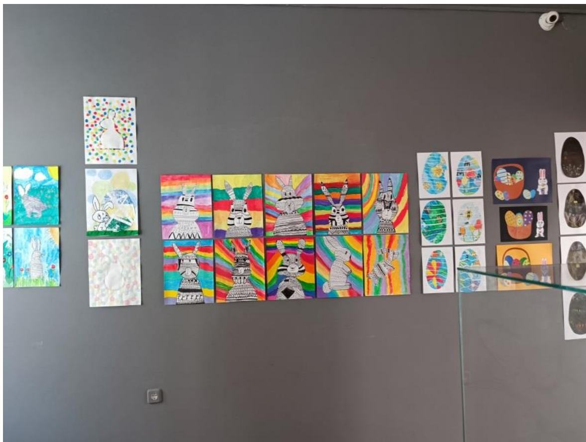
Slika 2 Učenički radovi („Uskršnji zeko“)

Kombiniranom tehnikom tempera i tuša, učenici su na veseo i zabavan način prikazali uskršnjeg zeku. Prilikom prikazivanja uskršnjeg zeku, također su se koristili i različitim crtama te tako dobili zanimljive dizajne.