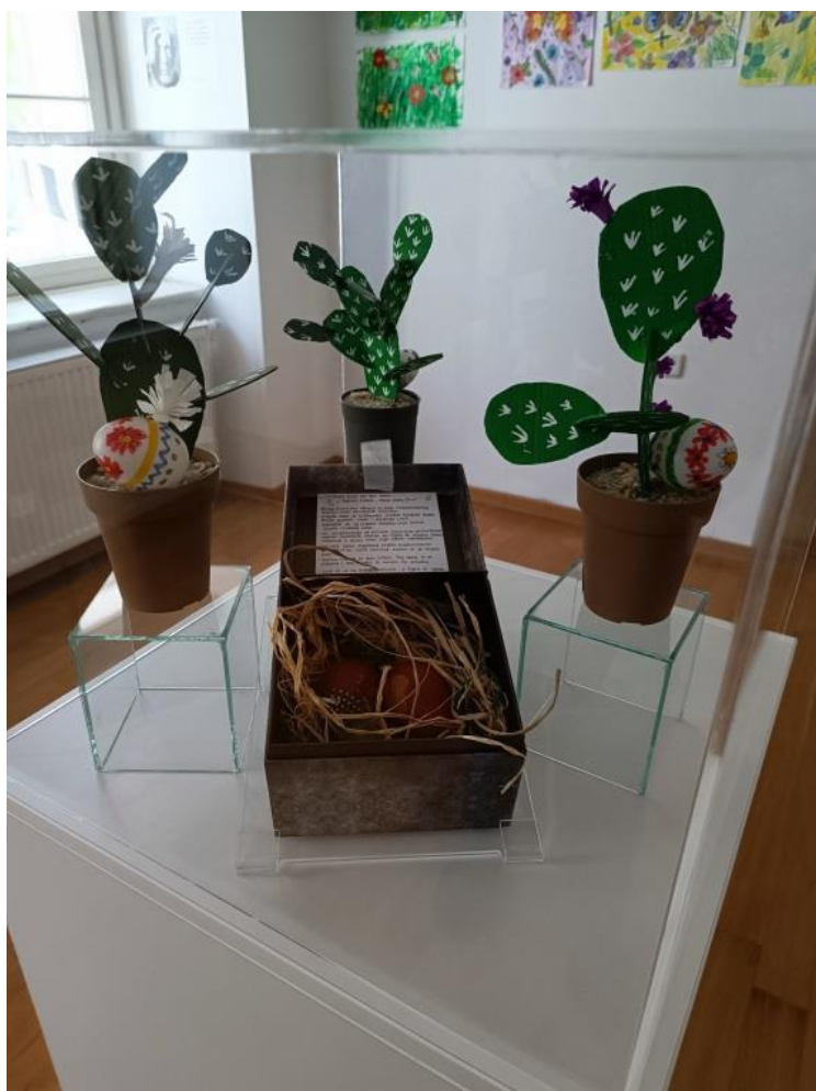
Slika 1 Rad učenika i učiteljica („Pisanice“)

U muzeju u Bjelovaru je 12. travnja 2022. godine otvorena izložba učeničkih radova. U izložbi su sudjelovale sve osnovne škole u Bjelovaru. Učenici su pod vodstvom učiteljica te korištenjem različitih tehnika, izradili svoje radove na temu Uskrs. Radovi učenika u muzeju su bili izloženi od 12. travnja do 7. svibnja te je izložba bila otvorena za sve zainteresirane. U nastavku će biti priložene fotografije sa radovima učenika i njihovih učiteljica.