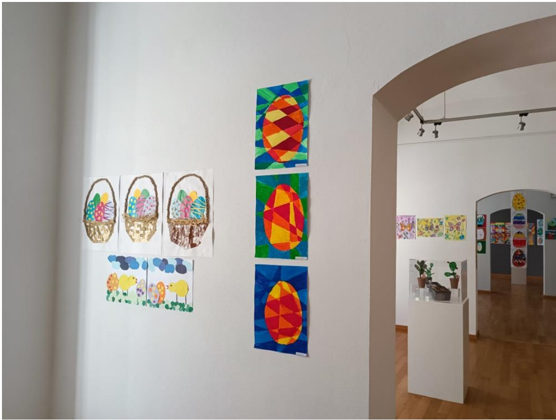
Slika 7 Radovi učenika („Uskršnja košara“)

Na fotografiji se nalazi nekoliko različitih radova koji su izrađeni različitim tehnikama. Za vesele uskršnje košare učenici su koristili kolaž papir te prirodni materijal, odnosno rafiju i špagu. Košaru su ispleli trakama smeđeg kolaža, ručku košare su izradili ispletenom špagom, a košaru su ispunili rafijom. Pisanice su izrezali i ukasili raznim bojama kolaž papira.