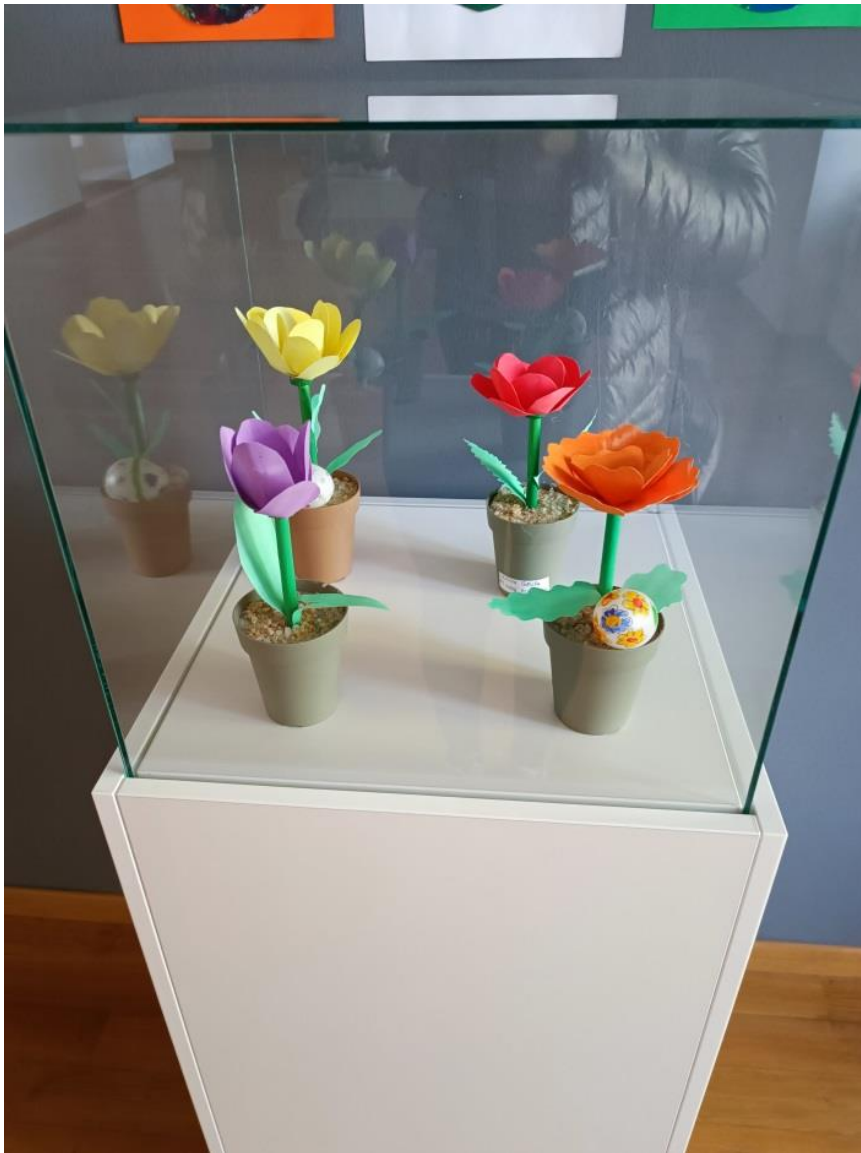
Slika 9 Radovi učenika i učiteljica („Proljeće“)

Učenici su na vrlo zanimljiv način koristili tanki karton u bojama te izradili teglice sa cvijećem. Svaki cvijet su napravili na drugačiji način tako što su koristili različite boje i oblike za latice te različite oblike lišća na stabljikama. Teglice su dodatno upotpunili pisanicama ukrašenim raznim motivima.