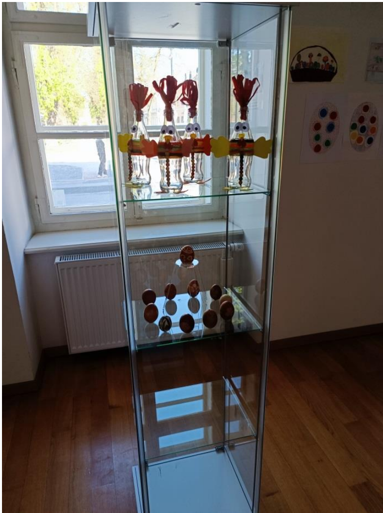
Slika 8 Radovi učenika- recikliranje ambalaže

Na fotografiji se može vidjeti vrlo zanimljiv način recikliranja ambalaže. Radovi su izrađeni od staklenih boca koje su ukrašene kartonima i papirima u boji, koncima različitih boja te drvenim kuglicama. Uz pomoć navedenih materijala, staklene boce pretvorene su u vesele koke. Na nižoj polici izložene su pisanice obojane na prirodan način te ukrašene zanimljivim motivima.