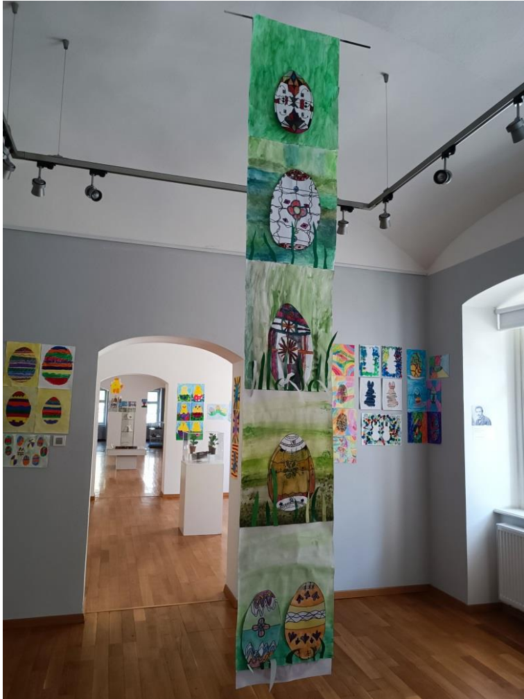
Slika 3 Radovi učenika („Pisanice u prirodi“)

Nijansiranjem zelenih vodenih boja učenici su na vrlo kreativne načine stvorili pozadinu livada i prirode u koju su zatim smjestili svoje pisanice ispunjene veselim bojama i dizajnima uz pomoć flomastera. Kako bi dodatno dočarali svoje livade, korištenjem zelenog kolaž papira, dodali su i nekoliko travki za realističniji dojam.