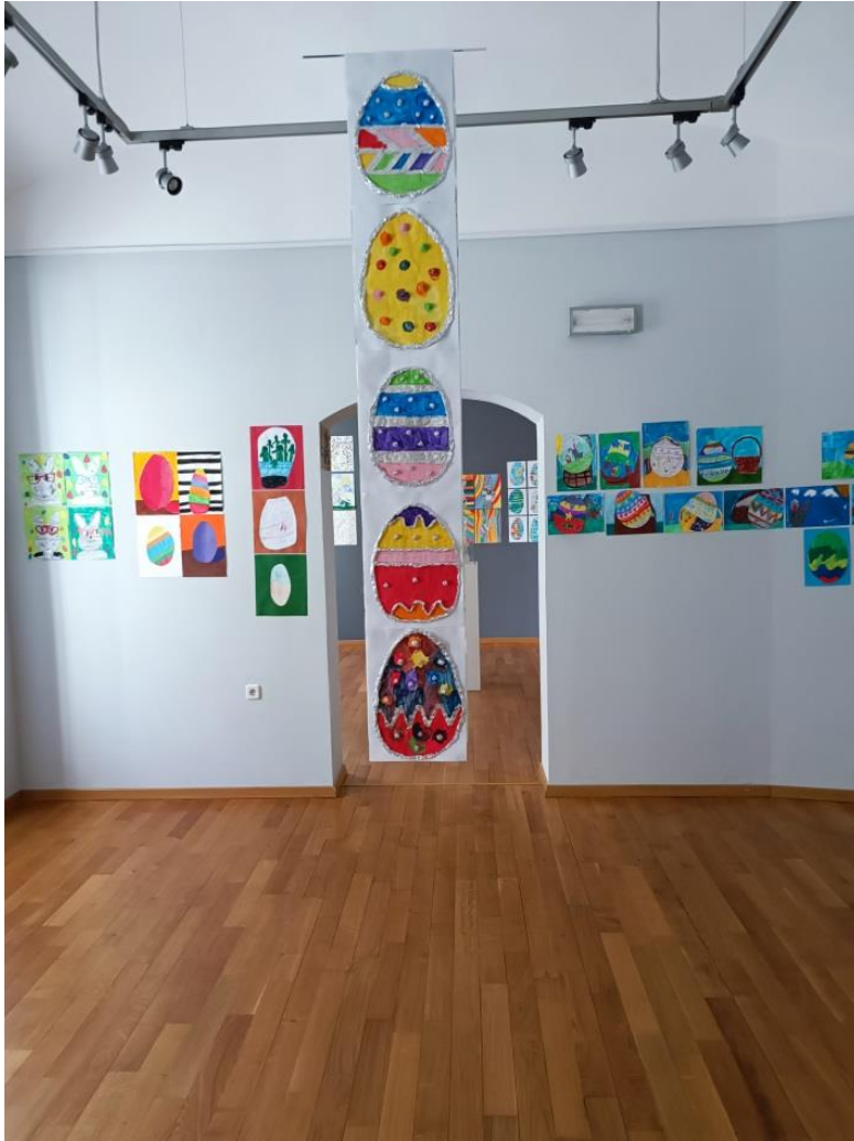
Slika 6 Radovi učenika („Šarene pisanice“)

Na fotografiji su prikazani radovi koje su učenici izradili na drugačiji i vrlo zanimljiv način. Oblik i razni detalji pisanica izrađeni su korištenjem alu-folije, a zatim je ostatak pisanice ispunjen raznim bojama korištenjem tempera. Učenici su detalje izradili uz pomoć crta različitih debljina i oblika te izradom kuglica.