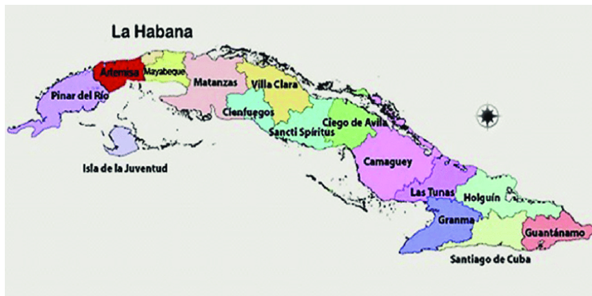
Imagen n°1. Mapa de Cuba con las 15 provincias marcadas

República de Cuba es un archipiélago ubicado en el hemisferio occidental y está rodeado por el Océano Atlántico, el Mar Caribe y el Golfo de México. Está formada por la Isla de la Juventud, la isla de las Antillas y otros islotes más pequeños. Su territorio está formado por quince provincias y 168 municipios (Imagen n°1). La Isla de la Juventud se define como un municipio especial (Oficina de información diplomática, 2021).