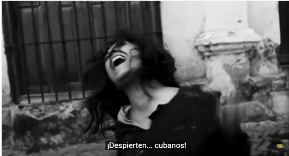
Imagen n°5. Llamado al levantamiento cubano y la lucha de los cubanos por la independencia (Lucía, 8:30)

Además de describir tres diferentes épocas en Cuba, tras su personaje Lucía, Solás muestra diferentes clases sociales que existían en Cuba. Así, en la primera parte Lucía pertenece a la aristocracia, en la segunda parte forma parte de burguesía y en la última es representada como una joven campesina (Chanan, 2004).