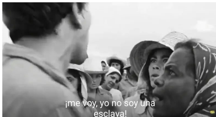
Imagen n°11. Lucía decide no volver con su marido (Lucía, 2:32:51)

Al final, Lucía se va de casa y empieza a trabajar de nuevo. Aunque su marido quiere que ella regrese a casa, ella dice que no lo va a hacer hasta que él no acepte su decisión de ir a trabajar. Aprendió a respetar a sí misma, luchar por sus derechos al trabajo y a la educación y llevar una vida libre. La violencia que se puede ver en algunas escenas representa un problema doméstico que aún existe en muchas familias.