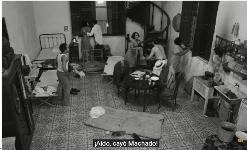
Imagen n°6. Llegó la noticia de la caída del gobierno de Machado (Lucía, 1:34:31)

Después de la caída del gobierno de Machado (Imagen n°6), el nuevo gobierno le ofreció el trabajo a Aldo, quien aceptó la oportunidad porque realmente quería que las cosas cambiaran, pero muy pronto se decepcionó. De nuevo se convirtió en un revolucionario, pero muy pronto lo mataron. Lucía se quedó viuda con un bebé en el camino.