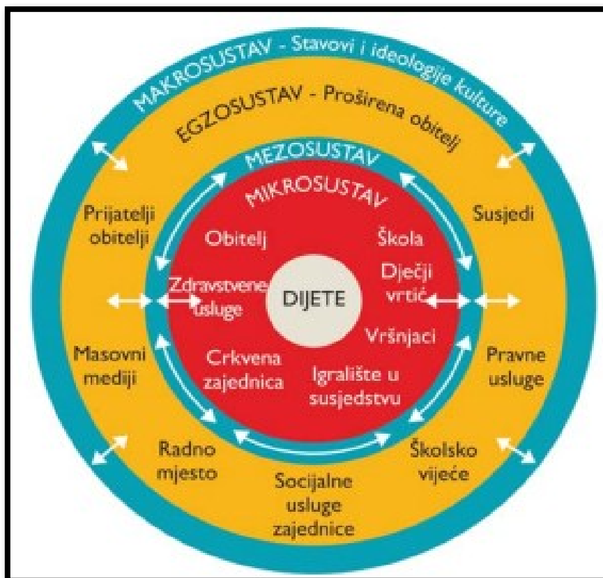
Slika 1. Bronfenbrennerov ekološki model razvoja