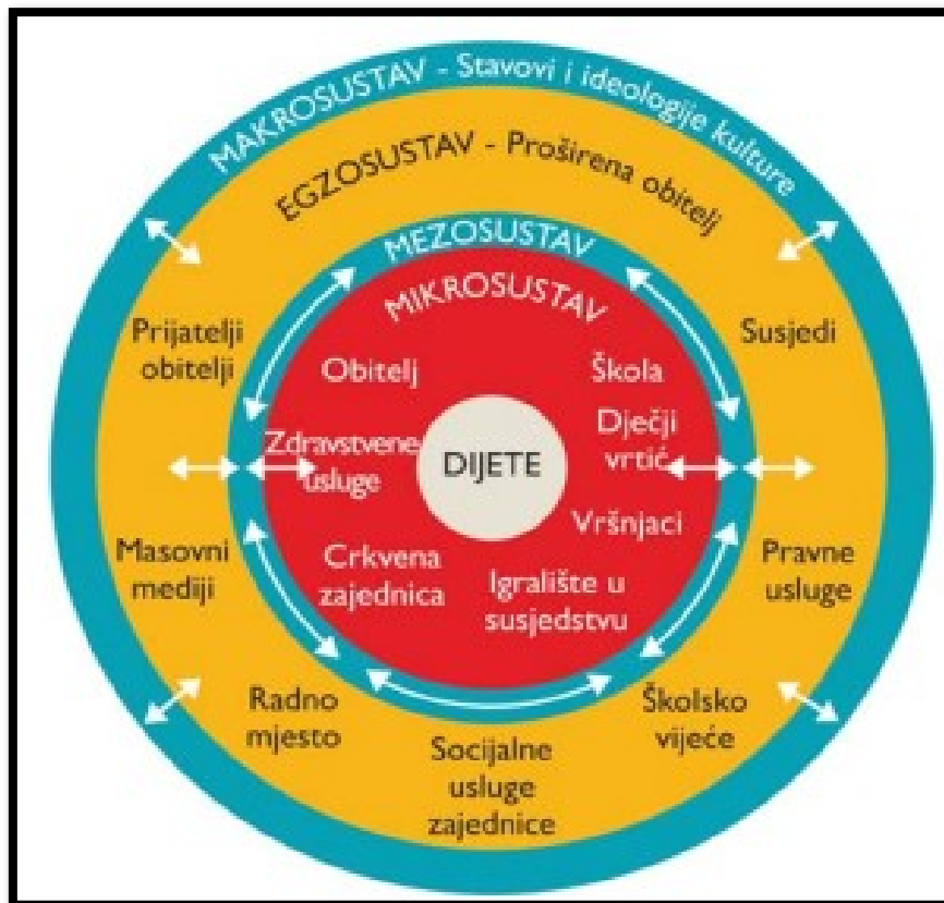
Slika 1. Bronfenbrennerov ekološki model razvoja

Izvor: Bronfenbrenner, U. (1997). Ekologija ljudskog razvoja. Beograd: Zavod za udžbenike i nastavna sredstva.