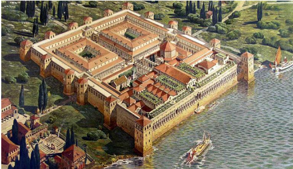
Slika 1 Dioklecijanova palača