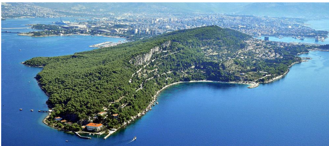
Slika 2 Kulturni krajolik poluotoka Marjana

Preuzeto sa: https://cronika.hr/2020/01/spasimo-marjan-pluca-naseg-splita-porucuju-iz-hsp-a-sdz/ (26-09-2021.)