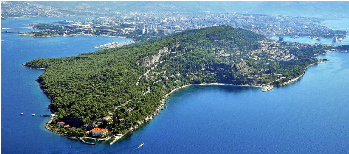
Slika 2 Kulturni krajolik poluotoka Marjana