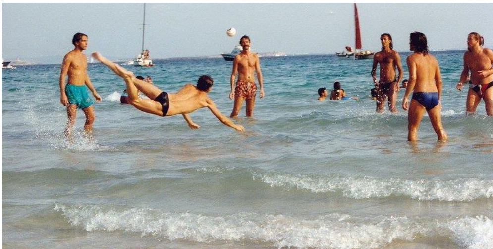
Slika 3 Igra picigin

U Registru kulturnih dobara nalazi se društvena igra picigin, koja je nastala u Splitu i igra se na pješčanoj, plitkoj plaži radi lakoće kretanja, a opet na dovoljnoj dubini da se ublaži pad. Spada u nematerijalnu baštinu te nije važan broj sudionika, igra velik broj ljudi i nije bitna dob. Igra se tako da se igrači dobacuju malom lopticom i loptica treba ostati što duže u zraku, odnosno cilj je da ne padne tako brzo. Za popularnu igru picigin, u Splitu je najbolja plaža Bačvice.