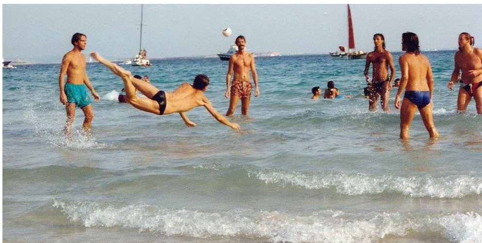
Slika 3 Igra picigin

U Registru kulturnih dobara nalazi se društvena igra picigin, koja je nastala u Splitu i igra se na pješčanoj, plitkoj plaži radi lakoće kretanja, a opet na dovoljnoj dubini da se ublaži pad. Spada u nematerijalnu baštinu te nije važan broj sudionika, igra velik broj ljudi i nije bitna dob. Igra se tako da se igrači dobacuju malom lopticom i loptica treba ostati što duže u zraku, odnosno cilj je da ne padne tako brzo. Za popularnu igru picigin, u Splitu je najbolja plaža Bačvice.