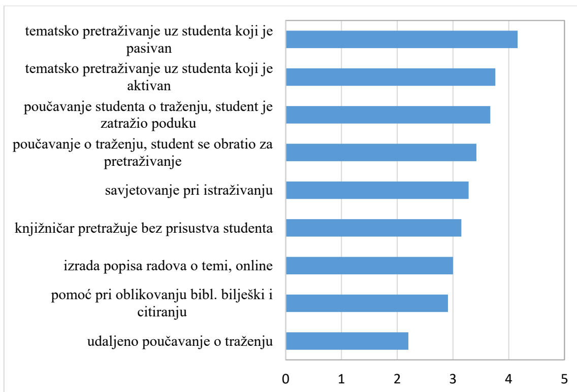
Grafički prikaz 1. Aritmetičke sredine učestalosti pružanja usluga i aktivnosti koje uključuju individualnu pomoć studentima u traženju informacija u fakultetskim i sveučilišnim knjižnicama