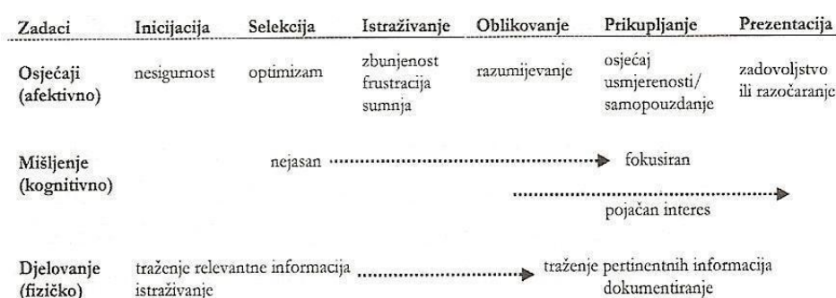
Slika 1. ISP model (Kuhlthau, 1993, prema: Špiranec i Banek Zorica, 2008: 51)

Model se temelji na konstruktivističkom pristupu učenju i načelu nesigurnosti gdje je osjećaj nesigurnosti predstavljen kao jaki motivator za nastavak ili odustajanje od procesa traženja informacija, odnosno zadovoljavanja određene informacijske potrebe. Model (Slika 1.) predstavlja šest faza u traženju informacija: upoznavanje sa zadatkom (inicijacija), odabir teme (selekcija), istraživanje šireg područja i usmjeravanje istraživanja, definiranje žarišta (formulacija), prikupljanje informacija i zaključivanje pretraživanja i početak pisanja odnosno predstavljanja rada (Kuhlthau, 1993: 35-37, prema: Špiranec i Banek Zorica, 2008: 50-51).