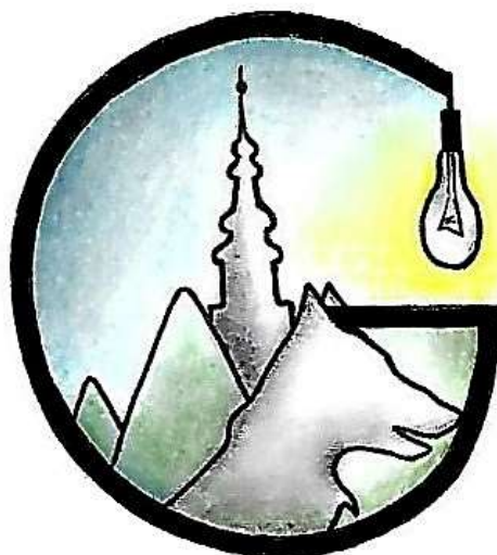
Slika 14: Prijedlog logotipa grada Gospića