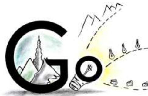
Slika 15: Skicirani predložak logotipa aplikacije „GO“

Izvor: autorska izrada Grgurić A., univ. bacc. ing. des. text. (2021.)