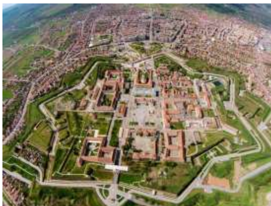
Slika 6: Tvrđava Alba Carolina