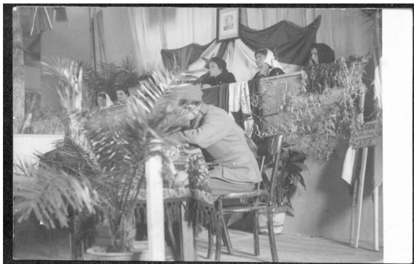
Slika 1. Baraka kod turskih kuća u Zadru u kojoj se odvijala prva Okružna konferencija AFŽ-a za okrug Zadar 15.11.1944. godine.

Zadarsko područje je od osnutka AFŽ-a 1942. pa do svibnja 1943. bilo dio Sjevernodalmatinskog okruga nakon čega se formira prvi Inicijativni odbor AFŽ-a za okrug Zadar. U obavijesti Oblasnom odboru AFŽ-a za Dalmaciju o ovoj vijesti žene pišu i o stanju na terenu: