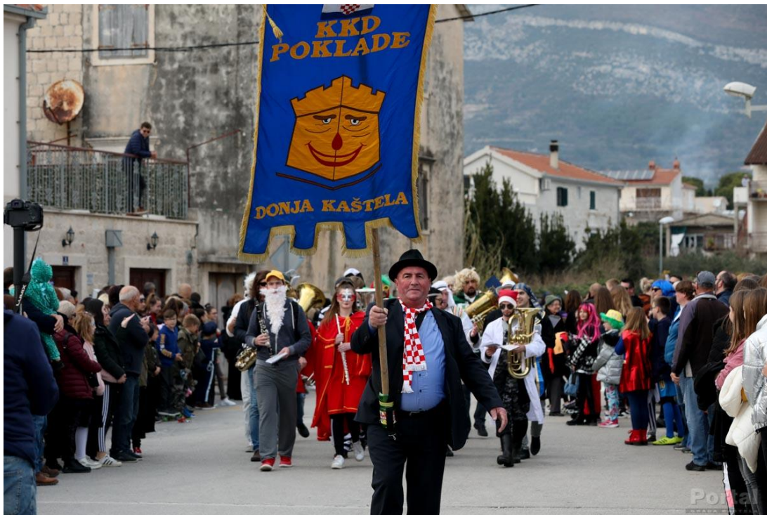
Slika 1.: Početak povorke