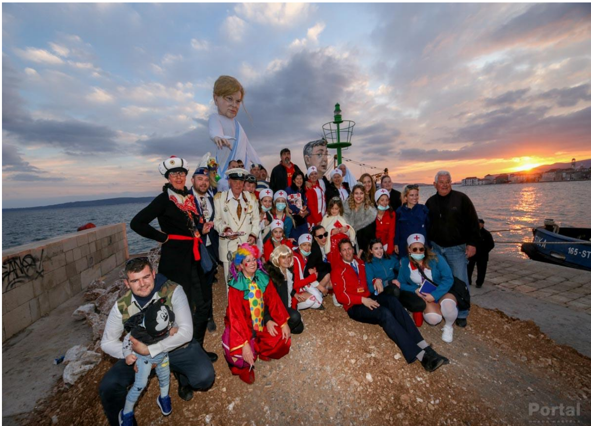
Slika 4.: Fotografiranje ispred krnje prije paljenja

Karnevalska povorka završila je oko 17:00 sati. Nakon nje, slijedilo je paljenje krnje. Krnja se palila oko 17:20 h. Prije paljenja, sudionici Donjokaštelanskog krnjevala okupili su se ispred krnje kako bi se fotografirali. Nakon što je krnja bila spaljena, uputila sam se, zajedno sa članovima KKU „Poklade“, prema radionici o kojoj ću kasnije više reći.