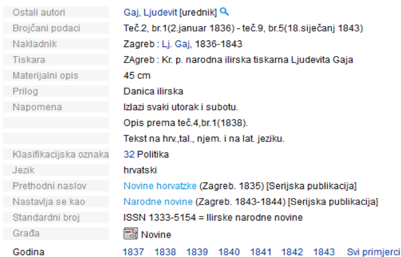
Slika 2. Primjer zapisa kod promjene naslova u katalogu Knjižnica grada Zagreba