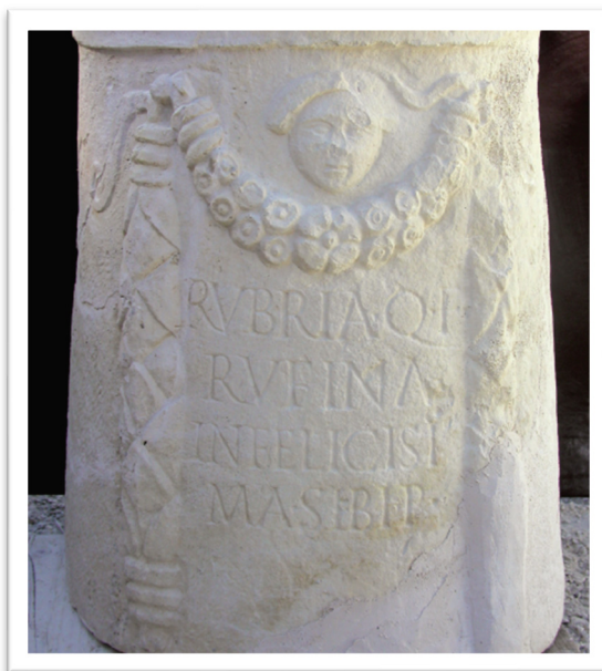
Slika 3. Liburnski cipus s natpisom Rubrije Rufine (I. FADIĆ, 2004., 84.)

U ovim primjerima vidimo kako imenovanje aserijatskih žena nije bilo usuglašeno, ali isto tako to također možemo pripisati individualnim preferencijama osoba koja su im dodjeljivale imena. No, ono što je sigurno jest da isticanjem svoga imena isto tako ističu svoj ženski identitet što možda najbolje pokazuje cipus Rubrije Rufine. Razlog njezinog podizanja spomenika samoj sebi možda leži u mogućnosti da nije imala muža ili nasljednika pa je na ovaj način htjela zabilježiti svoje ime i položaj ukopa.