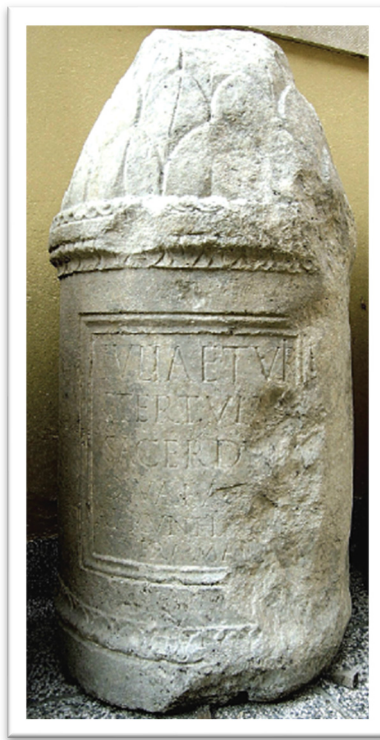
Slika 5. Cipus Julije Tertulle (K. A. GIUNIO, 2007., 154.)

ženama. Isto tako, sama činjenica da je Julija Tertula bila svećenica povlači za sobom viši društveni status te određeni utjecaj u društvu i to ne samo nje, već bi se dio toga utjecaja mogao preslikati i na njezinu majku koja se ipak identificirala preko svoje društveno visoko pozicionirane kćeri. Isto tako, u rimskoj provinciji Dalmaciji još je natpisa žena koje su bile svećenice božanske Auguste, kao npr. u Naroni gdje je natpis Papiæ Brocchinæ: Papia L(uci) f(ilia) / Brocchina / sacerdos Divæ / Aug(ustæ) Testamento poni iussit 101 i Claudiæ Aeserninæ: Saturno / Aug(usto) sac(rum) / Claudia / Aesernina / sacerdos / Divæ Augustæ / t(estamento) p(oni) i(ussit) . 102 Isto tako, valja napomenuti da takve službe nisu mogle obavljati žene iz svih društvenih staleža, već samo one koje dolaze iz uglednih i bogatih obitelji.