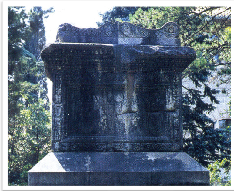
Slika 8. Ara Pomponije Vere ( N. CAMBI. 2015., 82.)

Isticanje takvog podatka izravno govori da je Pomponija bila žena višeg statusnog položaja i dobro financijski situirana te je to iskazala podizanjem velikog nadgrobnog spomenika te isticanjem količine novca koju je ostavila za izgradnju spomenika. 118