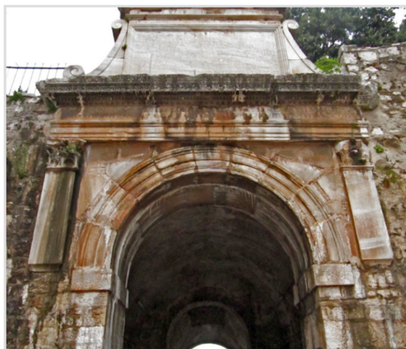
Slika 1. Slavoluk Melije Anijane

Ovdje je riječ o najvećoj privatnoj donaciji koloniji Jader, s tim da je i jasno izražena utrošena svota novca koja ujedno govori o velikoj statusnoj poziciji osobe koja je zaslužna za nju. Samim tim popločanjem i podizanjem slavoluka ona je iskazala svoj statusni identitet te su njena djela i njeno ime ostali trajno uklesani u kamen čime je zasigurno osigurala i poštovanje zajednice. Isto tako, kako je ona dala urediti emporium , tako je Apuleja Kvinta, kako saznajemo preko čak dvaju natpisa, dala dijelom opremiti kapitolijski hram koji je glavni hram u gradu te samim tim akcijama daje naslutiti da se nalazi visoko na društvenoj statusnoj ljestvici.