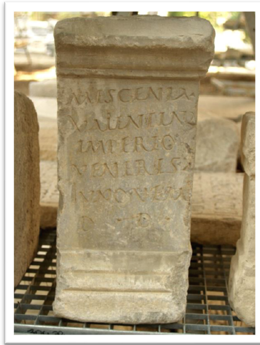
Slika 9. Natpis Mescenije Valentine (S. BEKAVAC, 2015., 52.)

Nemali broj natpisa govori o velikim građevinskim pothvatima iza kojih stoje žene. Jedan od natpisa koji svjedoči o tome je onaj Kurije Priske (Slika 10.) koji govori o obnovi te opremanju svetišta Velike Majke: Curia Pris/ca Matri magnae / fanum r<e=i>fecit / signa posuit laro/phorum cymbala / tympana / catillum / fortifices aram dat l(ibens) a(nimo). 121 Kurija Priska navodi kako je obnovila te opremila svetište kipovima i postoljima za kipove Lara, cimbale, timpane, zdjelicu, mašice i žrtvenik. Tim akcijama jasno je dala do znanja kako je bila jako dobro financijski situirana što povlači za sobom činjenicu da je uživala visok status u društvu. Nadalje, Statilija Lupula obnovila je svetište Velike Majke: [----] Lupula Statili[a] / [tem]plum Matris Ma<gn=NG>[ae] / [deo]rum de su ore/[stitu]it cum suis f<i=E>l(iis). 122 Junija Rodina je, s druge strane, zajedno s mužem i sinom ili kćeri obnovila i proširila hram Velike Majke što vidimo na natpisu: Iunia Rhodine / cum coniuge et fil(io?) / d(eum) M(atri) M(agnae) aedem refecit / et ampliavit (votum) s(usceptum) s(olvit) l(ibens) m(erito). 123 Servilija Kopiježila je pak o svom trošku dala izgraditi edikulu Velikoj Majci za što se zavjetovao njen muž Marcus Cottius Certus: Servilia M(arci) filia / Copiesilla / aediculam M(atri) Mag(nae)