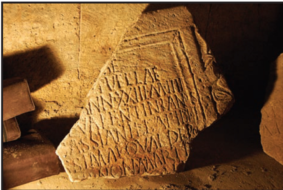
Slika 7. Ulomak natpisa djevojčice (D. DEMICHELI, 2008., 66.)

sahranjena. Također, postoje i primjeri gdje se točno navodi koliko je godina, mjeseci i dana određena osoba imala u trenutku smrti, pa čak i datum sahrane što daje točniji životni vijek (Slika 7.): [-----]ae / [-----] puellae / [quae vixit] ann(os) XXIII m(enses) IIII / [d(ies)---] I Valentinianus / 5 [et] Cassianilla filiai (sic) / [pii]ssimai quai (sic) depo/[sita di]e III non(as) Mart[ias] in / [-----] ove?[---]. 117 Napis podižu Valentinianus i Cassianilla svojoj kćeri čije ime nije sačuvano, no znamo da je umrla s 23 godine i 4 mjeseca dok je broj dana nepoznat zbog fragmentiranosti natpisa. Ovdje je također naveden točan datum sahrane pa tako doznajemo da je djevojka sahranjena 3 dana prije martovskih nona. Takvi natpisi nisu pronađeni samo u Saloni, već ih ima i u okolici, točnije Kaštelima.