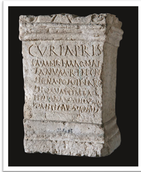
Slika 10. Žrtvenik Kurije Priske (I. V. BRČIĆ, 2018., 21)

/faciendam curavit / ipsa i<m=N<pe(n)sa sua quam / voverat pro ea M(arcus) Cot/tius Certus / vir eius. 124