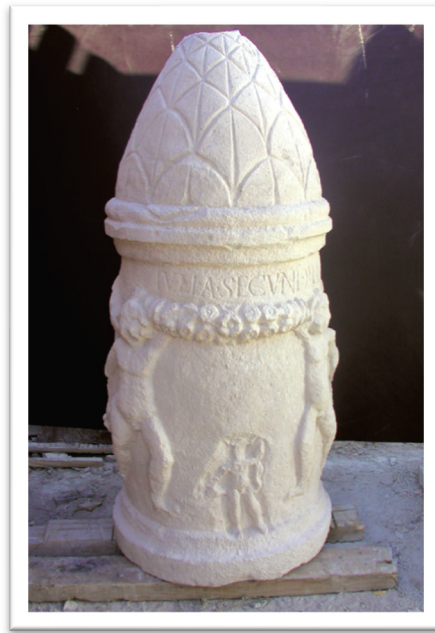
Slika 2. Cipus Julije Sekundile (I. Fadić, 2004., 79.)

čak i prijateljice, dakle kao osobe koje imaju određenu ulogu kako u vlastitoj obitelji, tako i u društvu. Naravno, uvijek ima žena koje odluče uklesati samo svoje ime. Jedan od primjera je natpis: Iulia Secundilla . 93 Julija Sekundila (Slika 2.) na svome spomeniku nema nikakvu posvetu ili završnu formulu, pa čak ni filijaciju. Identificirala se samo preko svoga imena. Unatoč kratkom natpisu, na samo podizanje spomenika možemo gledati kao na isticanje vlastitoga status jer je ipak riječ o činu koji za svoje ostvarenje podrazumijeva određene financijske izdatke.