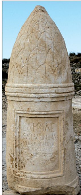
Slika 6. Liburnski cipus Bebije Saturnine (K. A. GIUNIO, 2007., 155.)

Bebiji Saturnini, Julija Jadestina naglasila ne samo njezin religijski identitet, već i svoj individualni. Uz samu vjersku ulogu koju su imale, to je također značilo da su uživale određenu čast i veći društveni status. 104