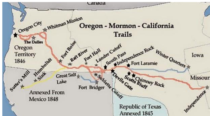
Slika 3: Kopnena ruta do Kalifornije

Cutoffom, kojim bi se stiglo u gornji dio doline Sacramento, a ruta je bila nepoznata na kartama pa se snalazilo pomoću dobivenih neslužbenih informacija. 59