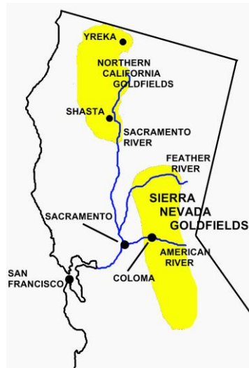
Slika 1: Područja nalazišta zlata

domorodcima, tako da mu je Richard Mason, vojni namjesnik, odbio dati službeno priznanje za to područje, koje stoga nije pripalo njemu. 4