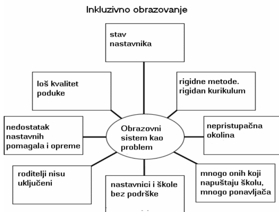
Slika 2.- Osnovne pretpostavke inkluzije u kontekstu odgoja i obrazovanja

Kao što je iz slika vidljivo ključni problem u integraciji predstavlja učenik dok je u inkluziji to obrazovni program koji ne može pružiti adekvatnu poduku djetetu, odnosno osobi s posebnim potrebama. Pa tako u prvom slučaju možemo vidjeti kako integracija na dijete gleda